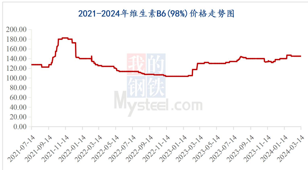
图 8 2021-2024 年维生素 B6 价格走势

本周国内市场主流报价 142-148 元/kg，厂家停止报价，市场偏稳运行，市场需求较一般。