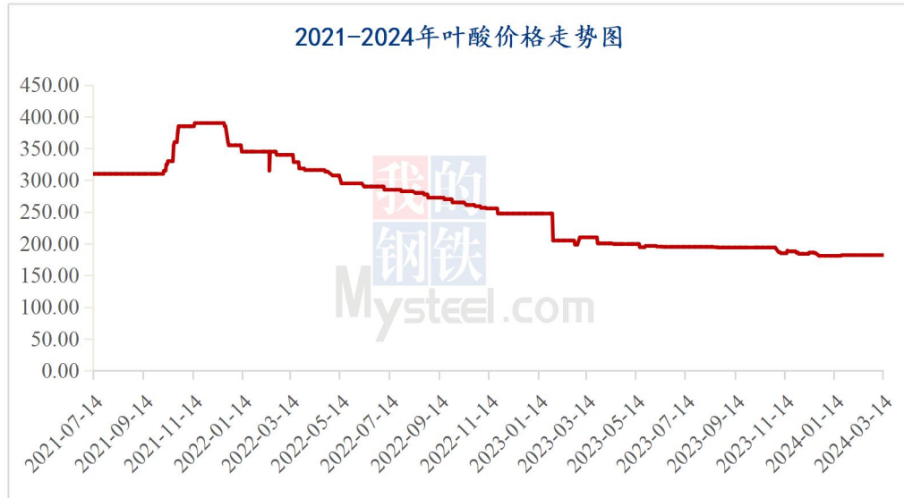
图 11 2021-2024 年叶酸价格走势图

本周国内叶酸市场主流报价 179-185 元/kg，下游需求一般，市场实际成交一般，价格偏稳运行。