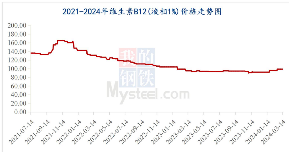
图 9 2021-2024 年维生素 B12 价格走势