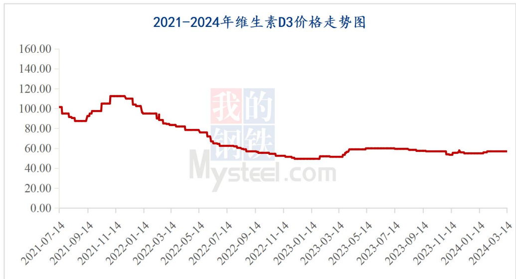
图 4 2021-2024 年维生素 D3 价格走势