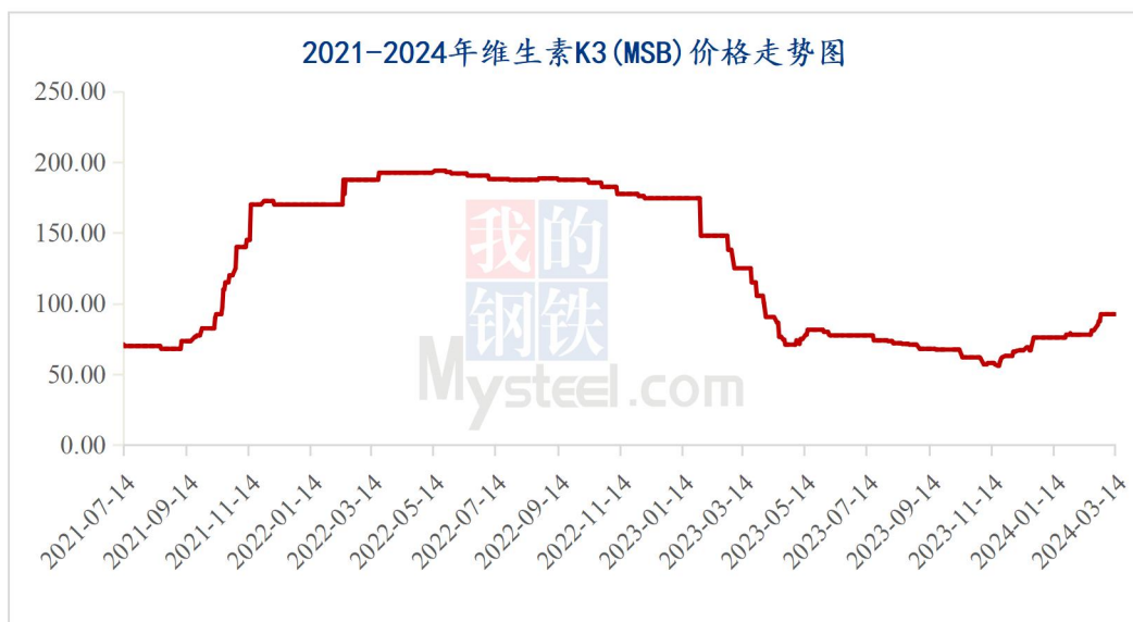
图 10 2021-2024 年维生素 K3 价格走势

本周国内维生素 K3 (MSB) 市场主流价格在 90-95 元/kg，MNB 市场价格在 100-105 元/kg。下游需求一般，工厂供货偏紧，市场价格偏稳运行。