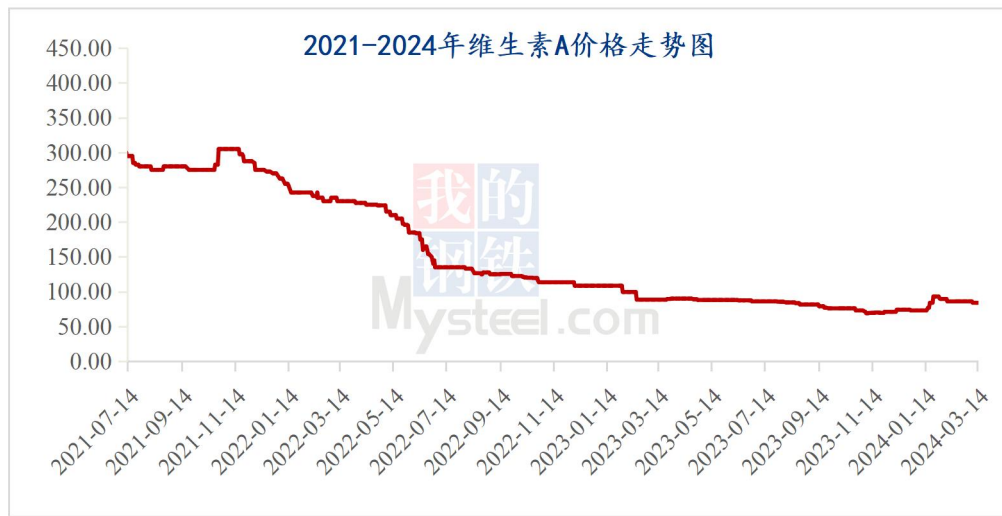
图 1 2021-2024 年维生素 A 价格走势图

据 Mysteel 对全国维生素市场价格调查，本周维生素 VA500 市场价格 82-86 元/kg，国外工厂上调报价，国内市场下游需求一般，观望为主，市场报价偏稳震荡。