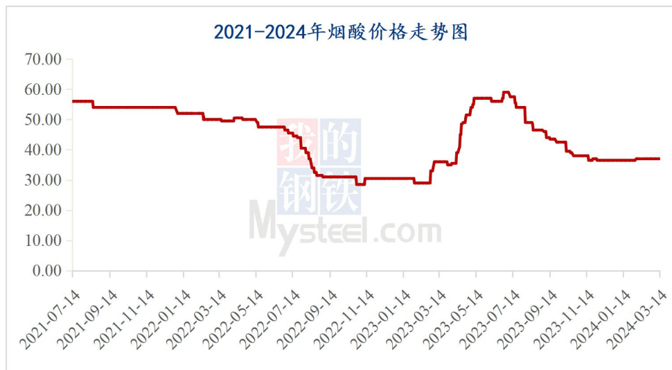
图 15 2021-2024 年烟酸价格走势图

本周国内市场主流报价 36-38 元/kg，市场成交较一般，市场询单一般，交投价格平稳偏弱，部分价格略低。