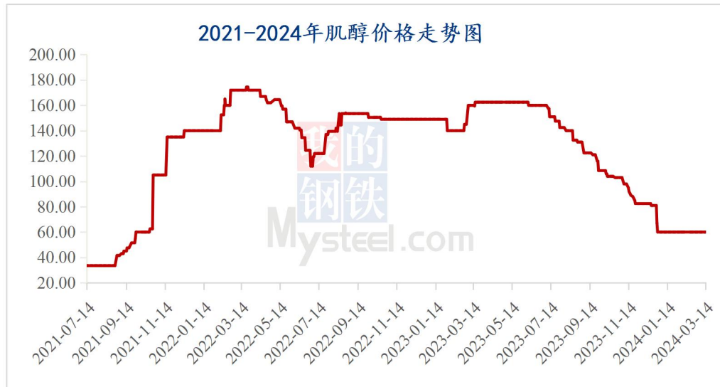
图 14 2021-2024 年肌醇价格走势图

本周国内肌醇市场报价 55-65 元/kg，价格弱稳运行，市场需求较弱，市场供大于需，关注后期市场成交情况。