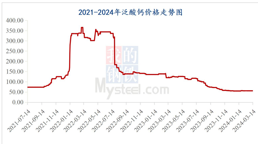
图 5 2021-2024 年泛酸钙价格走势

本周国内泛酸钙市场主流价格在 54-58 元/kg，下游需求一般，部分厂家停止报价，市场价格平稳运行。