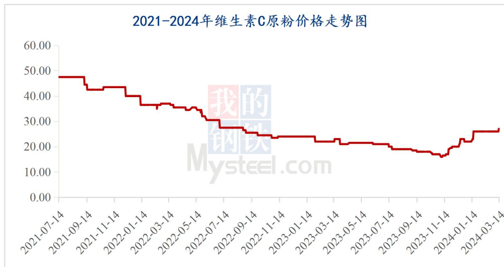
图 3 2021-2024 年维生素 C 价格走势

本周 VC 原粉国内市场报价 26-28 元/kg，厂家停止报价，市场询单较活跃，涨价情绪强烈，价格偏稳趋强震荡。