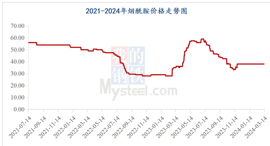
图 13 2021-2024 年烟酰胺价格走势

本周国内市场主流报价 36-40 元/kg，厂家停止报价，市场价格偏稳运行，市场询单一般，交投价格平稳，部分价格略低。