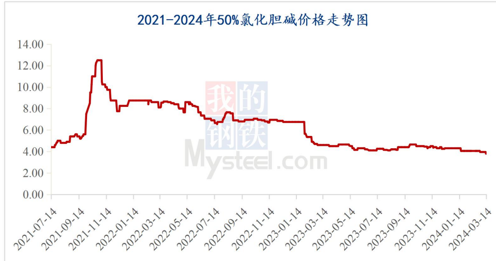
图 16 2021-2024 年氯化胆碱价格走势

本周国内氯化胆碱市场价格 3.7-3.9 元/kg。胆碱受原料三甲胺价格小幅波动，胆碱工厂报价小幅下调，后续主要关注其原料端三甲胺及环氧乙烷变化情况。