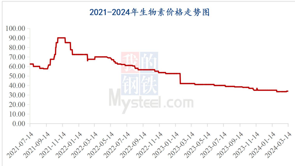
图 12 2021-2024 年生物素价格走势