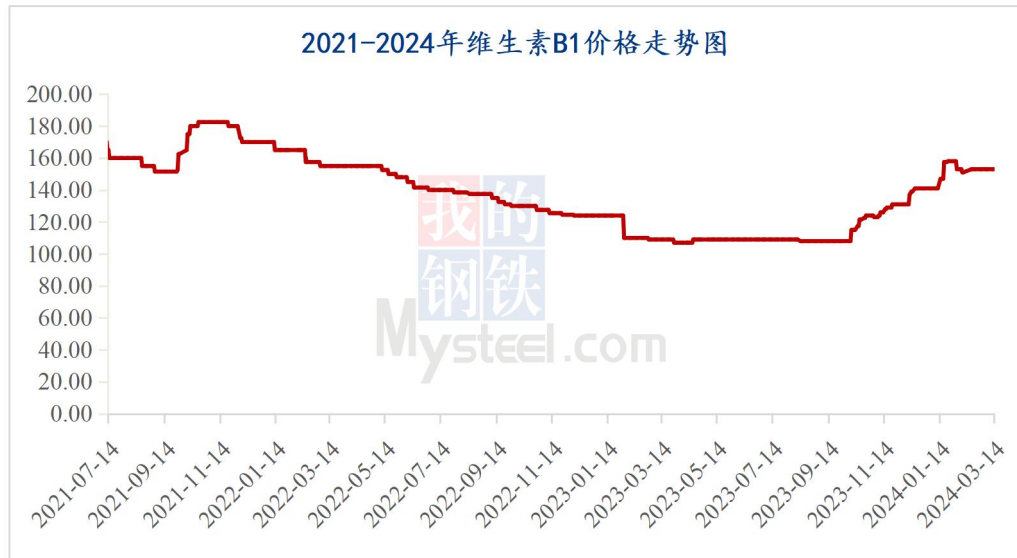
图 6 2021-2024 年维生素 B1 价格走势图

本周国内维生素 B1（80%）市场报价在 150-156 元/kg，下游需求一般，市场询单一般，市场成交价格暂稳。