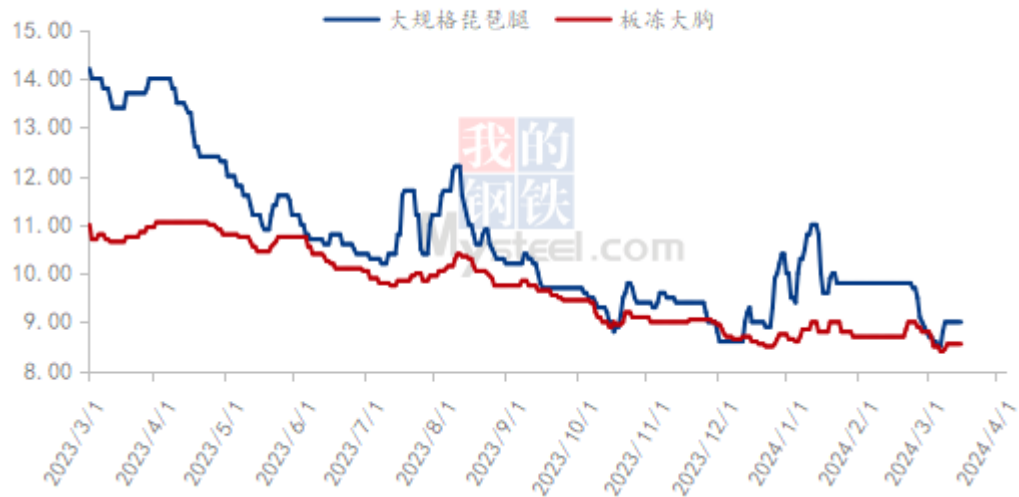
(2023年-2024年) 全国大规格琵琶腿、板冻大胸价格走势图 (元/公斤)