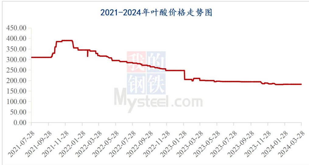
图 11 2021-2024 年叶酸价格走势