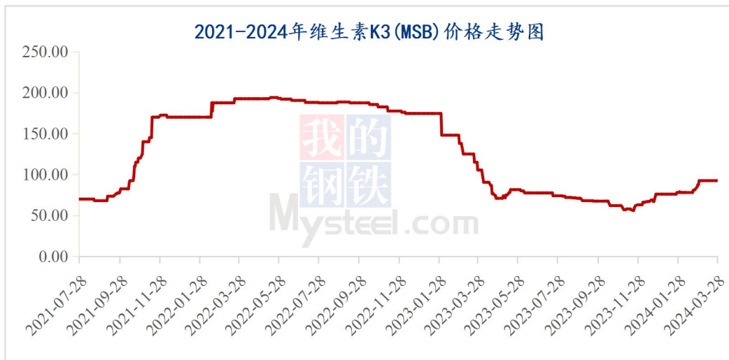
图 10 2021-2024 年维生素 K3 价格走势

本周国内维生素 K3（MSB）市场主流价格在 88-94 元/kg，MNB 市场价格在 98-104 元/kg。下游需求一般，工厂供货偏紧，市场价格偏稳运行。