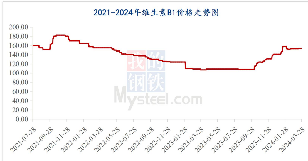
图 6 2021-2024 年维生素 B1 价格走势

本周国内维生素 B1（80%）市场报价在 152-156 元/kg，下游需求一般，市场询单一般，市场成交价格偏强。