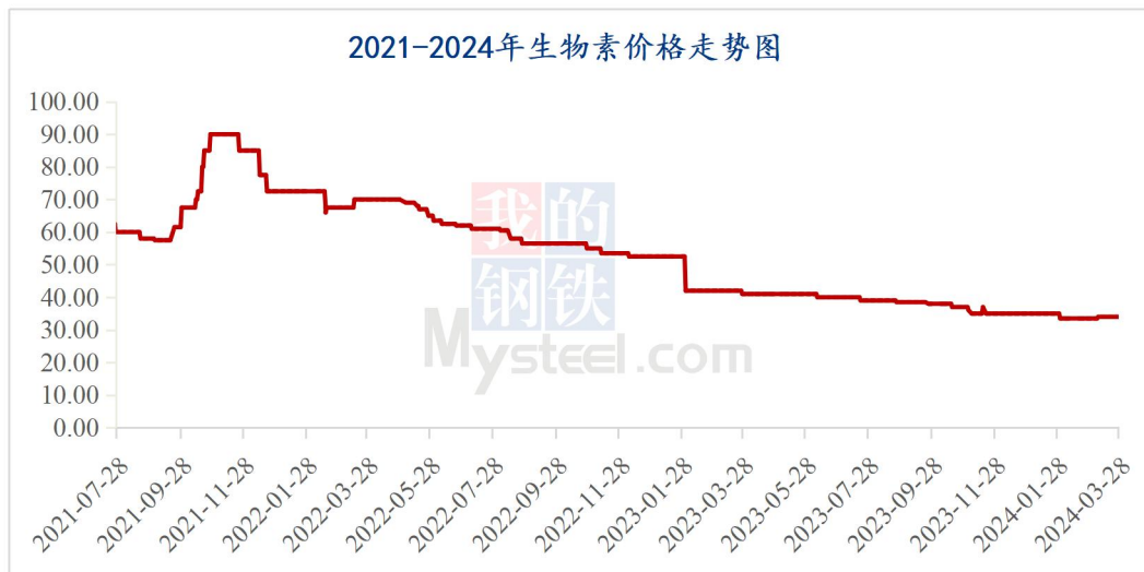
图 12 2021-2024 年生物素价格走势

本周国内 2%生物素市场价格在 33-35 元/kg，价格偏稳运行，市场询单一般，交投价格偏弱，部分价格略低。