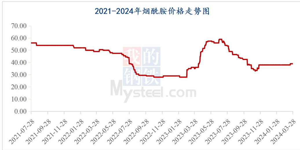
图 13 2021-2024 年烟酰胺价格走势图

本周国内市场主流报价 38-40 元/kg，厂家停止报价，市场价格偏稳运行，市场询单一般，交投价格偏强。