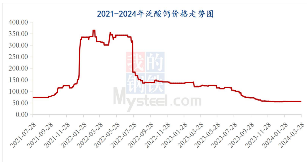
图 5 2021-2024 年泛酸钙价格走势走势图

本周国内泛酸钙市场主流价格在 54-58 元/kg，下游需求一般，部分厂家停止报价，市场价格平稳运行。