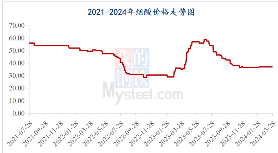
图 15 2021-2024 年烟酸价格走势图

本周国内市场主流报价 36-38 元/kg，市场成交较一般，市场询单一般，交投价格平稳偏弱，部分价格略低。