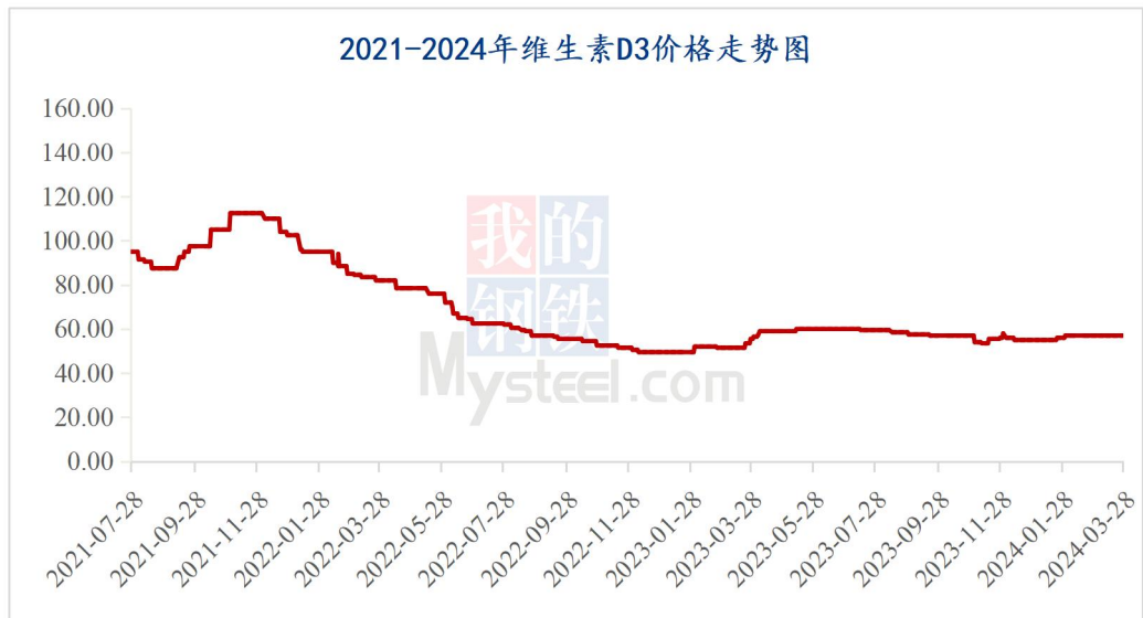
图 4 2021-2024 年维生素 D3 价格走势走势图