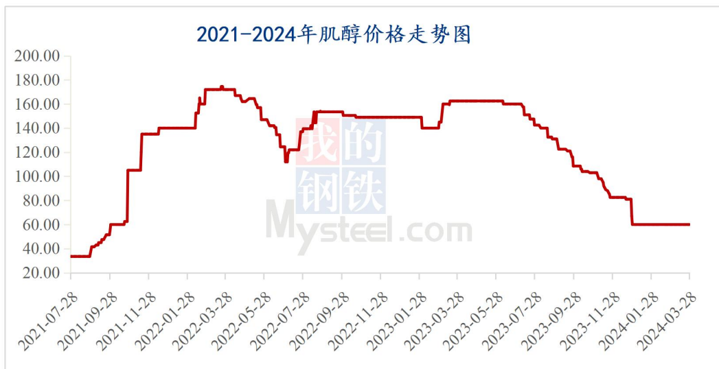
图 14 2021-2024 年肌醇价格走势图

本周国内肌醇市场报价 55-65 元/kg，价格弱稳运行，市场需求较弱，市场供大于需，关注后期市场成交情况。