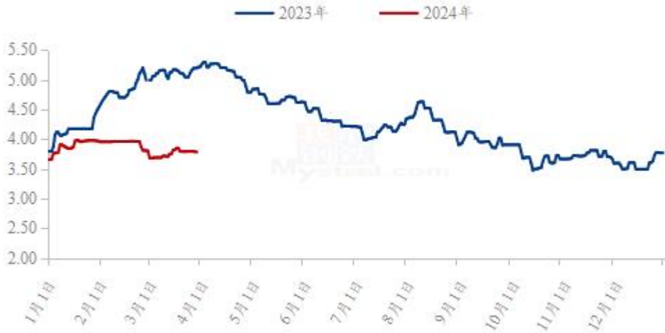
图 19 全国白羽肉鸡均价走势图