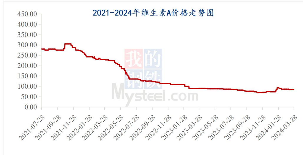
图 1 2021-2024 年维生素 A 价格走势图

据 Mysteel 对全国维生素市场价格调查，本周维生素 VA500 市场价格 82-86 元/kg，国外工厂上调报价，国内市场下游需求一般，观望为主，市场报价偏稳震荡。