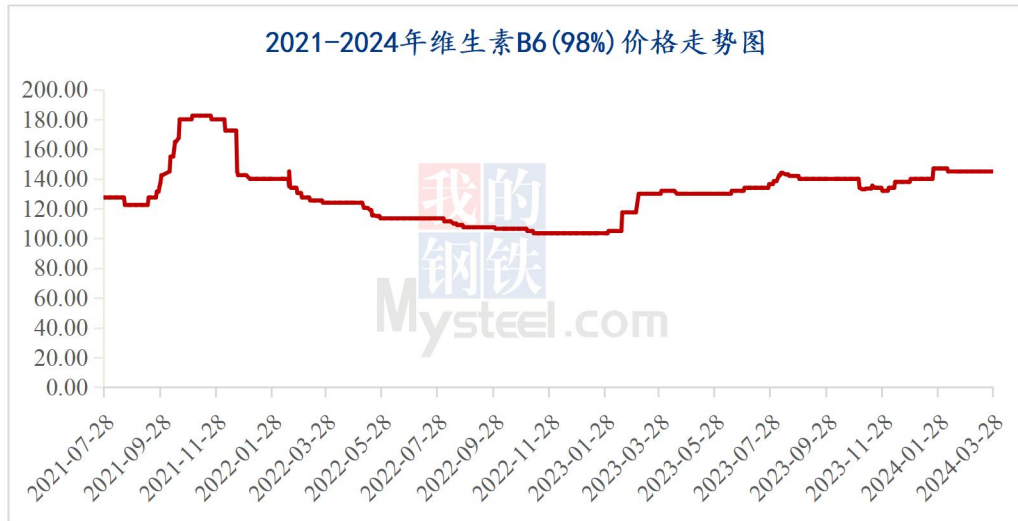
图 8 2021-2024 年维生素 B6 价格走势