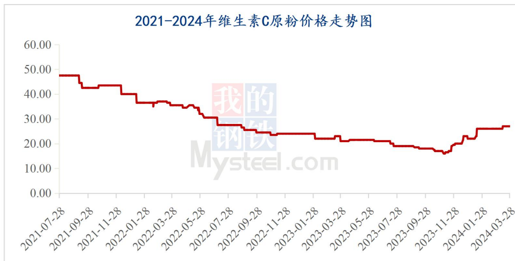
图 3 2021-2024 年维生素 C 价格走势

本周 VC 原粉国内市场报价 26-28 元/kg，市场询单较活跃，涨价情绪强烈，价格偏稳震荡。