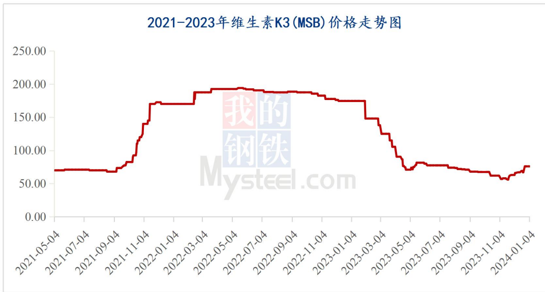
图 10 2021-2023 年维生素 K3 价格走势