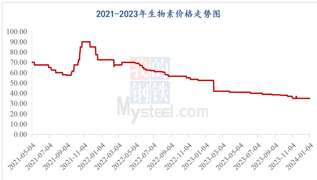
图 12 2021-2023 年生物素价格走势图

本周国内 2%生物素市场价格在 34-36 元/kg，价格偏稳运行，市场询单一般，交投价格偏弱，部分价格略低。