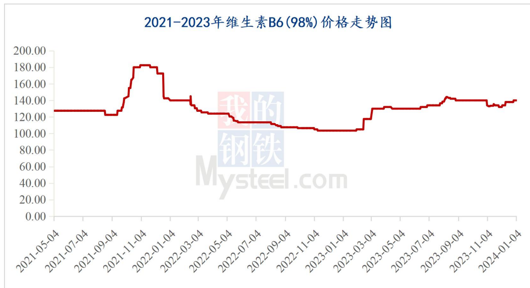
图 8 2021-2023 年维生素 B6 价格走势

本周国内市场主流报价 136-144 元/kg，市场偏稳稍强运行，市场需求较一般。11 月 29 日，天新药业公布饲料级维生素 B6 报价 148 元/kg，出口报价 19 美元/kg。