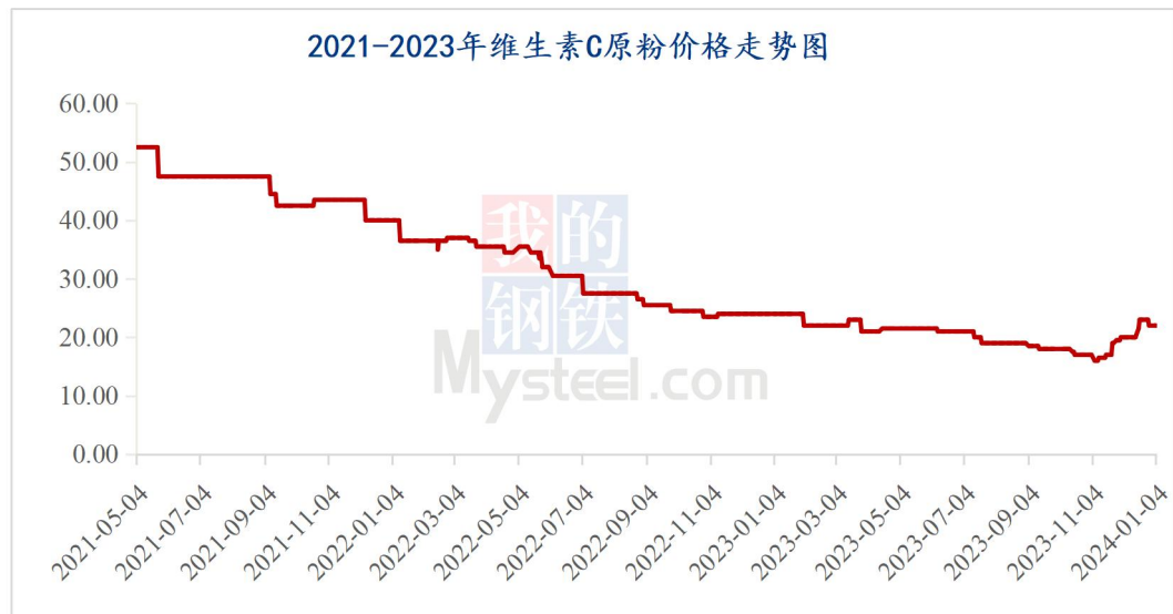
图 3 2021-2023 年维生素 C 价格走势图

本周 VC 原粉国内市场报价 21-23 元/kg，市场价格偏稳运行，部分品牌略低一些，下游需求活跃。