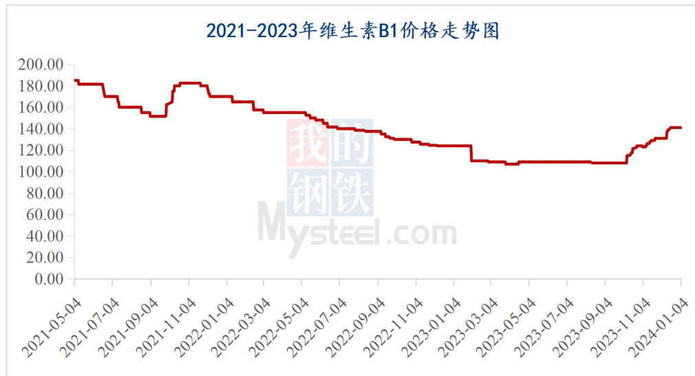
图 6 2021-2023 年维生素 B1 价格走势图

本周国内维生素 B1（80%）市场报价在 138-144 元/kg，下游需求较强，市场询单和寻货积极，市场供货较为紧张，市场成交价格偏稳稍强。