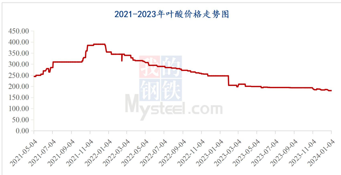
图 11 2021-2023 年叶酸价格走势

本周国内市场主流报价 180-182 元/kg，叶酸目前总体需求不旺，市场成交一般，价格偏弱运行。6月15日，天新药业饲料级叶酸停报停签。