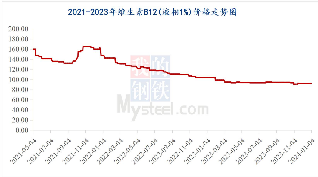
图 9 2021-2023 年维生素 B12 价格走势图

本周国内市场主流报价 90-94 元/kg，工厂上调报价，市场整体价格基本平稳，市场需求一般，价格偏稳运行。