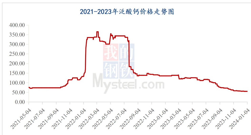
图 5 2021-2023 年泛酸钙价格走势图

本周国内泛酸钙市场主流价格在 54-56 元/kg，上游工厂报价暂稳，下游需求一般，市场价格偏弱运行，实单议价。