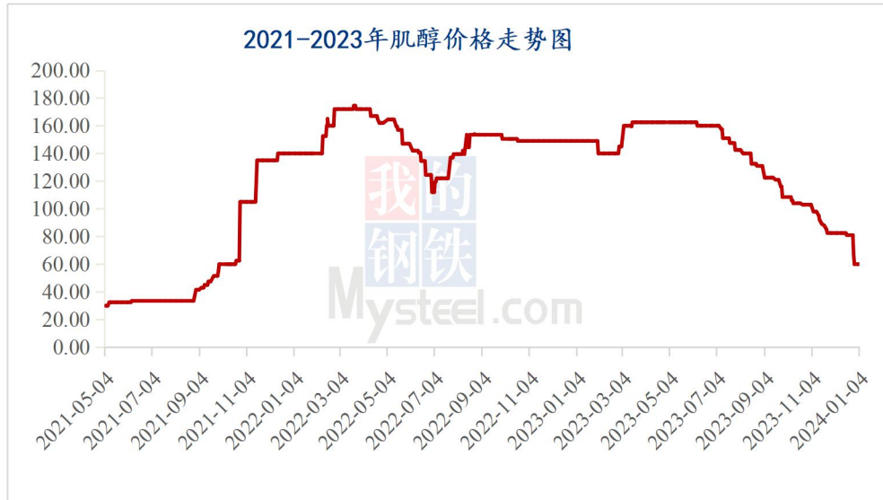
图 14 2021-2023 年肌醇价格走势图

本周国内肌醇市场报价 55-65 元/kg，价格偏弱下调，市场需求较弱，市场供大于需，后期需关注工厂生产和发货情况。