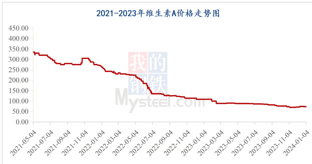
图 1 2023 年维生素 A 价格走势图

据 Mysteel 对全国维生素市场价格调查，本周维生素 VA500 市场价格 72-74 元/kg，采购需求一般，市场报价偏稳运行。