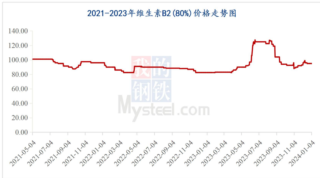
图 7 2021-2023 年维生素 B2 (80%) 价格走势