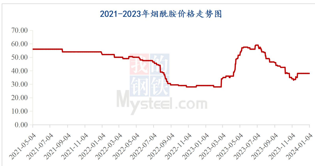
图 13 2021-2023 年烟酰胺价格走势图

本周国内市场主流报价 36-40 元/kg，市场价格偏稳运行，市场询单一般，交投价格平稳，部分价格略低。