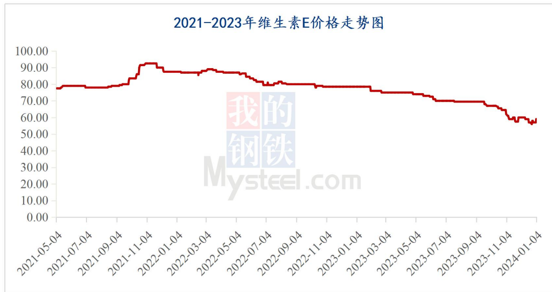
图 2 2021-2023 年维生素 E 价格走势图