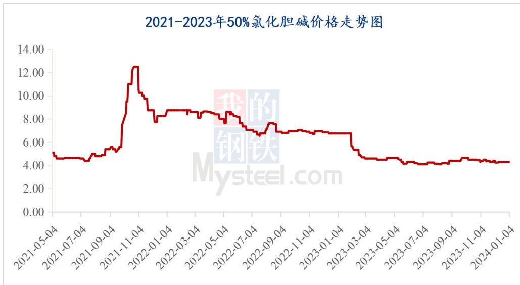
图 16 2021-2023 年氯化胆碱价格走势

本周国内氯化胆碱市场价格 4.2-4.4 元/kg。胆碱，受原料三甲胺价格小幅波动，胆碱工厂报价动态调整，后续主要关注其原料端三甲胺及环氧乙烷变化情况。7 月 12 日，受上游原料价格上涨影响，山东丰银饲料级 50%氯化胆碱价格上调至 4.1 元/kg，60%氯化胆碱价格上调至 4.6 元/kg。7 月 13 日，受原料价格上涨影响，辽宁中信生物上调 50%氯化胆碱报价为 4.4 元/kg。