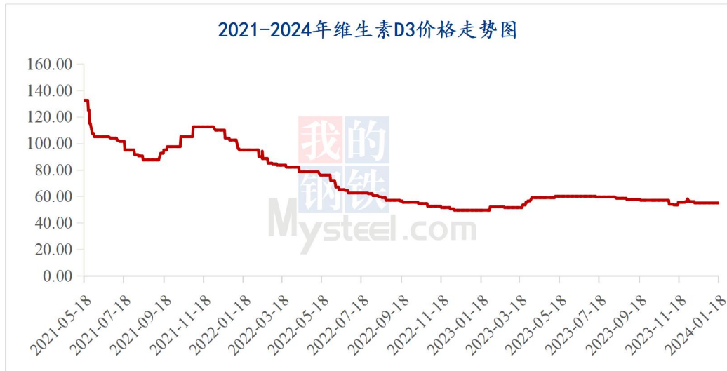
图 4 2021-2024 年维生素 D3 价格走势

本周国内维生素 D3 市场主流价格为 53-57 元/kg，上游工厂停报停签，市场需求较活跃，市场涨价情绪浓郁。