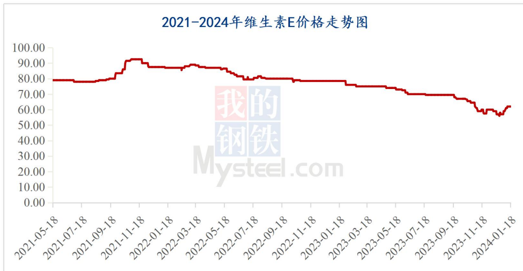
图 2 2021-2024 年维生素 E 价格走势图