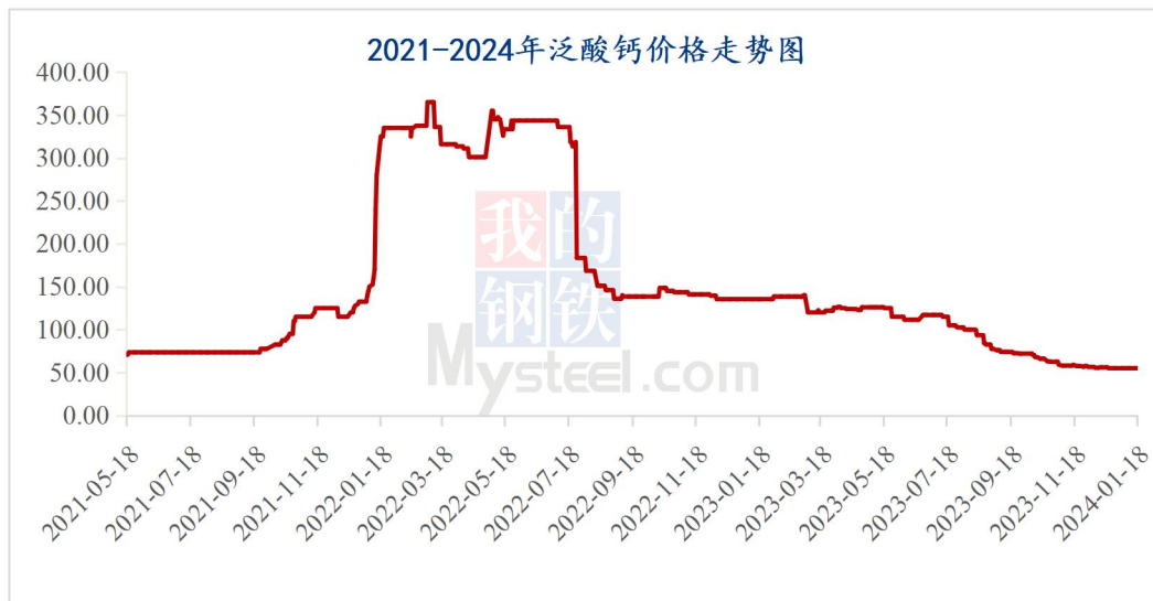
图 5 2021-2024 年泛酸钙价格走势

本周国内泛酸钙市场主流价格在 54-56 元/kg，上游工厂上调报价，下游需求提升，市场低价货源减少，市场涨价意愿强烈。