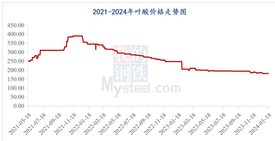
图 11 2021-2024 年叶酸价格走势图

本周国内市场主流报价 180-182 元/kg，叶酸目前总体需求有所提振，市场实际成交一般，价格偏稳运行，涨价情绪强烈。6月15日，天新药业饲料级叶酸停报停签。