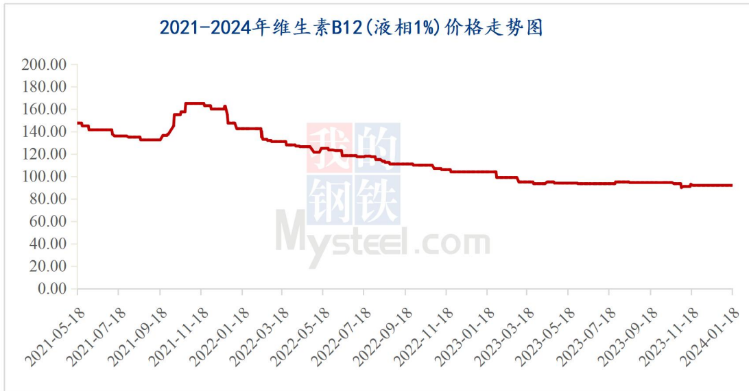
图 9 2021-2024 年维生素 B12 价格走势图

本周国内市场主流报价 90-94 元/kg，工厂上调报价，市场整体价格基本平稳，市场需求一般，价格偏稳运行。