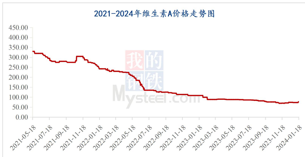
图 1 2021-2024 年维生素 A 价格走势图

据 Mysteel 对全国维生素市场价格调查，本周维生素 VA500 市场价格 76-78 元/kg，工厂停报停签，下游采购需求活跃，市场报价偏强运行。