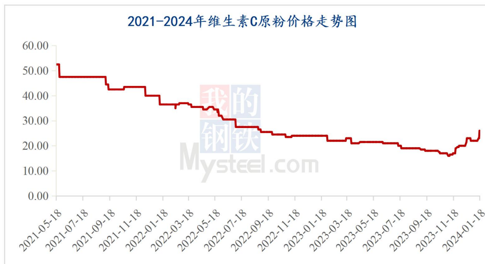
图 3 2021-2024 年维生素 C 价格走势图

本周 VC 原粉国内市场报价 25-27 元/kg，市场价格偏强运行，低价货源减少，下游需求活跃。