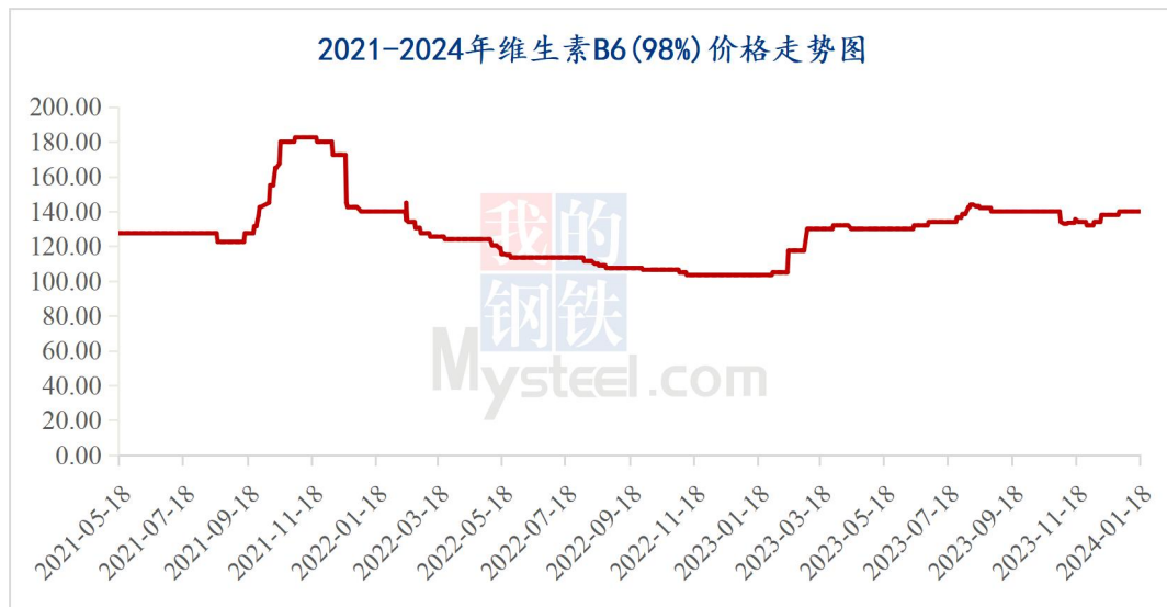
图 8 2021-2024 年维生素 B6 价格走势图

本周国内市场主流报价 136-144 元/kg，市场偏稳运行，市场需求较一般。11 月 29 日，天新药业公布饲料级维生素 B6 报价 148 元/kg，出口报价 19 美元/kg。