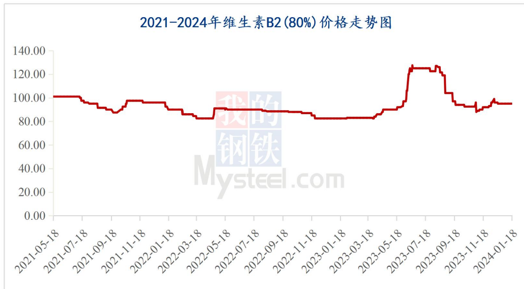
图 7 2021-2024 年维生素 B2 (80%) 价格走势图