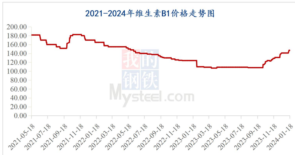
图 6 2021-2024 年维生素 B1 价格走势图

本周国内维生素 B1（80%）市场报价在 144-150 元/kg，下游需求较强，市场询单和寻货积极，市场供货较为紧张，市场成交价格偏稳稍强。