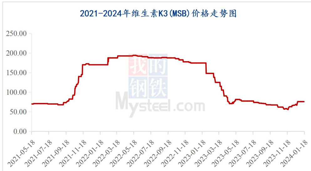
图 10 2021-2024 年维生素 K3 价格走势图