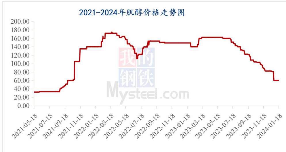
图 14 2021-2024 年肌醇价格走势图

本周国内肌醇市场报价 55-65 元/kg，价格偏弱运行，市场需求较弱，市场供大于需，后期需关注工厂生产和发货情况。