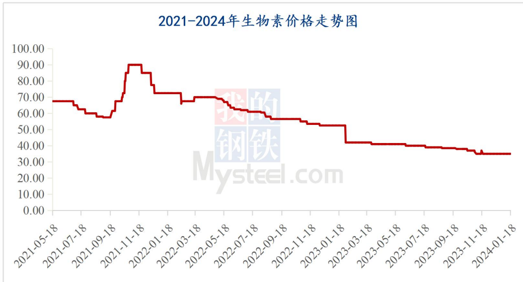
图 12 2021-2024 年生物素价格走势

本周国内 2%生物素市场价格在 34-36 元/kg，价格偏稳运行，市场询单一般，交投价格偏弱，部分价格略低。