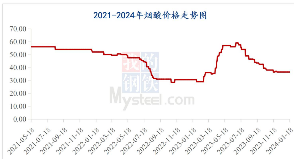
图 15 2021-2024 年烟酸价格走势图

本周国内市场主流报价 36-38 元/kg，市场成交较为平稳，市场询单一般，交投价格平稳偏弱，部分价格略低。