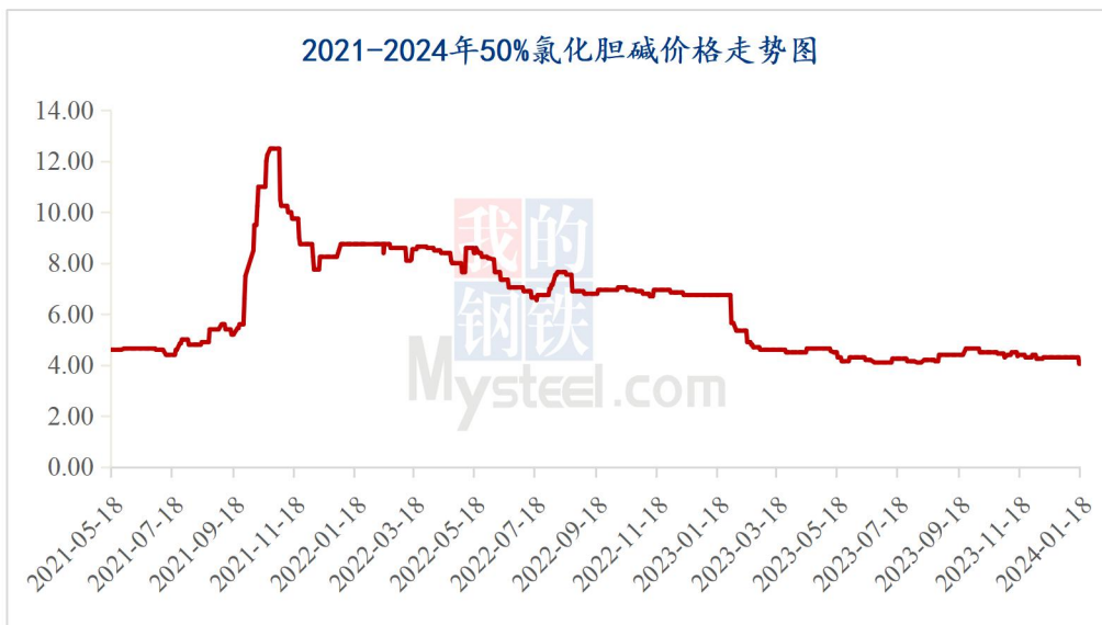
图 16 2021-2024 年氯化胆碱价格走势

本周国内氯化胆碱市场价格 3.9-4.2 元/kg。胆碱，受原料三甲胺价格小幅波动，胆碱工厂报价动态调整，后续主要关注其原料端三甲胺及环氧乙烷变化情况。7 月 12 日，受上游原料价格上涨影响，山东丰银饲料级 50%氯化胆碱价格上调至 4.1 元/kg，60%氯化胆碱价格上调至 4.6 元/kg。7 月 13 日，受原料价格上涨影响，辽宁中信生物上调 50%氯化胆碱报价为 4.4 元/kg。