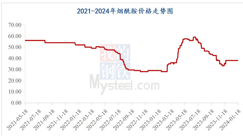
图 13 2021-2024 年烟酰胺价格走势

本周国内市场主流报价 36-40 元/kg，市场价格偏稳运行，市场询单一般，交投价格平稳，部分价格略低。