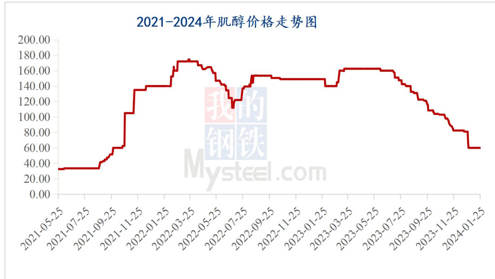
图 14 2021-2024 年肌醇价格走势

本周国内肌醇市场报价 55-65 元/kg，价格偏弱运行，市场需求较弱，市场供大于需，后期需关注工厂生产和发货情况。