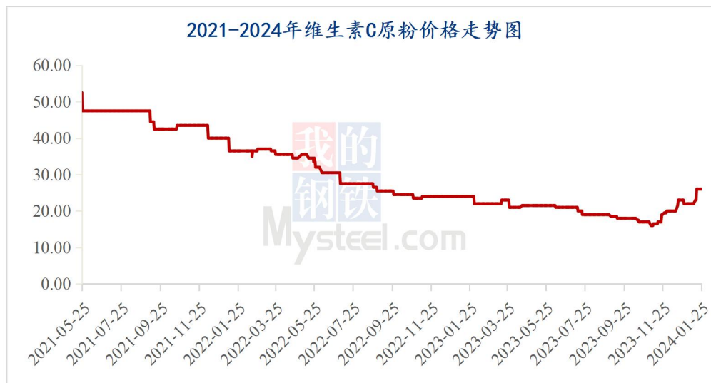
图 3 2021-2024 年维生素 C 价格走势图

本周 VC 原粉国内市场报价 25-27 元/kg，市场价格偏稳运行，低价货源减少，下游需求活跃。