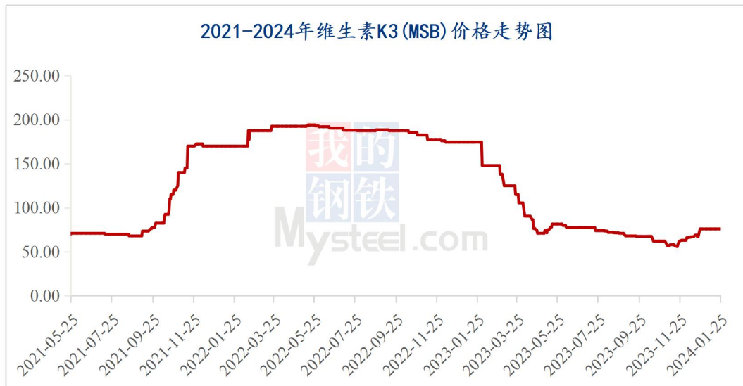
图 10 2021-2024 年维生素 K3 价格走势图