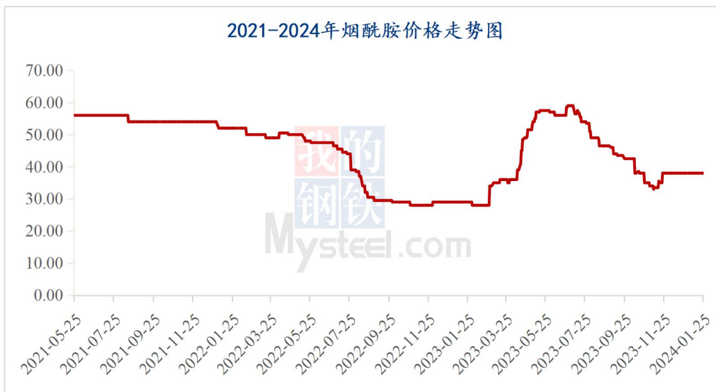
图 13 2021-2024 年烟酰胺价格走势图

本周国内市场主流报价 36-40 元/kg，市场价格偏稳运行，市场询单一般，交投价格平稳，部分价格略低。