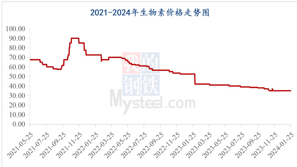
图 12 2021-2024 年生物素价格走势图

本周国内 2%生物素市场价格在 34-36 元/kg，价格偏稳运行，市场询单一般，交投价格偏弱，部分价格略低。