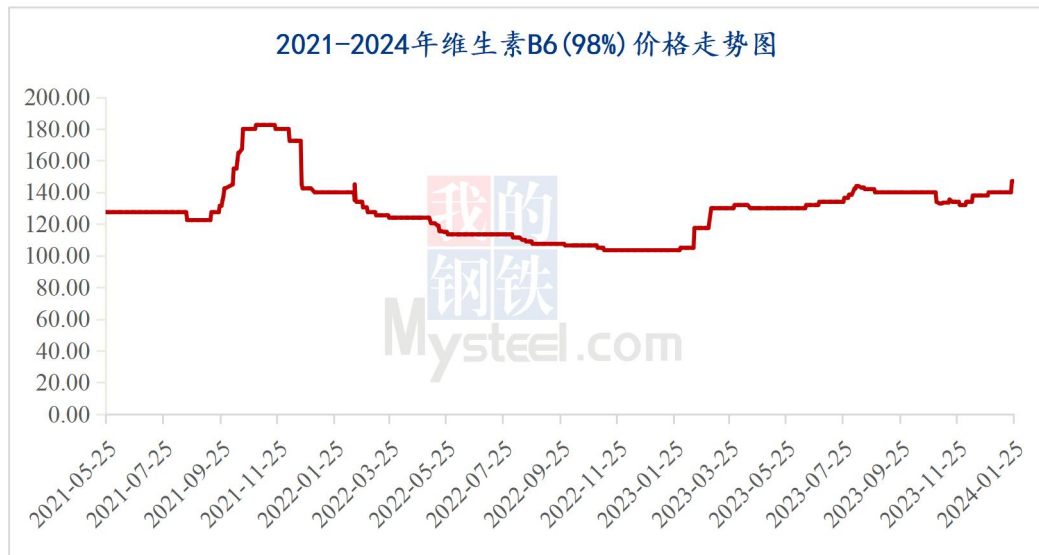
图 8 2021-2024 年维生素 B6 价格走势

本周国内市场主流报价 144-150 元/kg，市场偏强运行，市场需求较一般。11 月 29 日，天新药业公布饲料级维生素 B6 报价 148 元/kg，出口报价 19 美元/kg。