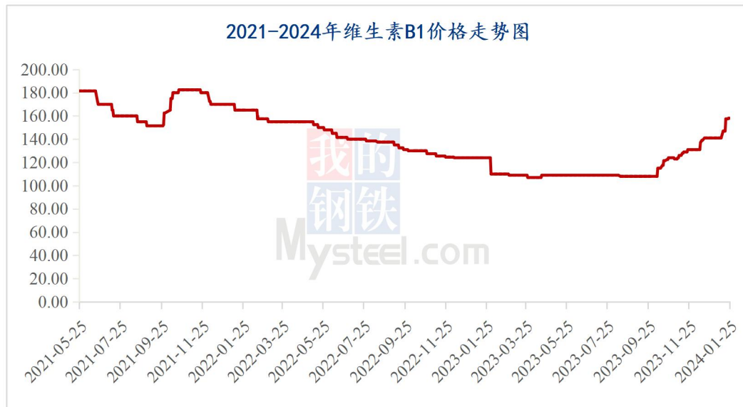
图 6 2021-2024 年维生素 B1 价格走势图

本周国内维生素 B1（80%）市场报价在 156-160 元/kg，下游需求较强，市场询单和寻货积极，市场供货较为紧张，市场成交价格偏强上调。