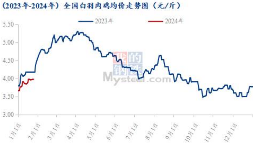
图 19 全国白羽肉鸡均价走势图