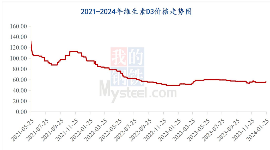
图 4 2021-2024 年维生素 D3 价格走势图

本周国内维生素 D3 市场主流价格为 54-58 元/kg，上游工厂停报停签，市场需求较活跃，市场涨价情绪浓郁。