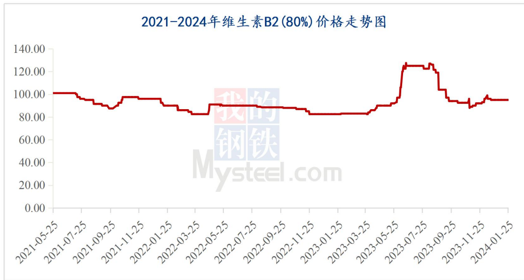
图 7 2021-2024 年维生素 B2 (80%) 价格走势