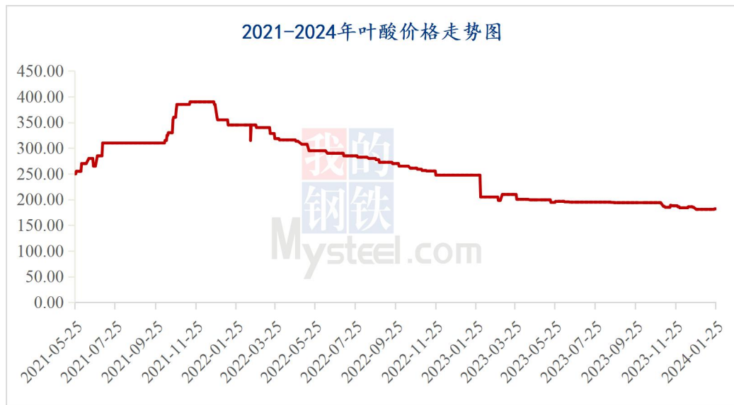
图 11 2021-2024 年叶酸价格走势图

本周国内市场主流报价 179-185 元/kg，叶酸目前总体需求有所提振，市场实际成交一般，价格偏稳稍强运行，涨价情绪强烈。6月15日，天新药业饲料级叶酸停报停签。