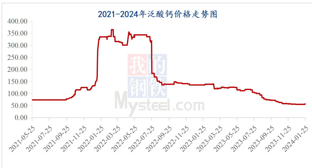
图 5 2021-2024 年泛酸钙价格走势图

本周国内泛酸钙市场主流价格在 55-58 元/kg，上游工厂上调报价，下游需求提升，市场低价货源减少，市场涨价意愿强烈。