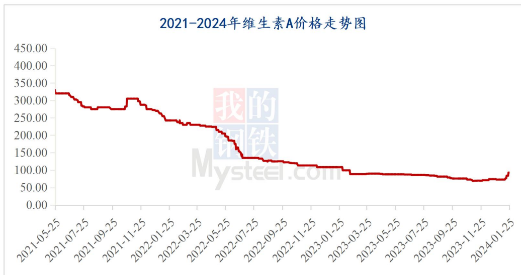
图 1 2021-2024 年维生素 A 价格走势图

据 Mysteel 对全国维生素市场价格调查，本周维生素 VA500 市场价格 90-96 元/kg，工厂停报停签，下游采购需求活跃，市场报价偏强上调。