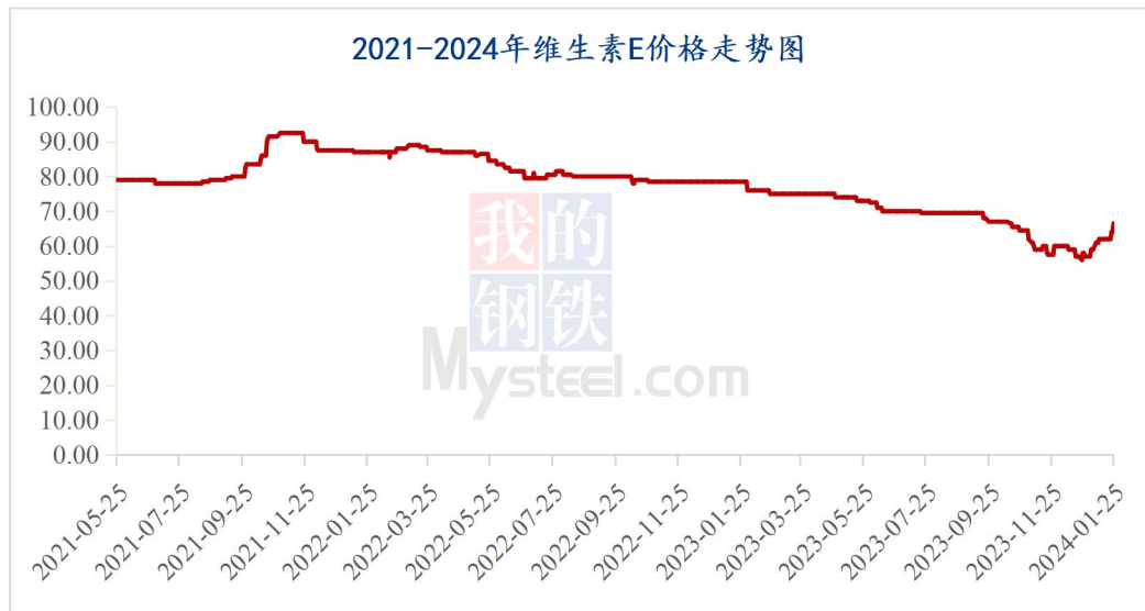
图 2 2021-2024 年维生素 E 价格走势图