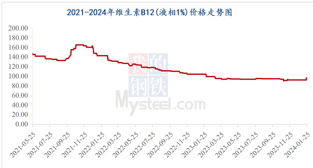
图 9 2021-2024 年维生素 B12 价格走势

本周国内市场主流报价 94-98 元/kg，工厂上调报价，市场整体价格小幅上调，市场需求一般，价格偏强运行。