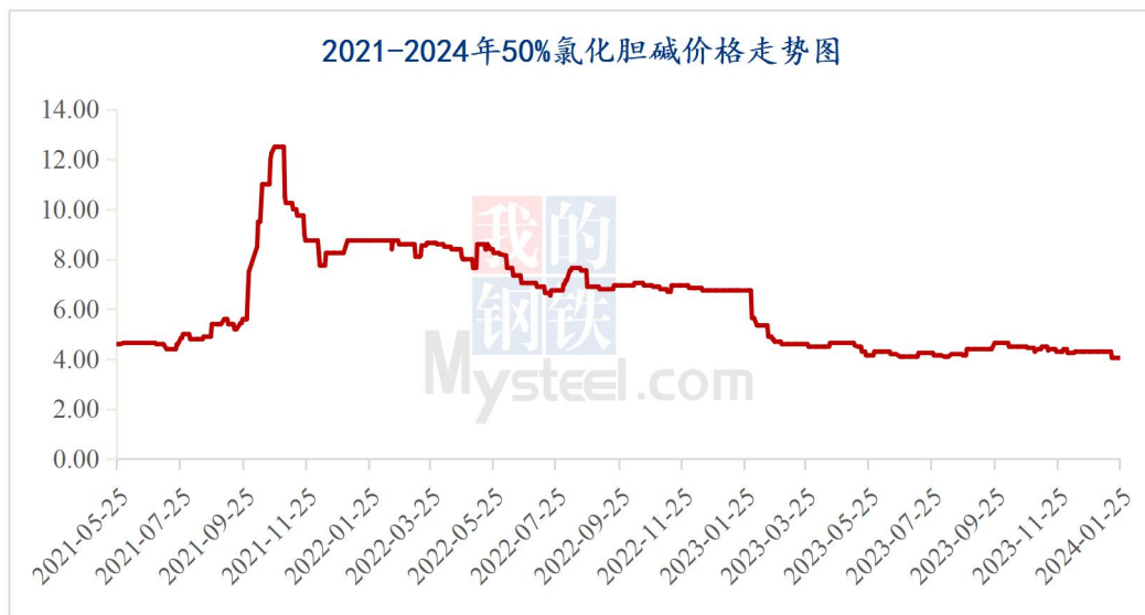
图 16 2021-2024 年氯化胆碱价格走势图

本周国内氯化胆碱市场价格 3.9-4.2 元/kg。胆碱，受原料三甲胺价格小幅波动，胆碱工厂报价动态调整，后续主要关注其原料端三甲胺及环氧乙烷变化情况。7 月 12 日，受上游原料价格上涨影响，山东丰银饲料级 50%氯化胆碱价格上调至 4.1 元/kg，60%氯化胆碱价格上调至 4.6 元/kg。7 月 13 日，受原料价格上涨影响，辽宁中信生物上调 50%氯化胆碱报价为 4.4 元/kg。