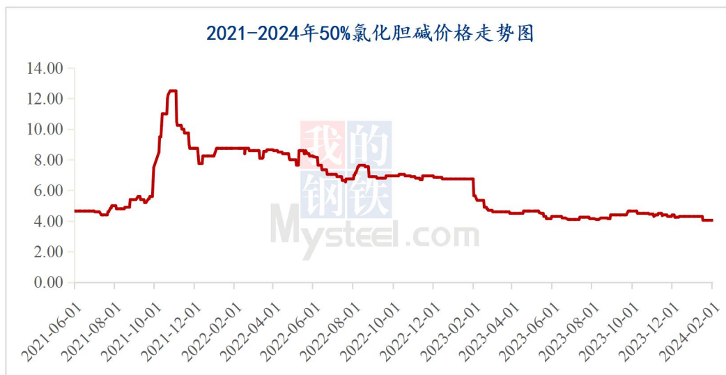
图 16 2021-2024 年氯化胆碱价格走势图

本周国内氯化胆碱市场价格 3.9-4.2 元/kg。胆碱，受原料三甲胺价格小幅波动，胆碱工厂报价动态调整，后续主要关注其原料端三甲胺及环氧乙烷变化情况。7月12日，受上游原料价格上涨影响，山东丰银饲料级 50%氯化胆碱价格上调至 4.1 元/kg，60%氯化胆碱价格上调至 4.6 元/kg。7月13日，受原料价格上涨影响，辽宁中信生物上调 50%氯化胆碱报价为 4.4 元/kg。