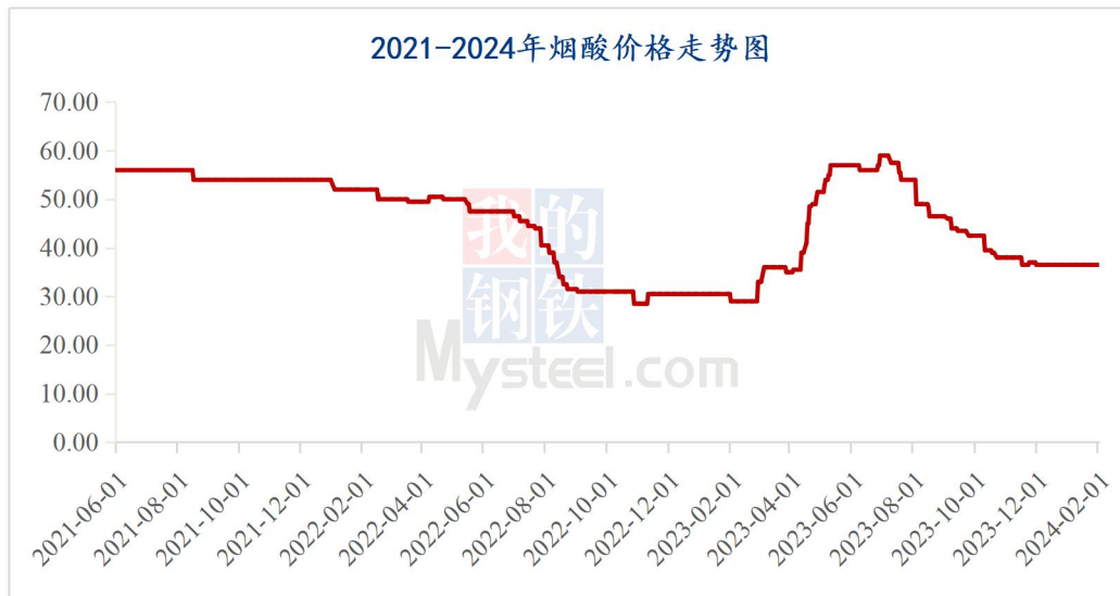
图 15 2021-2024 年烟酸价格走势图