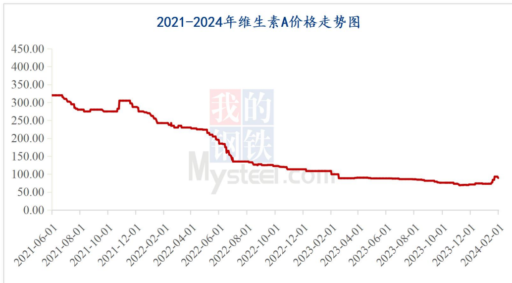
图 1 2021-2024 年维生素 A 价格走势图

据 Mysteel 对全国维生素市场价格调查，本周维生素 VA500 市场价格 84-95 元/kg，工厂停报停签，下游需求一般，市场报价偏稳震荡。