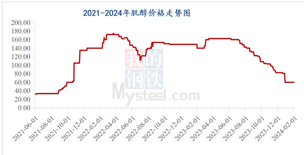
图 14 2021-2024 年肌醇价格走势

本周国内肌醇市场报价 55-65 元/kg，价格偏弱运行，市场需求较弱，市场供大于需，后期需关注工厂生产和发货情况。