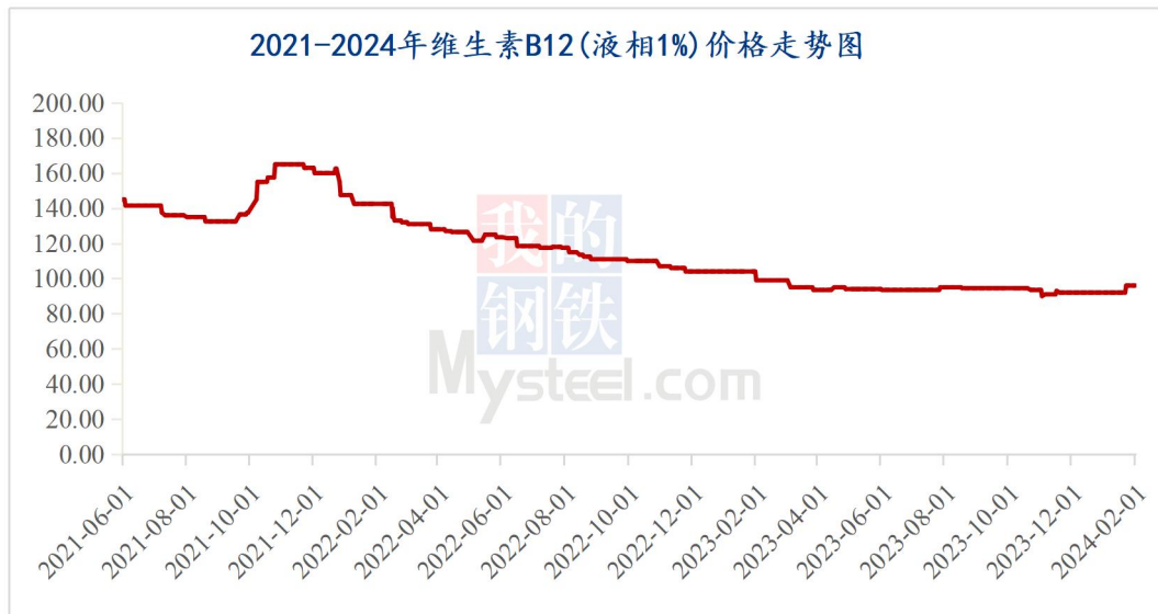
图 9 2021-2024 年维生素 B12 价格走势

本周国内市场主流报价 94-98 元/kg，工厂上调报价，市场整体价格偏稳运行，市场需求一般。