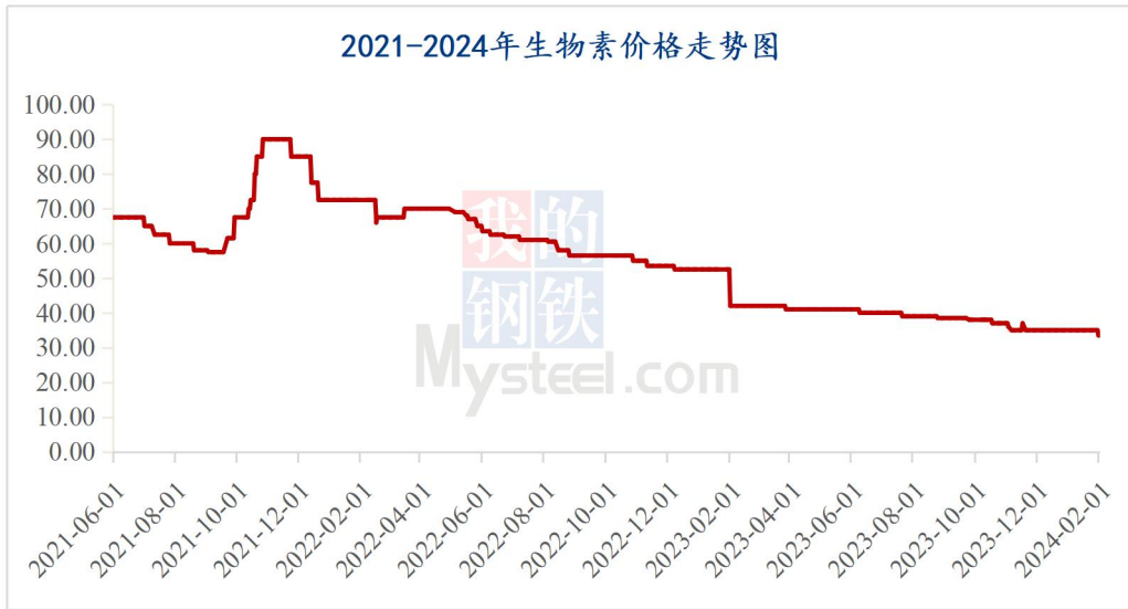
图 12 2021-2024 年生物素价格走势图

本周国内 2%生物素市场价格在 32-35 元/kg，价格偏稳运行，市场询单一般，交投价格偏弱，部分价格略低。