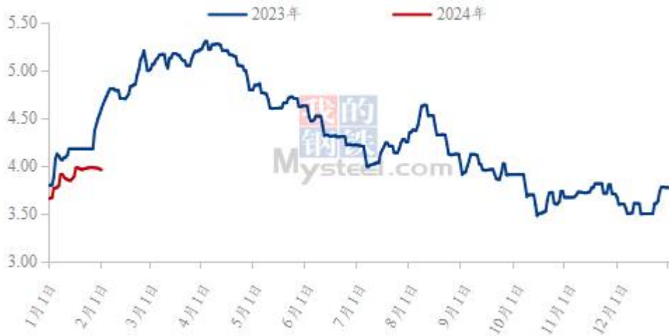
图 19 全国白羽肉鸡均价走势图