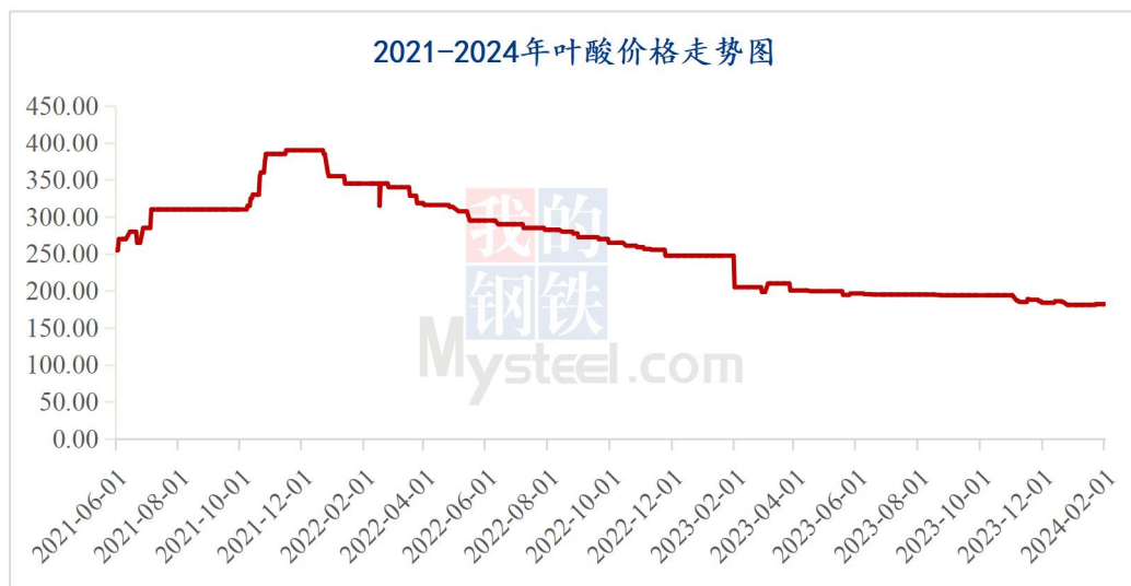
图 11 2021-2024 年叶酸价格走势图

本周国内市场主流报价 179-185 元/kg，叶酸目前总体需求有所提振，市场实际成交一般，价格偏稳稍强运行，涨价情绪强烈。6月15日，天新药业饲料级叶酸停报停签。