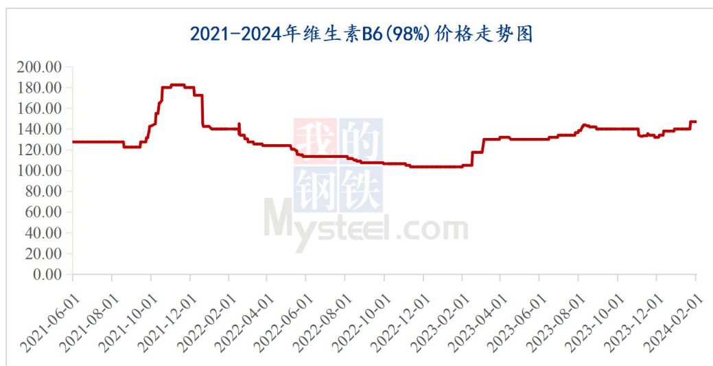
图 8 2021-2024 年维生素 B6 价格走势

本周国内市场主流报价 144-150 元/kg，市场偏强运行，市场需求较一般。11 月 29 日，天新药业公布饲料级维生素 B6 报价 148 元/kg，出口报价 19 美元/kg。