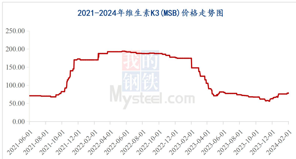
图 10 2021-2024 年维生素 K3 价格走势图