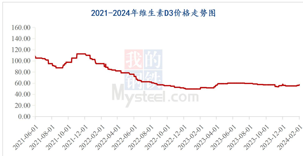
图 4 2021-2024 年维生素 D3 价格走势图

本周国内维生素 D3 市场主流价格为 56-58 元/kg，上游工厂停报停签，市场需求较活跃，市场涨价情绪较强。