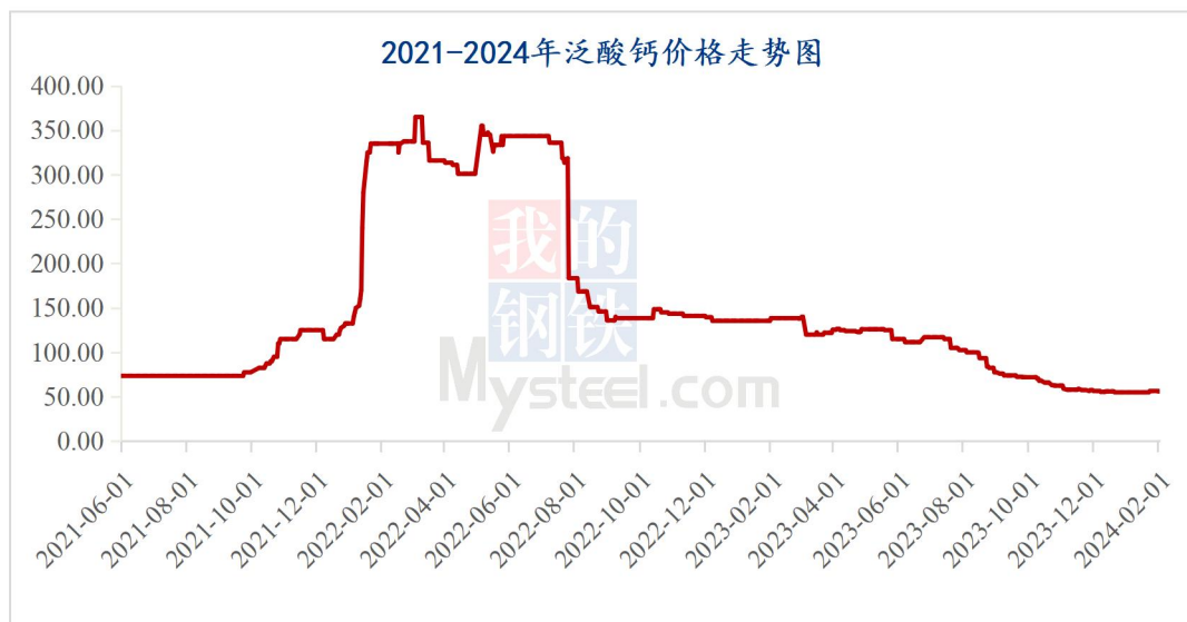
图 5 2021-2024 年泛酸钙价格走势图

本周国内泛酸钙市场主流价格在 54-58 元/kg，下游需求一般，市场低价货源减少，市场价格弱稳运行。