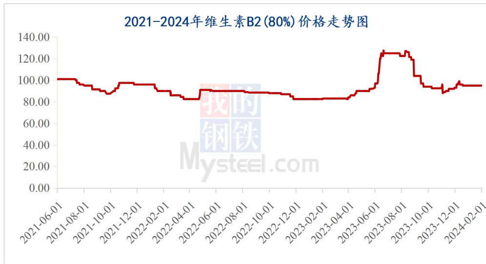
图 7 2021-2024 年维生素 B2 (80%) 价格走势