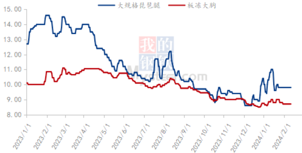
(2023-2024) 年全国大规格琵琶腿、板冻大胸价格走势图 (元/公斤)