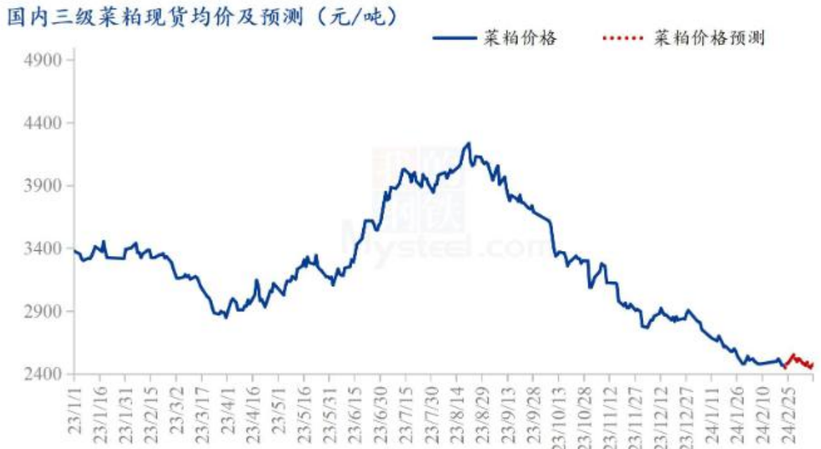
图 8 国内菜粕现货均价及预测