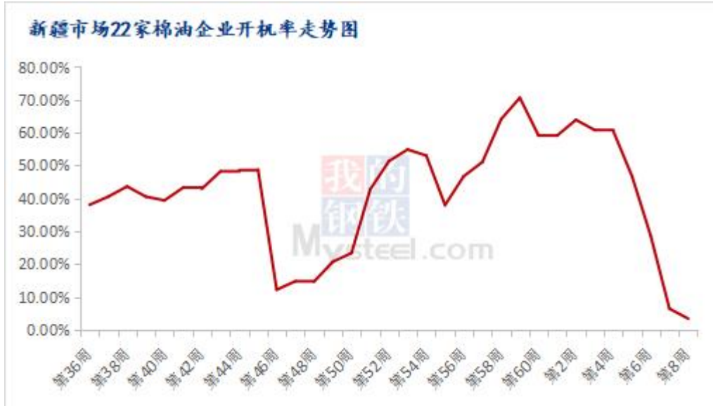
图 2 新疆棉油企业开机率走势图