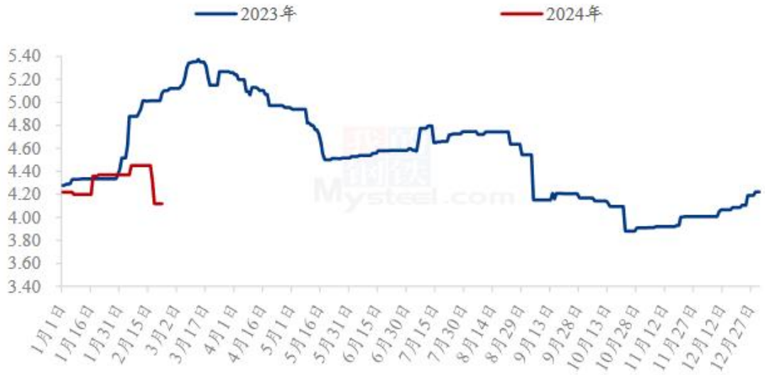
图 4 全国肉鸭均价走势图