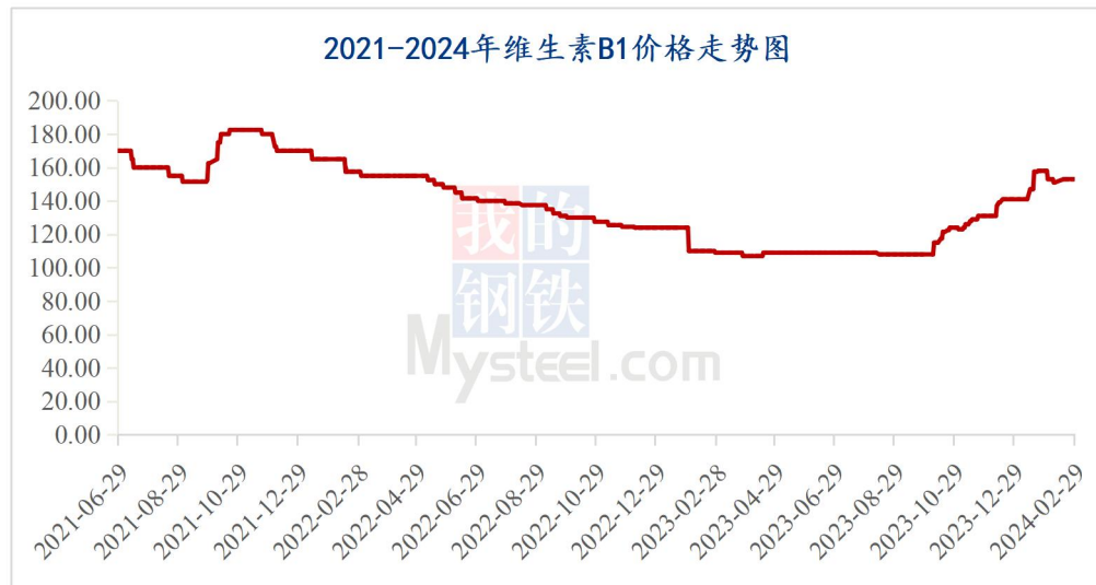
图 6 2021-2024 年维生素 B1 价格走势图

本周国内维生素 B1（80%）市场报价在 150-156 元/kg，下游需求一般，市场询单一般，市场成交价格暂稳。