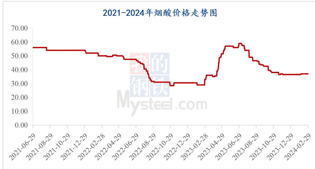
图 15 2021-2024 年烟酸价格走势图

本周国内市场主流报价 36-38 元/kg，市场成交较一般，市场询单一般，交投价格平稳偏弱，部分价格略低。