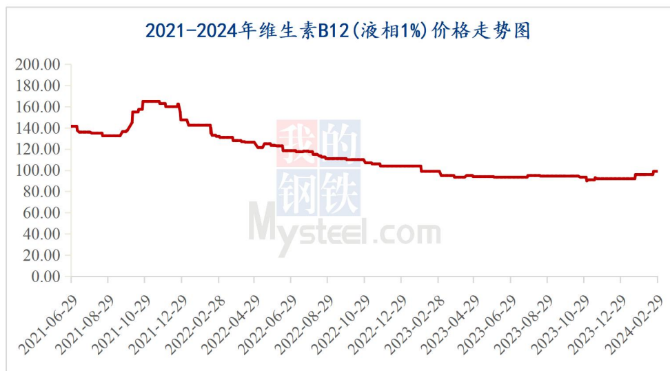
图 9 2021-2024 年维生素 B12 价格走势图

本周国内维生素 B12 市场报价 98-100 元/kg，工厂上调报价，市场整体价格偏稳运行，下游需求一般。