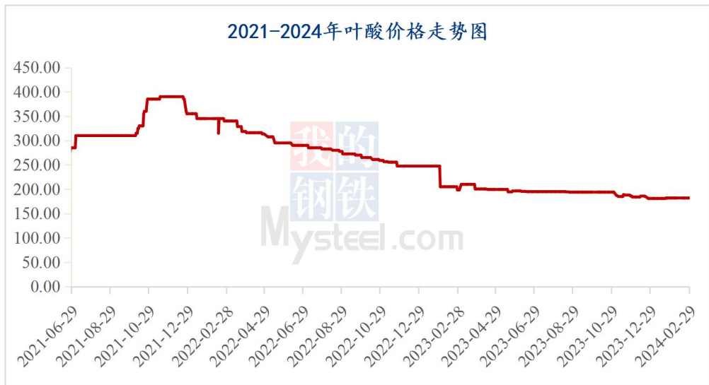
图 11 2021-2024 年叶酸价格走势图