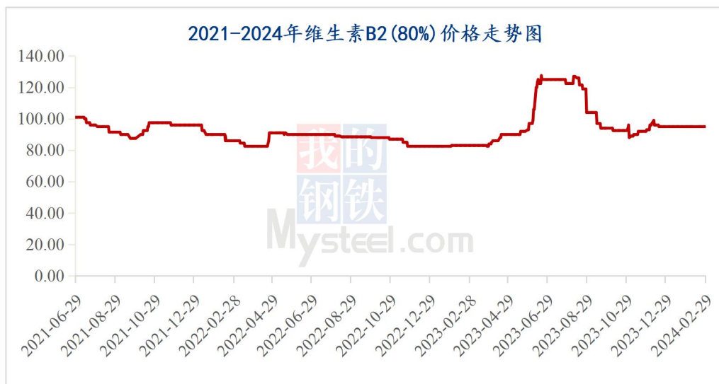
图 7 2021-2024 年维生素 B2（80%）价格走势图

本周国内 VB2(80%)市场价格 90-100 元/kg，VB2(98%)市场价格 280-300 元/kg。厂家恢复报价，市场报价偏稳运行，市场实际需求一般，根据品牌、日期不同，局部价格略低。