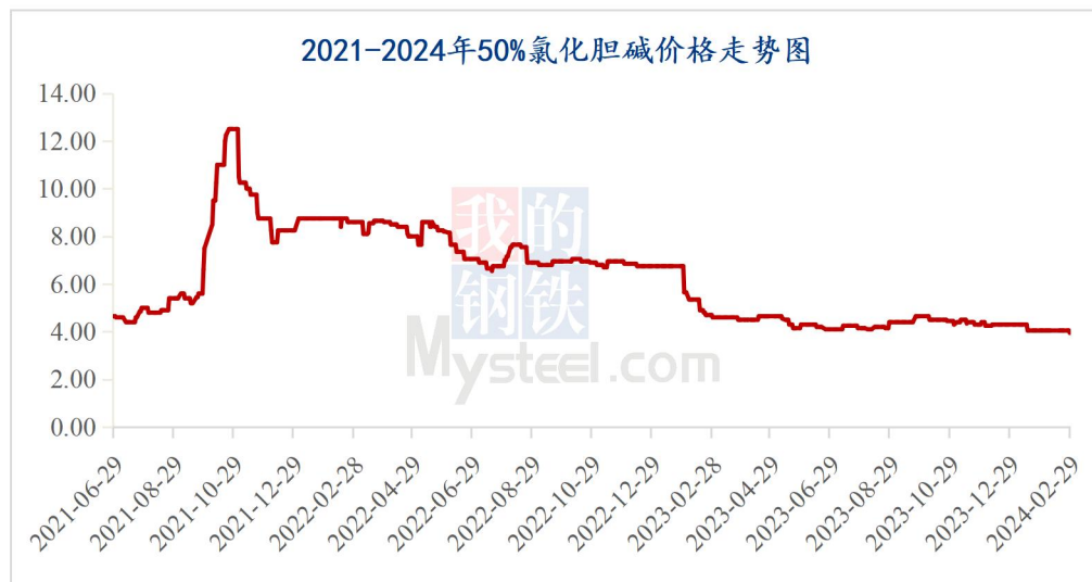
图 16 2021-2024 年氯化胆碱价格走势图

本周国内氯化胆碱市场价格 3.9-4.0 元/kg。胆碱受原料三甲胺价格小幅波动，胆碱工厂报价小幅下调，后续主要关注其原料端三甲胺及环氧乙烷变化情况。