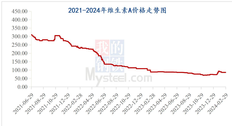
图 1 2021-2024 年维生素 A 价格走势图

据 Mysteel 对全国维生素市场价格调查，本周维生素 VA500 市场价格 84-88 元/kg，工厂停报停签，下游需求一般，市场报价偏稳震荡。