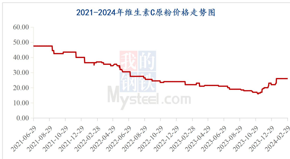
图 3 2021-2024 年维生素 C 价格走势

本周 VC 原粉国内市场报价 25-27 元/kg，厂家停止报价，市场关注度提高，价格偏稳运行，下游需求一般。