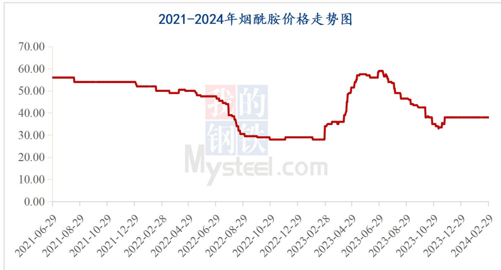
图 13 2021-2024 年烟酰胺价格走势

本周国内市场主流报价 36-40 元/kg，市场价格偏稳运行，市场询单一般，交投价格平稳，部分价格略低。