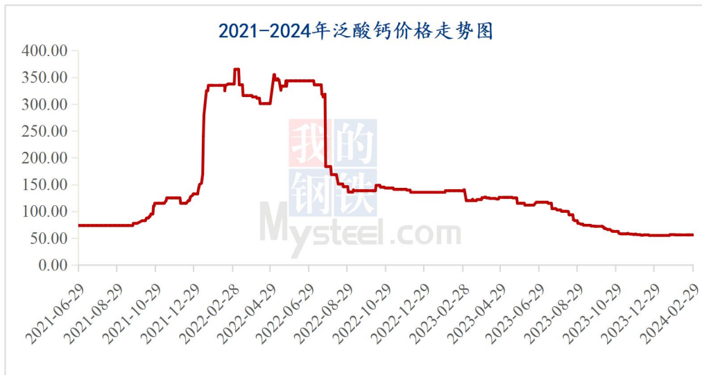
图 5 2021-2024 年泛酸钙价格走势

本周国内泛酸钙市场主流价格在 54-58 元/kg，下游需求一般，市场低价货源减少，市场价格平稳运行。