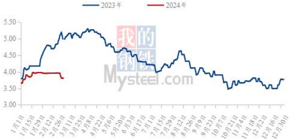
图 19 全国白羽肉鸡均价走势图