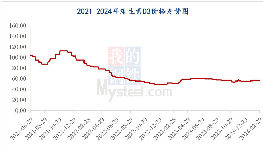
图 4 2021-2024 年维生素 D3 价格走势