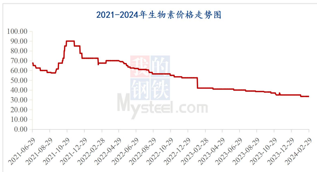
图 12 2021-2024 年生物素价格走势图

本周国内 2%生物素市场价格在 32-35 元/kg，价格偏稳运行，市场询单一般，交投价格偏弱，部分价格略低。