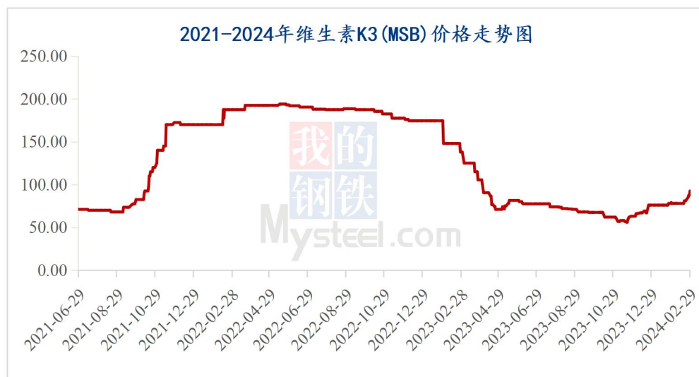
图 10 2021-2024 年维生素 K3 价格走势

本周国内维生素 K3（MSB）市场主流价格在 90-95 元/kg，MNB 市场价格在 100-105 元/kg。下游需求活跃，工厂供货偏紧，市场惜售，厂家持续上调报价，市场价格持续偏强上调。