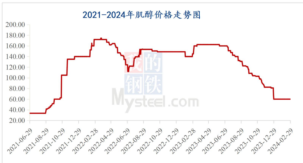
图 14 2021-2024 年肌醇价格走势

本周国内肌醇市场报价 55-65 元/kg，价格弱稳运行，市场需求较弱，市场供大于需，关注后期市场成交情况。