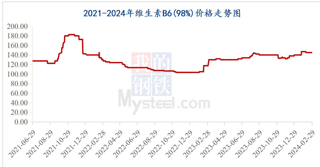
图 8 2021-2024 年维生素 B6 价格走势图