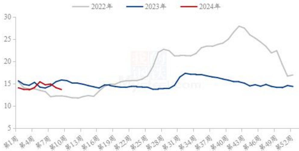
图 4 全国外三元生猪出栏均价走势图