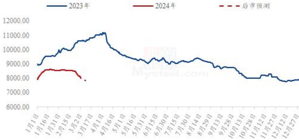
图 6 全国肉鸭均价走势图