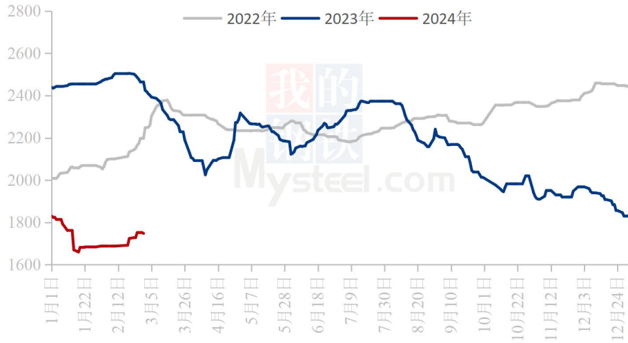
图 1 2022-2024 年全国米糠粕均价走势图