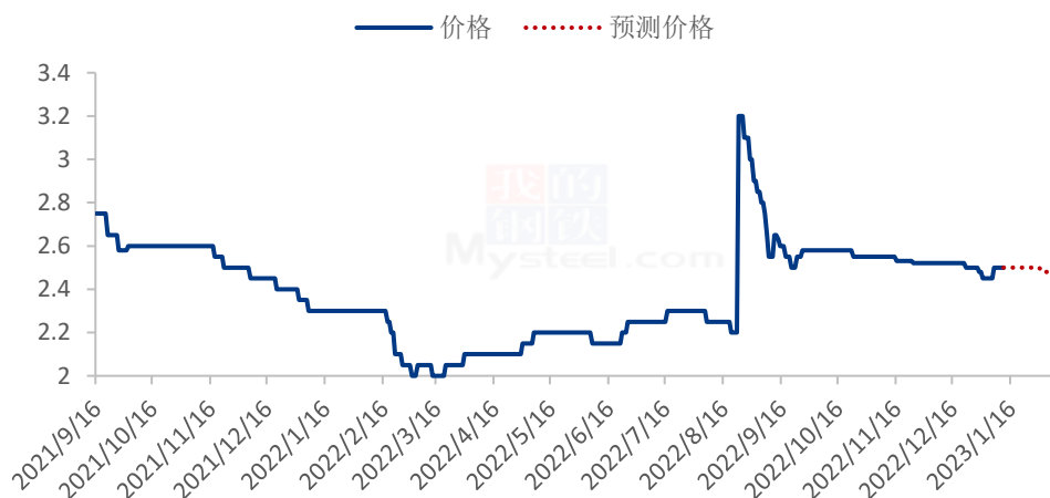
(2021-2022年) 赤峰张杂13号谷子价格走势 (元/斤)

注：新陈粮交接，9月份开始市场流通新粮为主，Mysteel 农产品开始更新新粮报价。