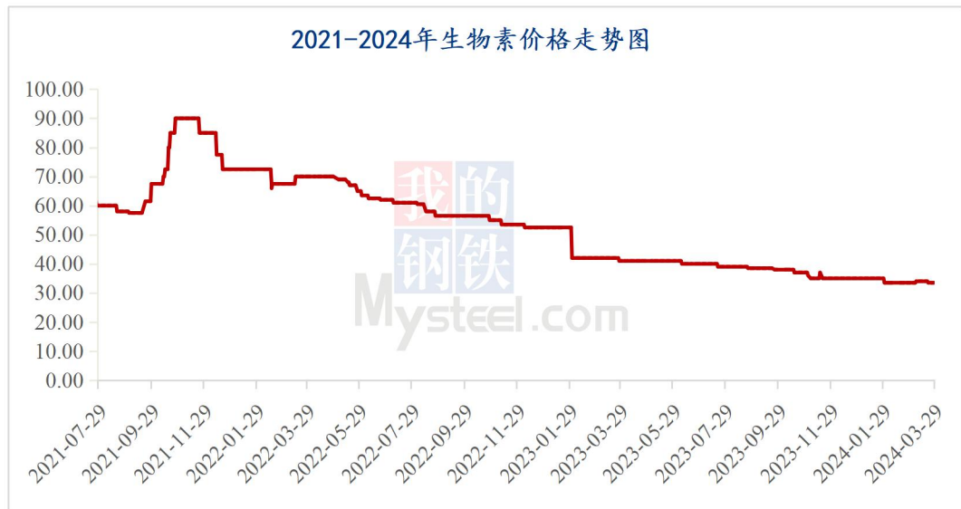
图 12 2021-2024 年生物素价格走势