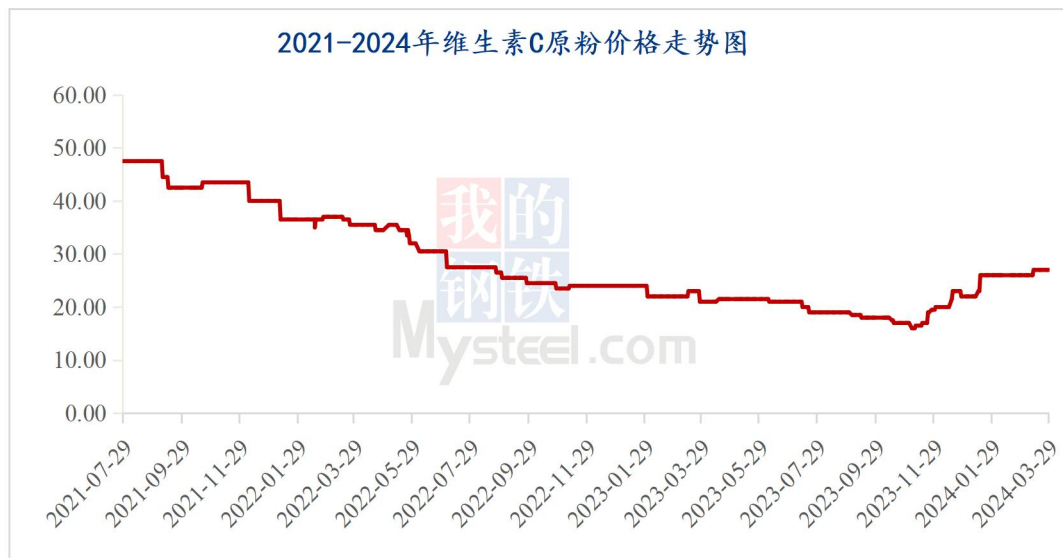
图 3 2021-2024 年维生素 C 价格走势

截至本月 VC 原粉国内市场均价 26 元/kg，下游需求较活跃，市场活跃度提升，价格稳中偏强。