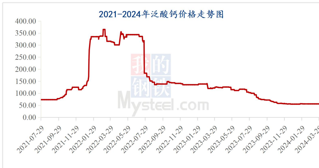
图 5 2021-2024 年泛酸钙价格走势

截至本月国内泛酸钙市场均价为 56 元/kg，下游需求较弱，市场价格弱稳，实单议价为主，欧洲市场主流报价 7.3-7.5 欧元/kg。