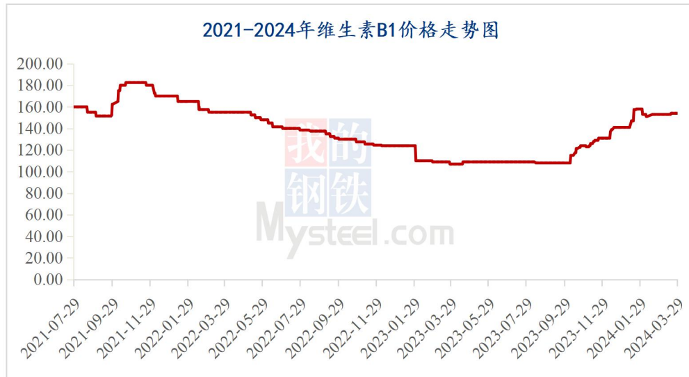
图 6 2021-2024 年维生素 B1 价格走势

截至本月底国内维生素 B1 市场均价在 153.1 元/kg，下游需求较一般，市场供货偏紧，价格偏稳运行。