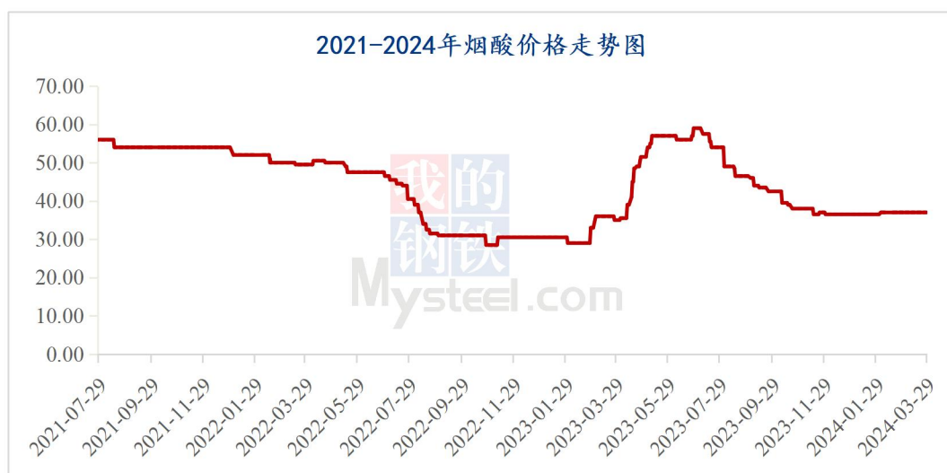
图 15 2021-2024 年烟酸价格走势图

截至本月国内市场均价为 36.94 元/kg，市场持观望态度为主，成交价格偏稳。