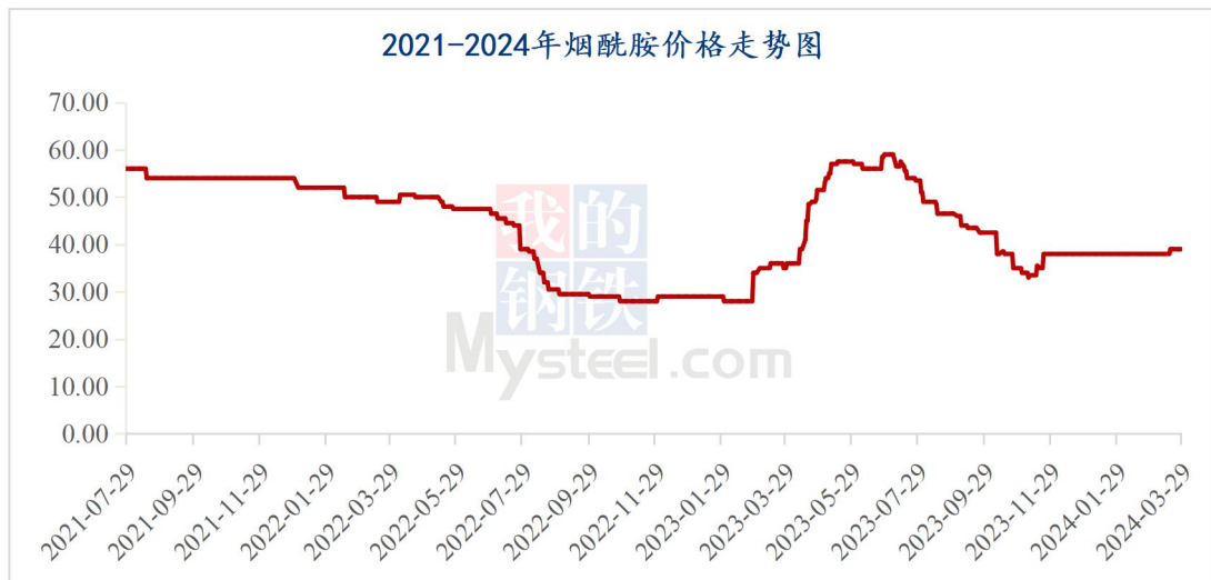
图 13 2021-2024 年烟酰胺价格走势

截至本月国内市场均价 38 元/kg，较上月持平，上游工厂挺价意愿较强，但市场下游补货需求不佳，市场价格弱稳运行。