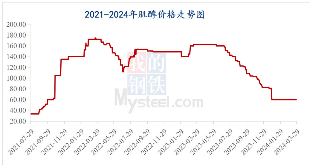
图 14 2021-2024 年肌醇价格走势图

截至本月国内肌醇市场均价为 60 元/kg，较上月均价持平。根据品牌、日期不同，报价宽泛；肌醇需求转弱，价格偏弱。