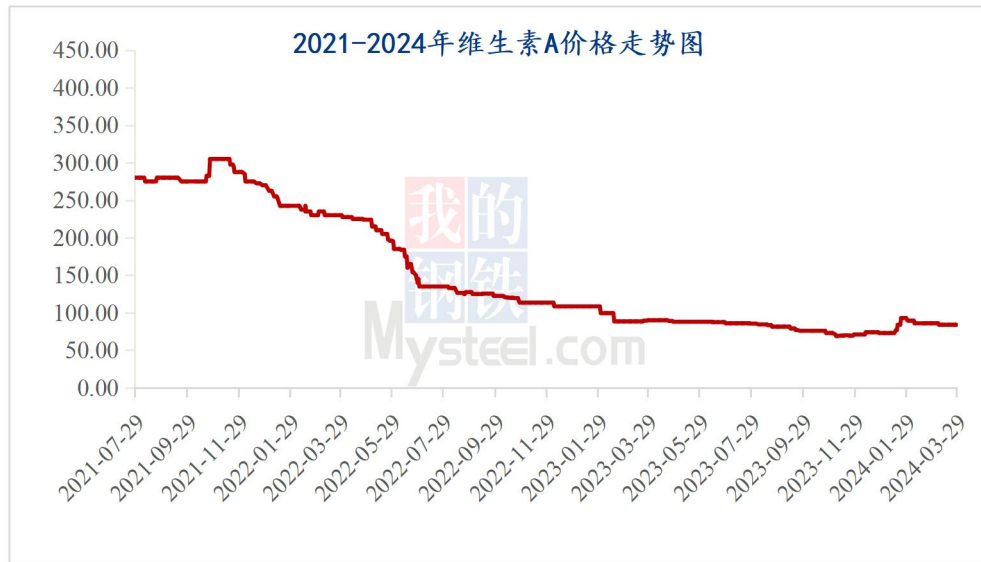
图 1 2021-2024 年维生素 A 价格走势

据 Mysteel 对全国维生素市场价格调查，截至本月维生素 A500 市场国内均价在 84 元/kg，国外工厂上调报价，国内市场下游需求一般，观望为主，市场报价偏稳震荡。