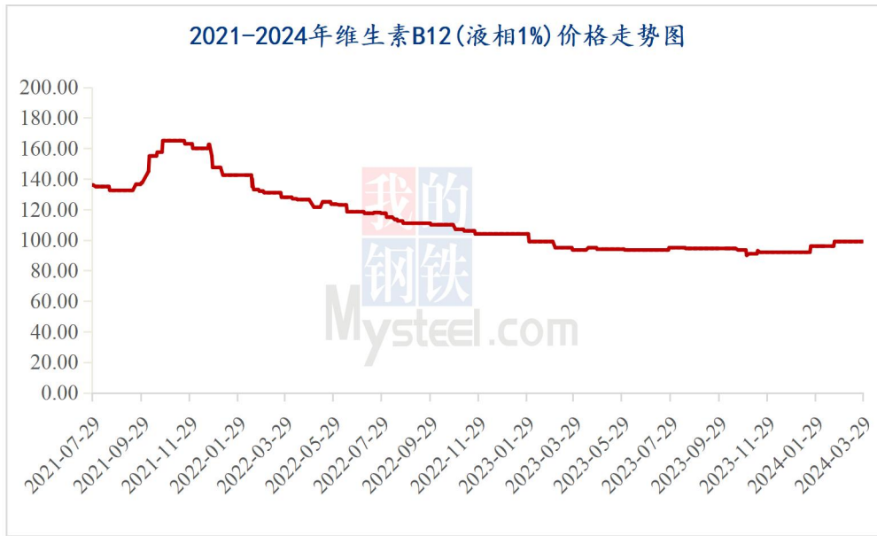
图 9 2021-2024 年维生素 B12 价格走势