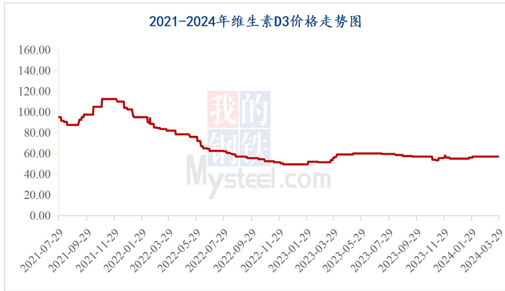
图 4 2021-2024 年维生素 D3 价格走势