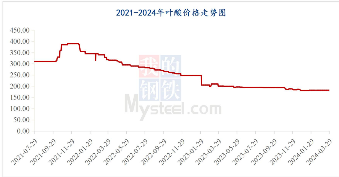
图 11 2021-2024 年叶酸价格走势