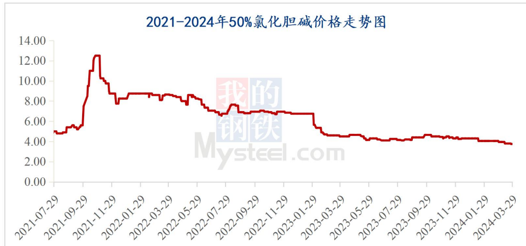
图 16 2021-2024 年氯化胆碱价格走势

截至本月底国内氯化胆碱市场均价 4.04 元/kg，胆碱主要原料三甲胺、环氧乙烷价格窄幅波动，胆碱工厂报价动态微调，后期需关注胆碱成本端价格变化及生产出货情况。