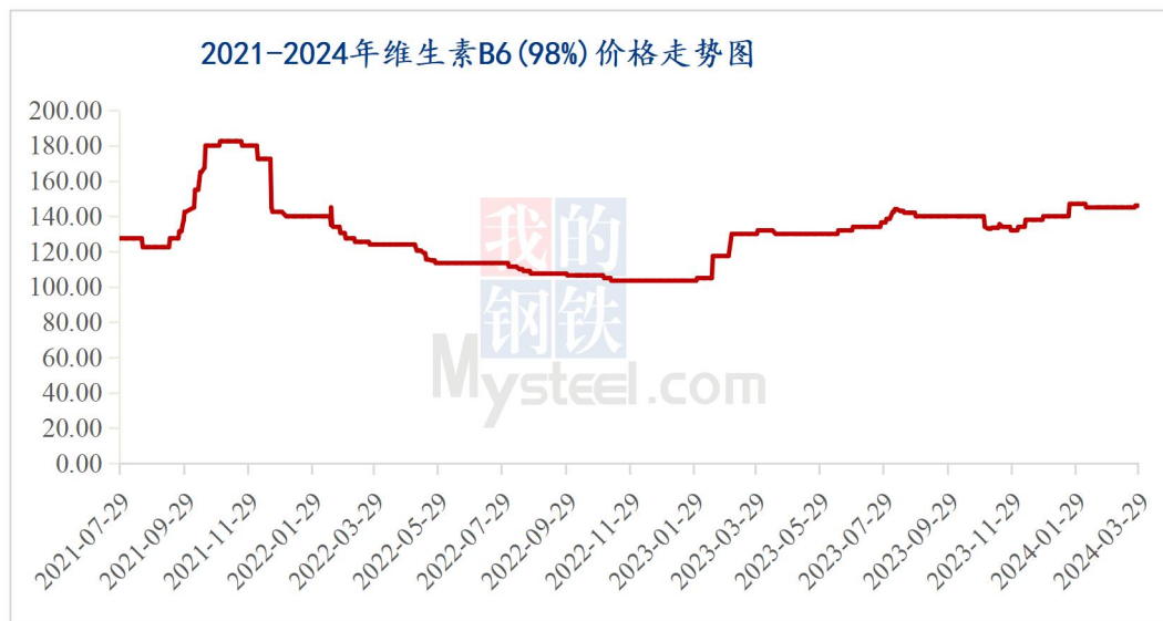
图 8 2021-2024 年维生素 B6 价格走势

截至本月国内维生素 B6 市场均价为 145.67 元/kg。市场偏稳运行，需求一般，整体报价偏稳。后期关注工厂生产及报价情况。据了解，新和成饲料级维生素 B6 报价 145 元/kg；天新药业公布饲料级维生素 B6 报价 148 元/kg，出口报价 19 美元/kg。