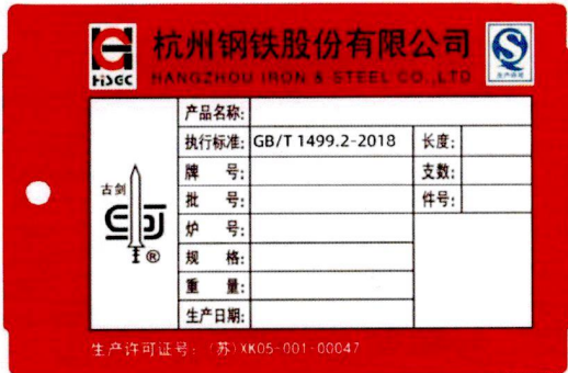
杭钢古剑 HRB400 螺纹钢标牌样张(红牌)