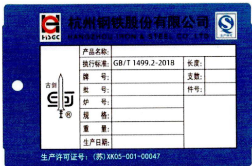
杭钢古剑 HRB400E 螺纹钢标牌样张(蓝牌)