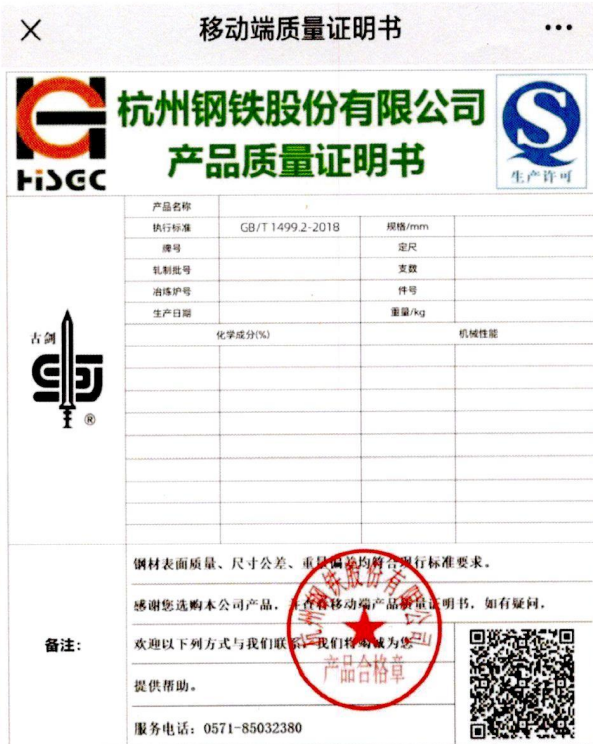
标牌二维码展示的对应质量证明书(防伪用)