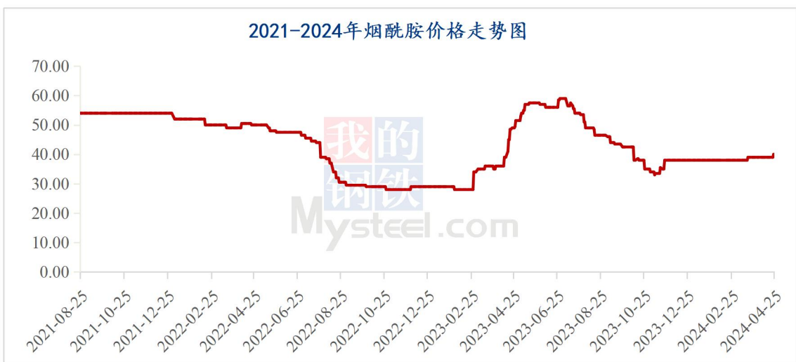
图 13 2021-2024 年烟酰胺价格走势图

本周国内市场主流报价 38-40 元/kg，厂家停止报价，市场价格偏稳运行，市场询单一般，交投价格偏强。