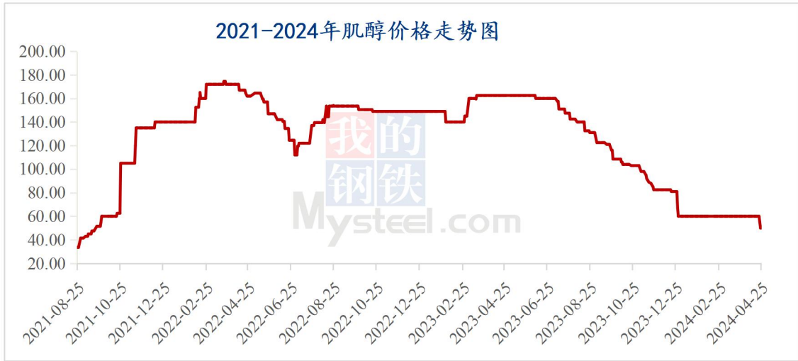
图 14 2021-2024 年肌醇价格走势图

本周国内肌醇市场报价 55-65 元/kg，价格弱稳运行，市场需求较弱，市场供大于需，关注后期市场成交情况。