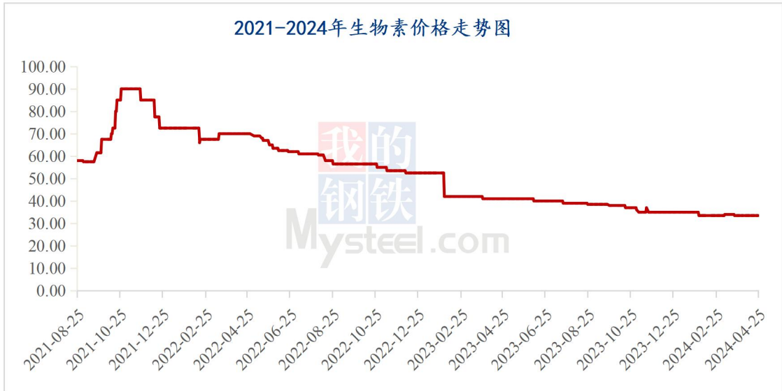
图 12 2021-2024 年生物素价格走势图

本周国内 2%生物素市场价格在 33-35 元/kg，价格偏稳运行，市场询单一般，交投价格偏弱，部分价格略低。