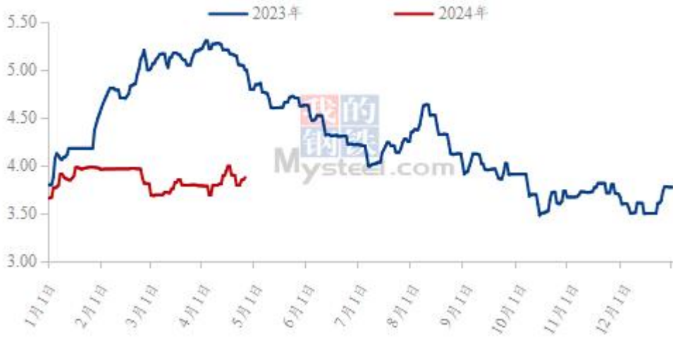
(2023年-2024年) 全国白羽肉鸡均价走势图 (元/斤)