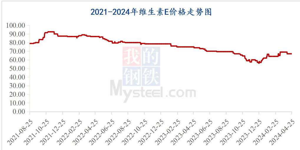
图 2 2021-2024 年维生素 E 价格走势