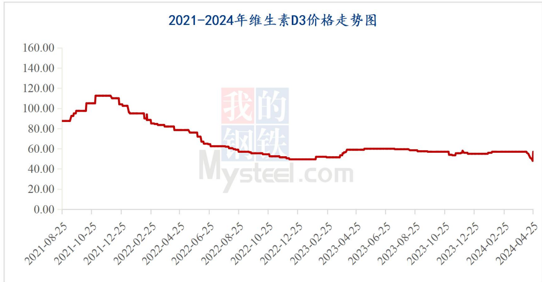
图 4 2021-2024 年维生素 D3 价格走势

本周国内维生素 D3 市场价格 56-58 元/kg，市场询单较冷清，下游需求一般，市场偏稳运行。