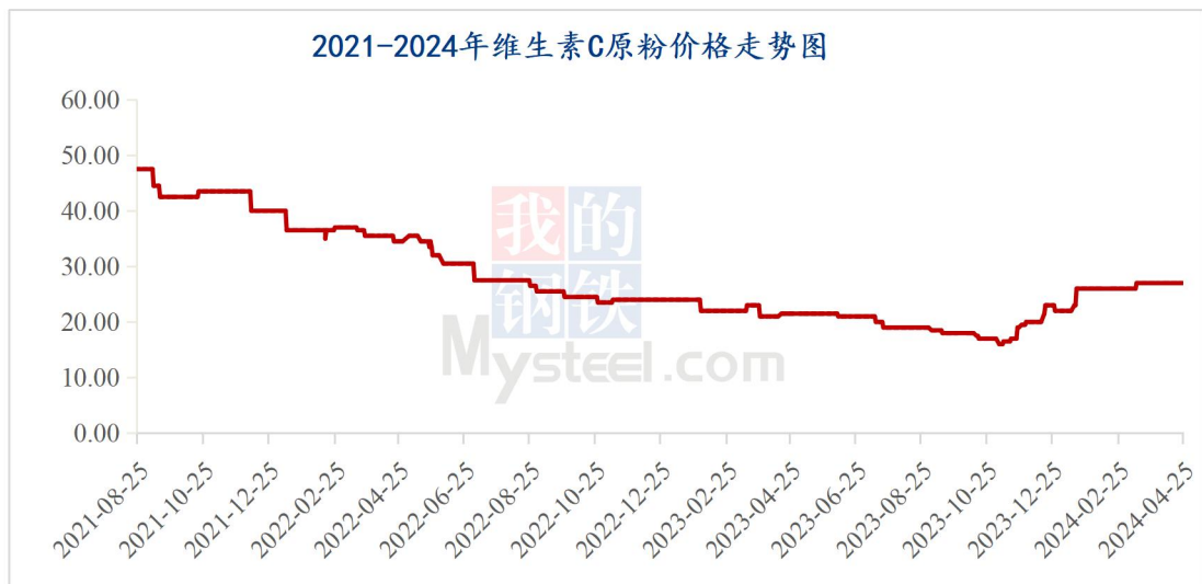
图 3 2021-2024 年维生素 C 价格走势

本周 VC 原粉国内市场报价 26-28 元/kg，厂家停止报价，市场询单较活跃，涨价情绪强烈，价格偏稳震荡。