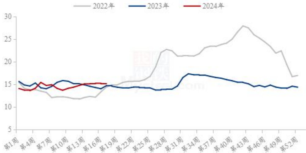
全国外三元生猪出栏均价周度走势图（元/公斤）