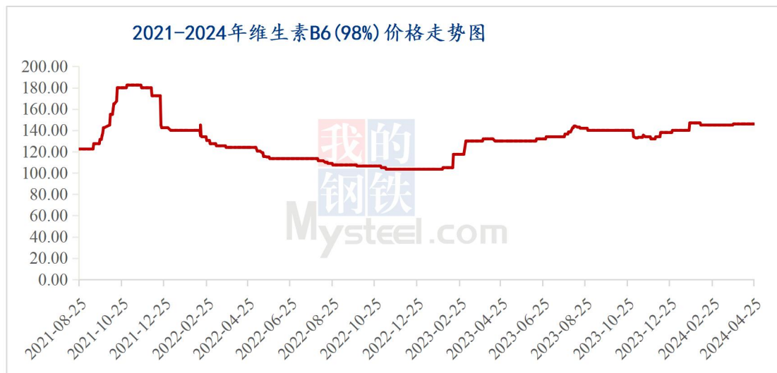
图 8 2021-2024 年维生素 B6 价格走势

本周国内市场主流报价 142-148 元/kg，厂家停止报价，市场偏稳运行，市场需求较一般。