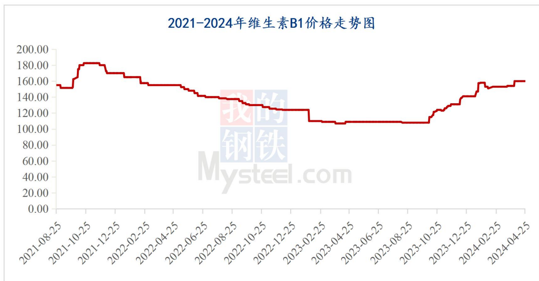
图 6 2021-2024 年维生素 B1 价格走势图

本周国内维生素 B1（80%）市场报价在 160-165 元/kg，下游需求一般，市场询单一般，市场成交价格偏强。