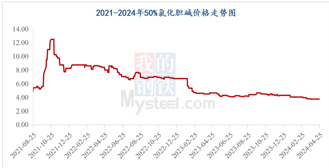
图 16 2021-2024 年氯化胆碱价格走势

本周国内氯化胆碱市场价格 3.7-3.8 元/kg。胆碱受原料三甲胺价格小幅波动，胆碱工厂报价小幅下调，市场价格跟随下调，后续主要关注其原料端三甲胺及环氧乙烷变化情况。