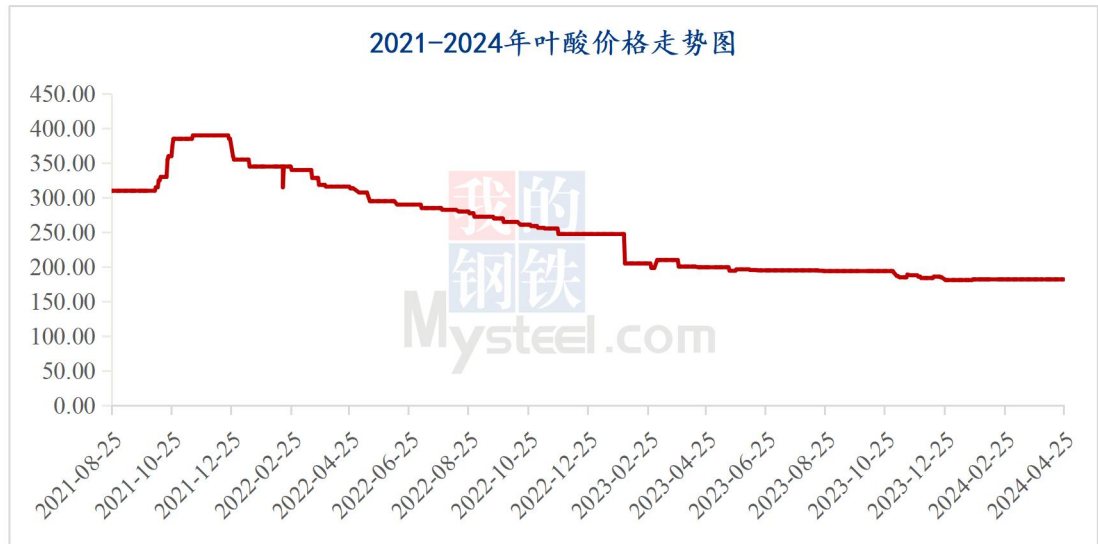
图 11 2021-2024 年叶酸价格走势

本周国内叶酸市场主流报价 179-185 元/kg，下游需求一般，市场实际成交一般，价格偏稳运行。