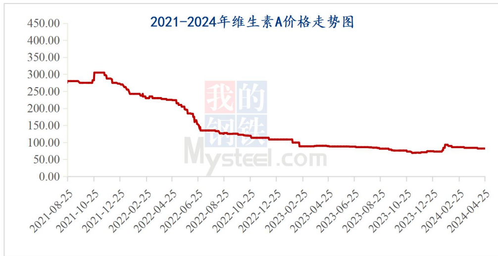
图 1 2021-2024 年维生素 A 价格走势图

据 Mysteel 对全国维生素市场价格调查，本周维生素 VA500 市场价格 82-86 元/kg，国外工厂上调报价，国内市场下游需求一般，观望为主，市场报价偏稳震荡。