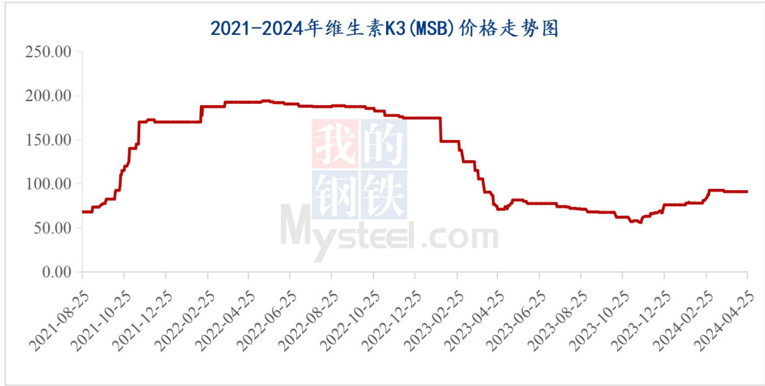
图 10 2021-2024 年维生素 K3 价格走势