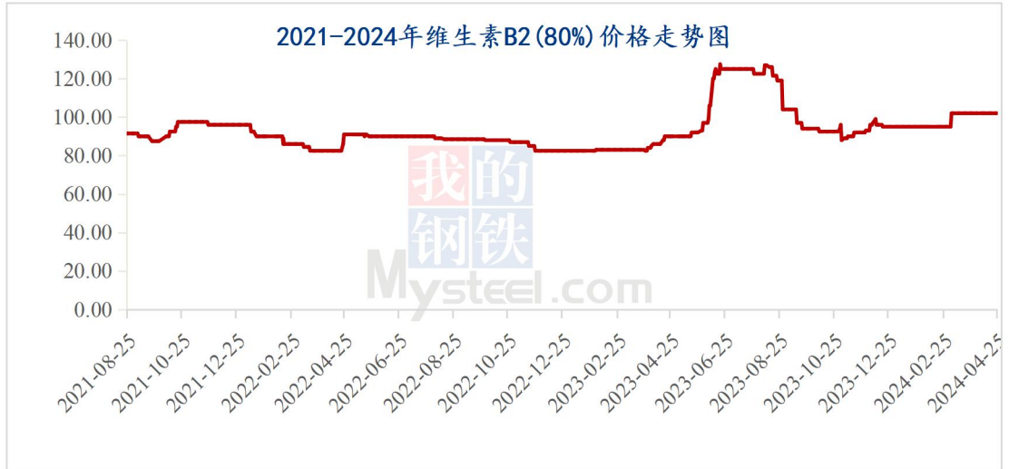
图 7 2021-2024 年维生素 B2 (80%) 价格走势