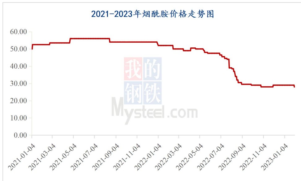
图 13 2021-2023 年烟酰胺价格走势图

本周国内市场主流报价 29-31 元/kg，价格小幅上调，整体弱势调整。虽市场报价略微提高，但成交价格仍有可议空间。预计交货会持续紧张，但价格是否上一个台阶，还有待观望。受上游原料供应及年前低价接单等综合影响，导致年后各工厂交货相对紧张，主流工厂选择停报观望，市场供货暂时出现一定缺口，成交价格也随之小幅上涨，截止目前，国内报价 30-32 元，成交在 29-31 左右，出口 FOB 报价在 USD3.8-4；据了解，各厂家有涨价意愿，具体如何走势，重点关注吉林论坛会场信息和会后各工厂报价签单情况。