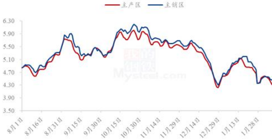
图 20 全国鸡蛋主产区与主销区价格对比图