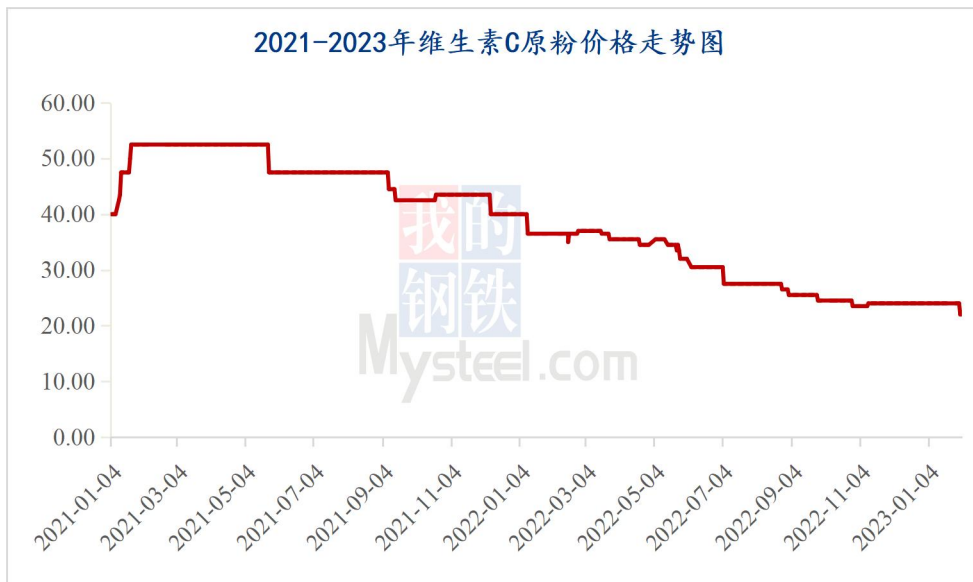
图 3 2021-2023 年维生素 C 价格走势图

本周 VC 原粉国内市场报价 20-22 元/kg，下游需求一般，终端适量补货，部分品牌略低一些。