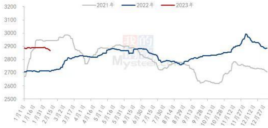
图 17 2021-2023 年全国玉米均价走势图