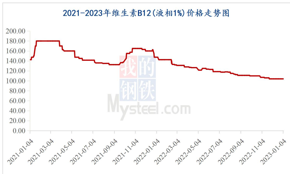
图 9 2021-2023 年维生素 B12 价格走势图