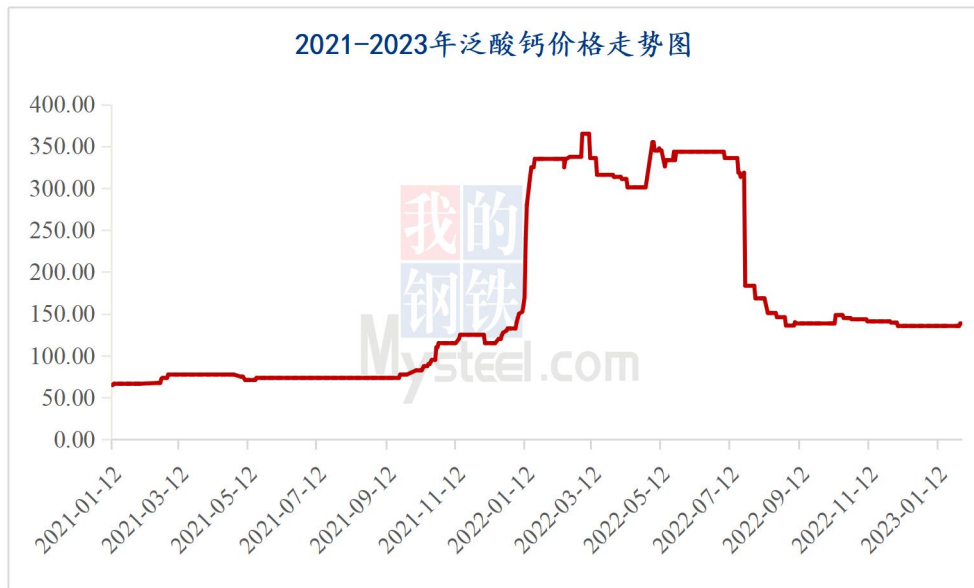
图 5 2021-2023 年泛酸钙价格走势