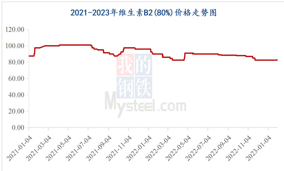
图 7 2021-2023 年维生素 B2 (80%) 价格走势

本周国内 VB2(80%)市场价格 80-86 元/kg，欧洲市场价格 15.50-16.00 欧元/kg，VB2(98%)市场价格 325-350 元/kg。市场需求一般，整体报价有维持平稳，根据品牌、日期不同，局部价格略低。