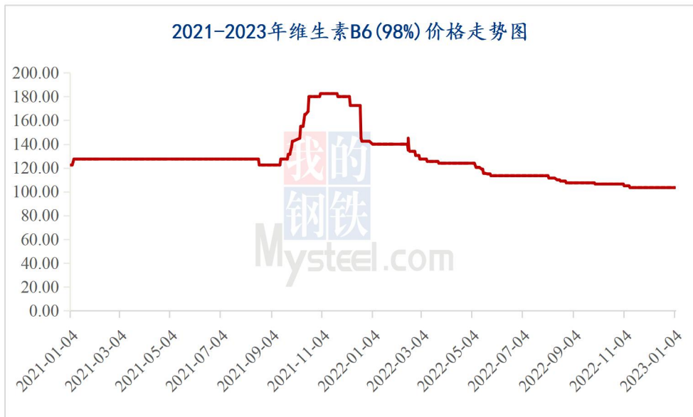
图 8 2021-2023 年维生素 B6 价格走势图