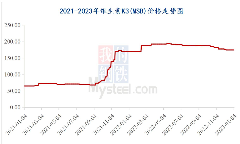
图 10 2021-2023 年维生素 K3 价格走势

本周国内维生素 K3（MSB）市场主流价格在 140-155 元/kg，MNB 市场价格在 160-175 元/kg。市场需求一般，询单略平淡，K3 价格平稳偏弱。部分上游工厂停产检修。