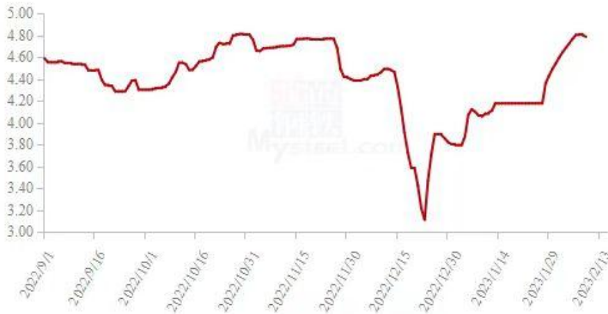
图 19 全国白羽肉鸡均价走势图