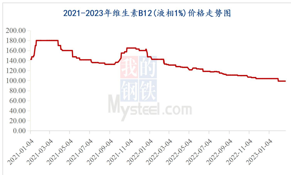
图 9 2021-2023 年维生素 B12 价格走势图