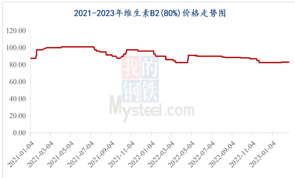
图 7 2021-2023 年维生素 B2 (80%) 价格走势

本周国内 VB2(80%)市场价格 80-86 元/kg，欧洲市场价格 15.50-16.00 欧元/kg，VB2(98%)市场价格 325-350 元/kg。市场需求一般，整体报价有维持平稳，根据品牌、日期不同，局部价格略低。