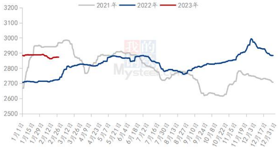
图 17 2021-2023 年全国玉米均价走势图