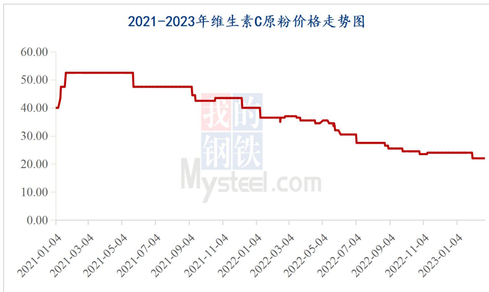
图 3 2021-2023 年维生素 C 价格走势图

本周 VC 原粉国内市场报价 20-22 元/kg，下游需求一般，终端适量补货，部分品牌略低一些。