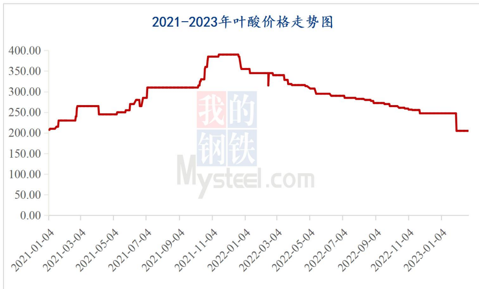
图 11 2021-2023 年叶酸价格走势