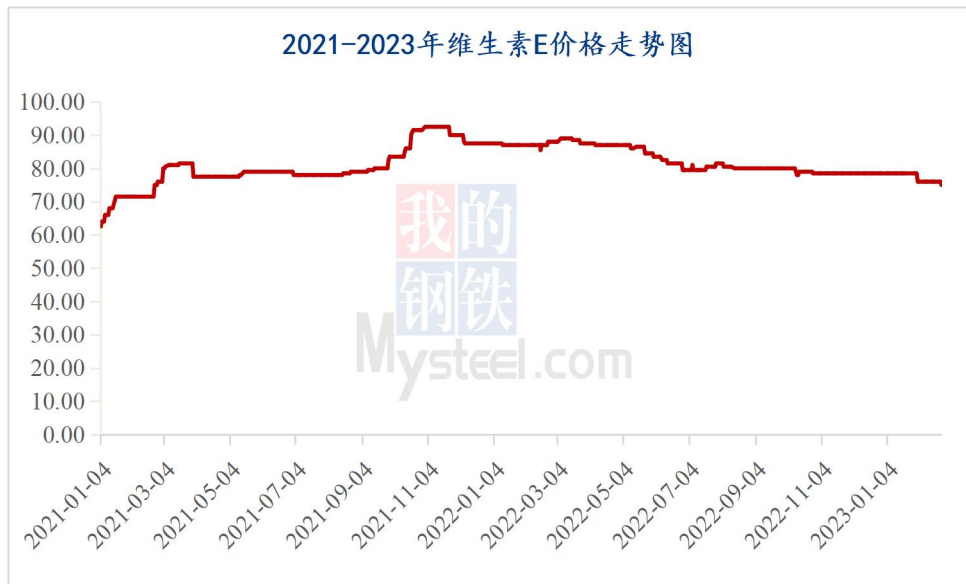
图 2 2021-2023 年维生素 E 价格走势图