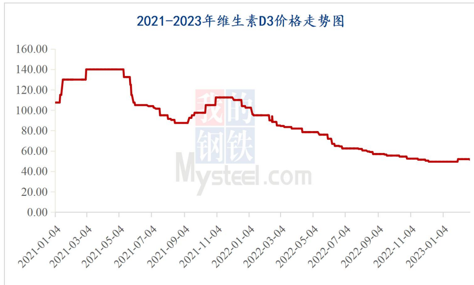
图 4 2021-2023 年维生素 D3 价格走势图

本周国内维生素 D3 国内市场主流价格为 50-55 元/kg，欧洲市场报价为 7.50-8.50 欧元/kg。市场需求偏淡，询单一般，经销渠道出货积极，价格平稳偏弱。