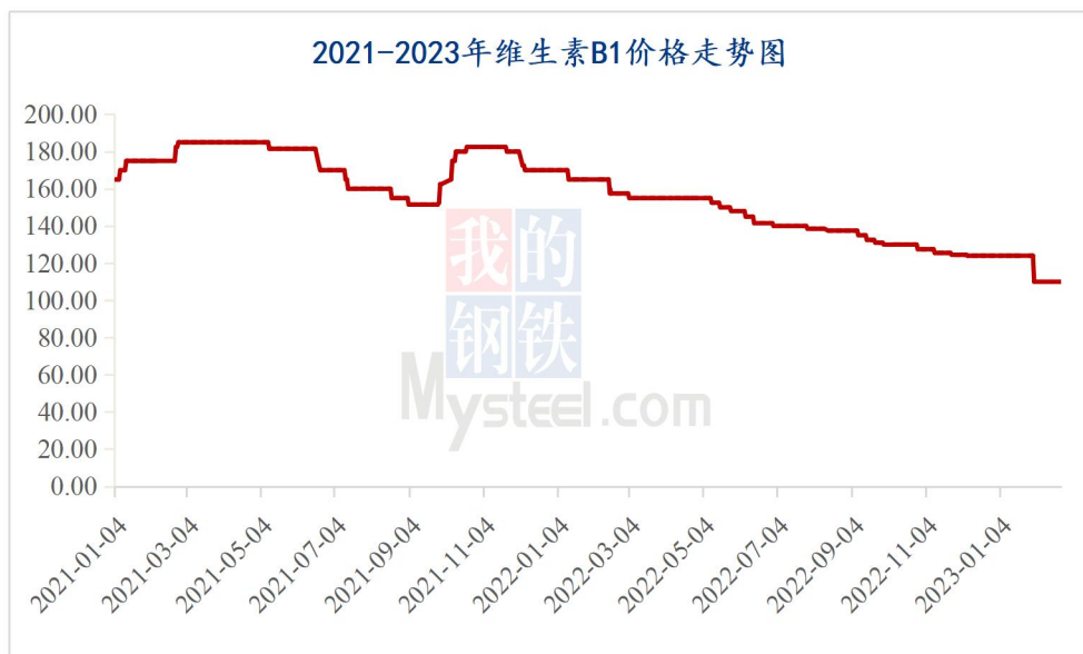
图 6 2021-2023 年维生素 B1 价格走势

本周国内维生素 B1 市场报价在 106-110 元/kg，下游需求较弱，询单较为平淡，工厂报价下调，市场渠道价格走弱。