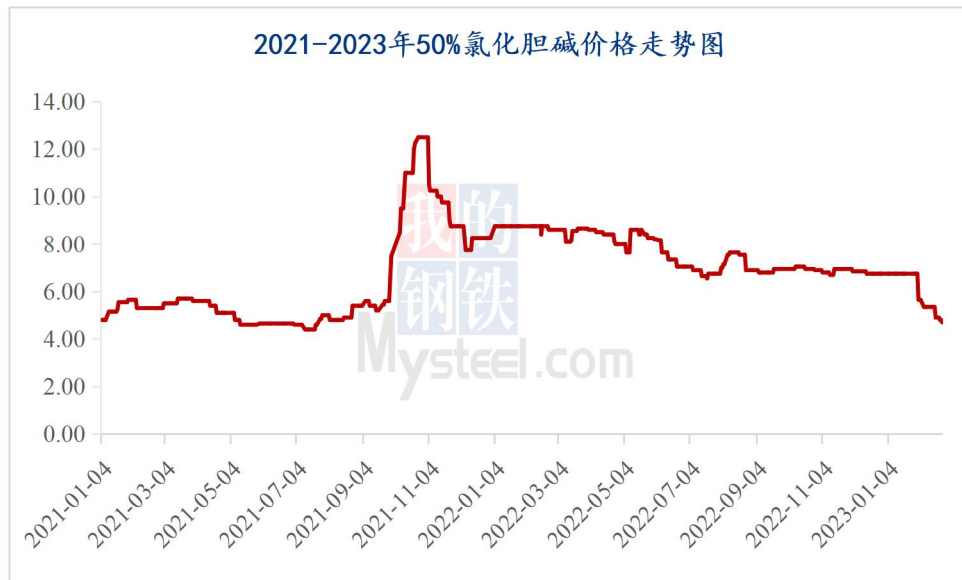
图 16 2021-2023 年氯化胆碱价格走势

本周国内氯化胆碱市场价格 4.6-4.9 元/kg。胆碱，受原料三甲胺价格高位波动，胆碱工厂报价动态调整，后续主要关注三甲胺变化情况。