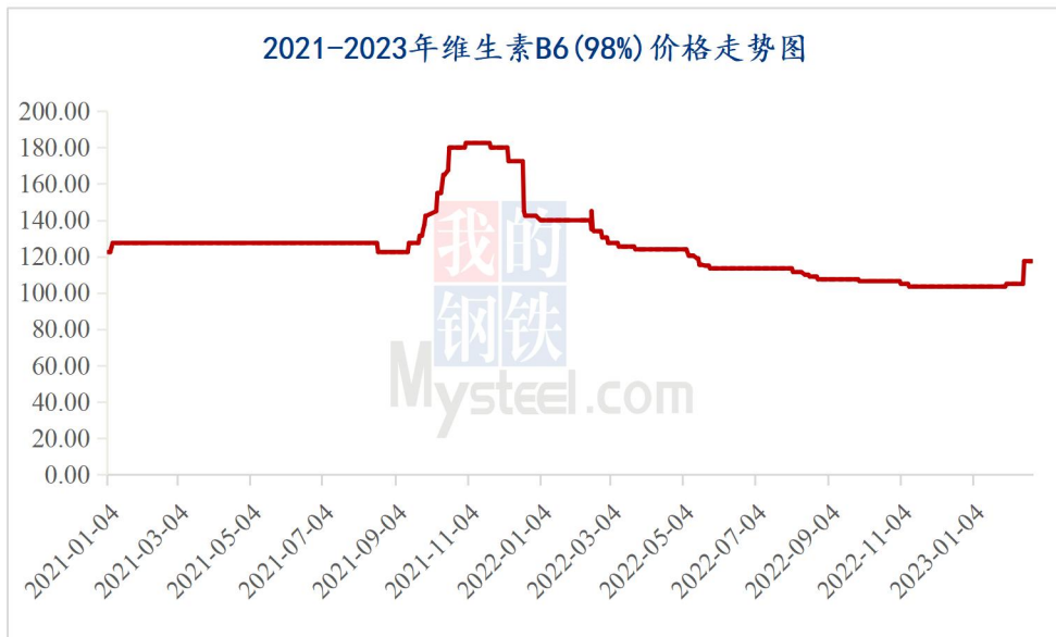
图 8 2021-2023 年维生素 B6 价格走势图