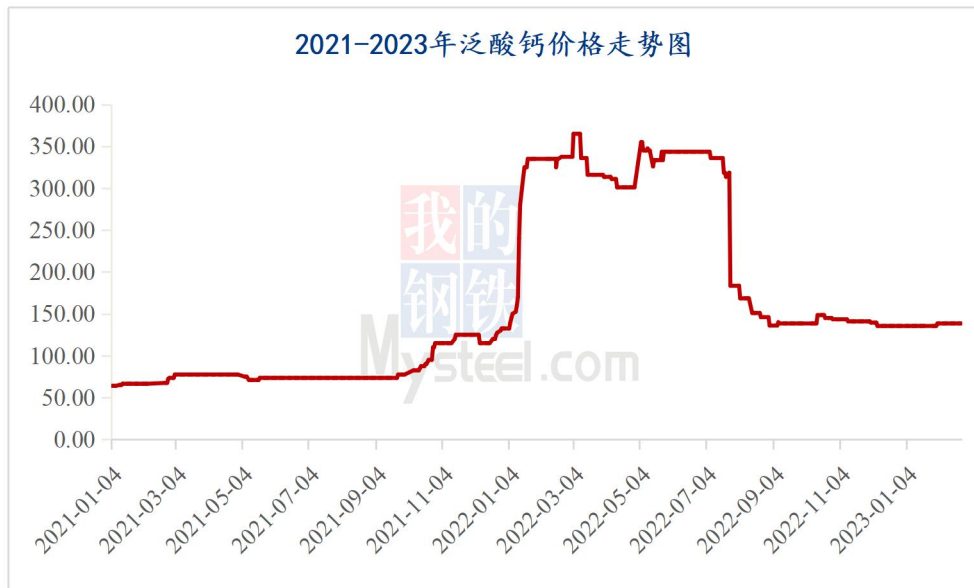
图 5 2021-2023 年泛酸钙价格走势