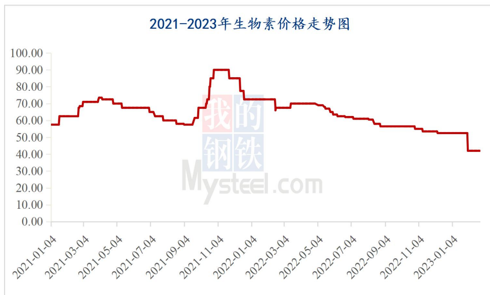
图 12 2021-2023 年生物素价格走势

本周国内 2%生物素市场价格在 40-43 元/kg，市场询单一般，交投价格平稳偏弱，部分价格略低。