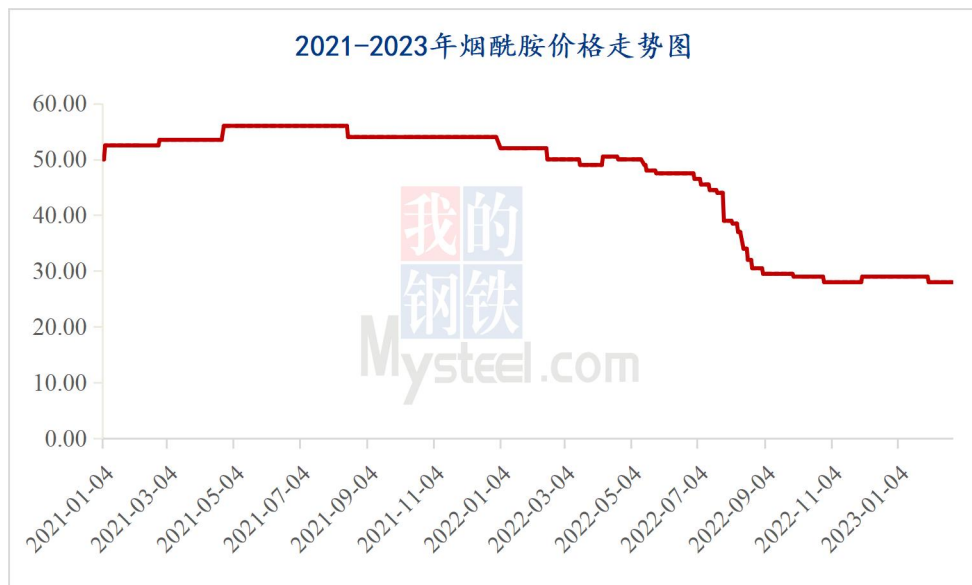
图 13 2021-2023 年烟酰胺价格走势图

本周国内市场主流报价 32-34 元/kg，由于上游原材料紧缺，产品供应出现缺口，工厂挺价意愿明显，目前主流出口报价基本在 USD 4.0-4.2，国内 RMB 31-32 左右，交期基本延至第二季度，市场活跃度，国内外询单量明显增加，短期内小幅上涨趋势明显。