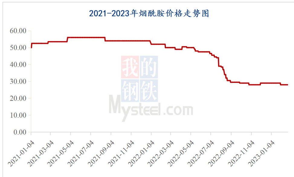
图 13 2021-2023 年烟酰胺价格走势图

本周国内市场主流报价 32-34 元/kg，由于上游原材料紧缺，产品供应出现缺口，工厂挺价意愿明显，目前主流出口报价基本在 USD 4.0-4.2，国内 RMB 31-32 左右，交期基本延至第二季度，市场活跃度，国内外询单量明显增加，短期内小幅上涨趋势明显。