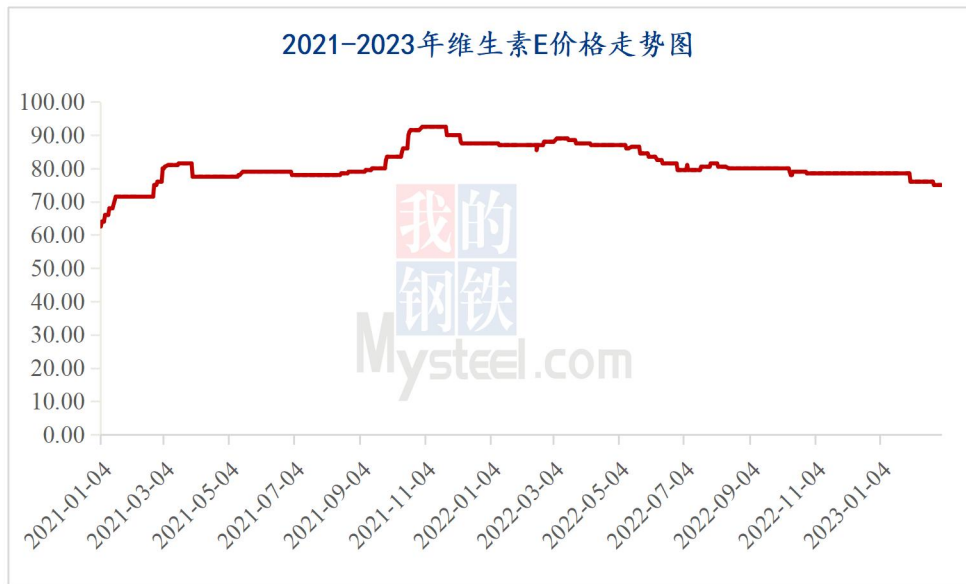
图 2 2021-2023 年维生素 E 价格走势图