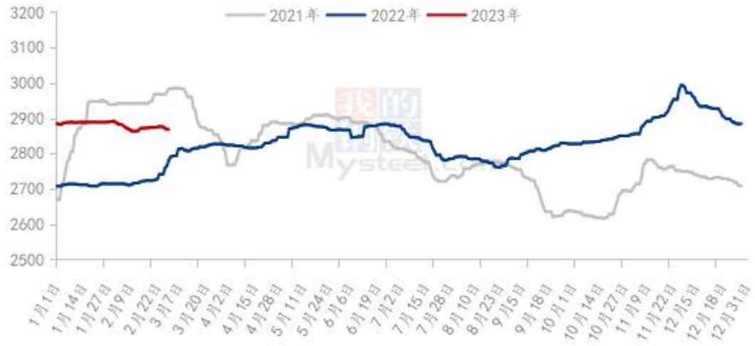
图 17 2021-2023 年全国玉米均价走势图