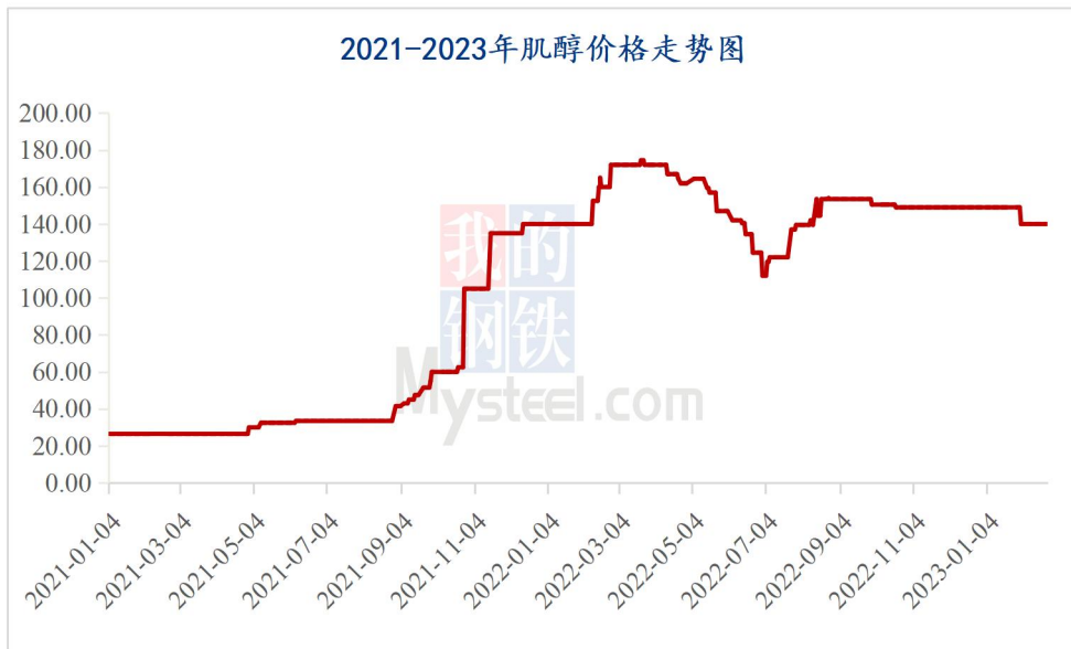
图 14 2021-2023 年肌醇价格走势图