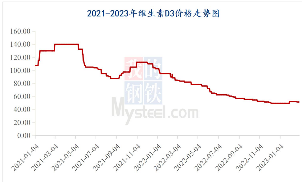
图 4 2021-2023 年维生素 D3 价格走势图

本周国内维生素 D3 国内市场主流价格为 50-53 元/kg，欧洲市场报价为 7.00-8.00 欧元/kg。市场需求偏淡，询单一般，经销渠道出货积极，价格平稳偏弱。