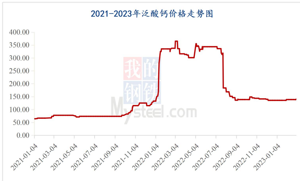
图 5 2021-2023 年泛酸钙价格走势