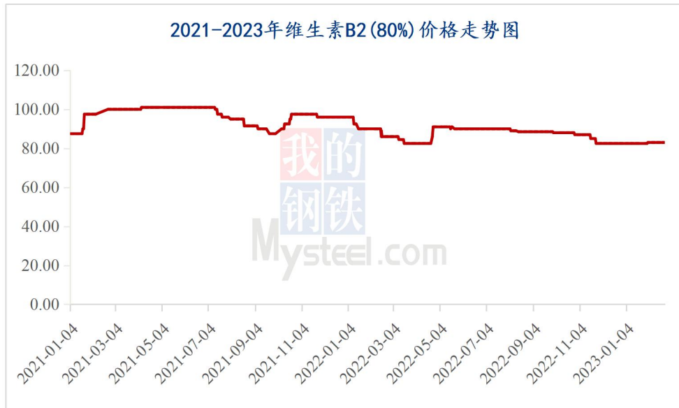
图 7 2021-2023 年维生素 B2 (80%) 价格走势

本周国内 VB2(80%)市场价格 80-86 元/kg，欧洲市场价格 15.50-16.50 欧元/kg，VB2(98%)市场价格 325-350 元/kg。市场需求一般，整体报价有维持平稳，根据品牌、日期不同，局部价格略低。