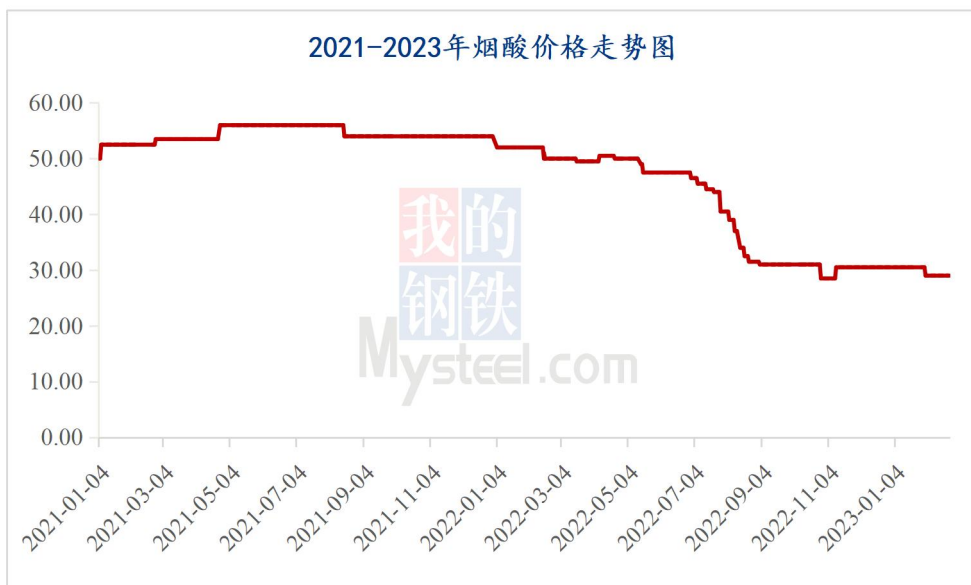
图 15 2021-2023 年烟酸价格走势图

本周国内市场主流报价 32-34 元/kg，市场整体相对平稳。受上游原料供应及年前低价接单等综合影响，导致年后各工厂交货相对紧张，主流工厂选择停报观望，市场供货暂时出现一定缺口，成交价格也随之小幅上涨，据了解，各厂家有涨价意愿，具体如何走势，重点关注吉林论坛会场信息和会后各工厂报价签单情况。