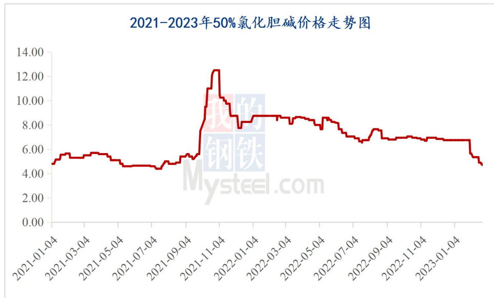
图 16 2021-2023 年氯化胆碱价格走势

本周国内氯化胆碱市场价格 4.5-4.8 元/kg。胆碱，受原料三甲胺价格高位波动，胆碱工厂报价动态调整，后续主要关注三甲胺变化情况。