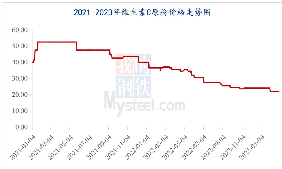
图 3 2021-2023 年维生素 C 价格走势图

本周 VC 原粉国内市场报价 20-22 元/kg，下游需求一般，终端适量补货，部分品牌略低一些。