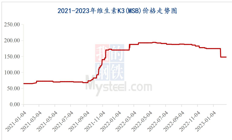
图 10 2021-2023 年维生素 K3 价格走势图

本周国内维生素 K3（MSB）市场主流价格在 125-130 元/kg，MNB 市场价格在 140-150 元/kg。市场需求一般，询单略平淡，K3 价格平稳偏弱。部分上游工厂停产检修。