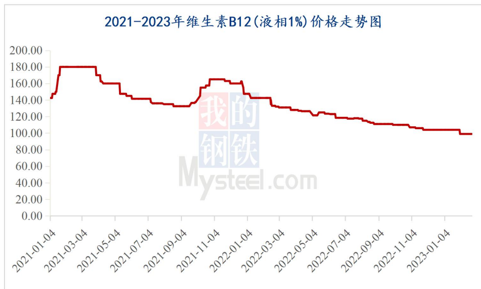
图 9 2021-2023 年维生素 B12 价格走势