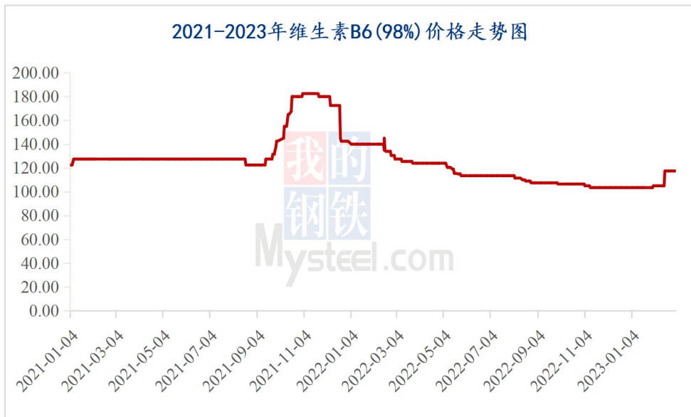
图 8 2021-2023 年维生素 B6 价格走势