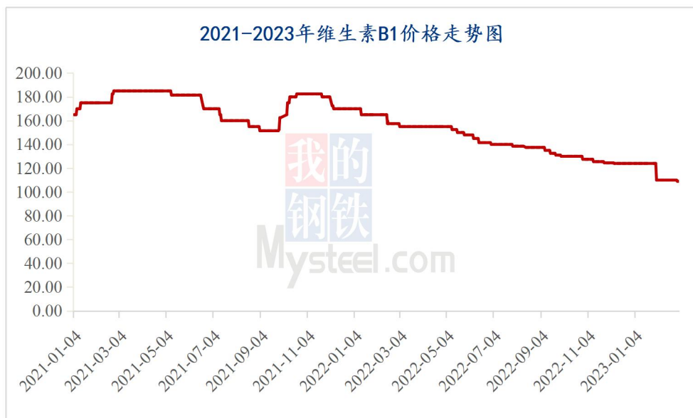
图 6 2021-2023 年维生素 B1 价格走势

本周国内维生素 B1 市场报价在 106-110 元/kg，下游需求较弱，询单较为平淡，工厂报价下调，市场渠道价格走弱。