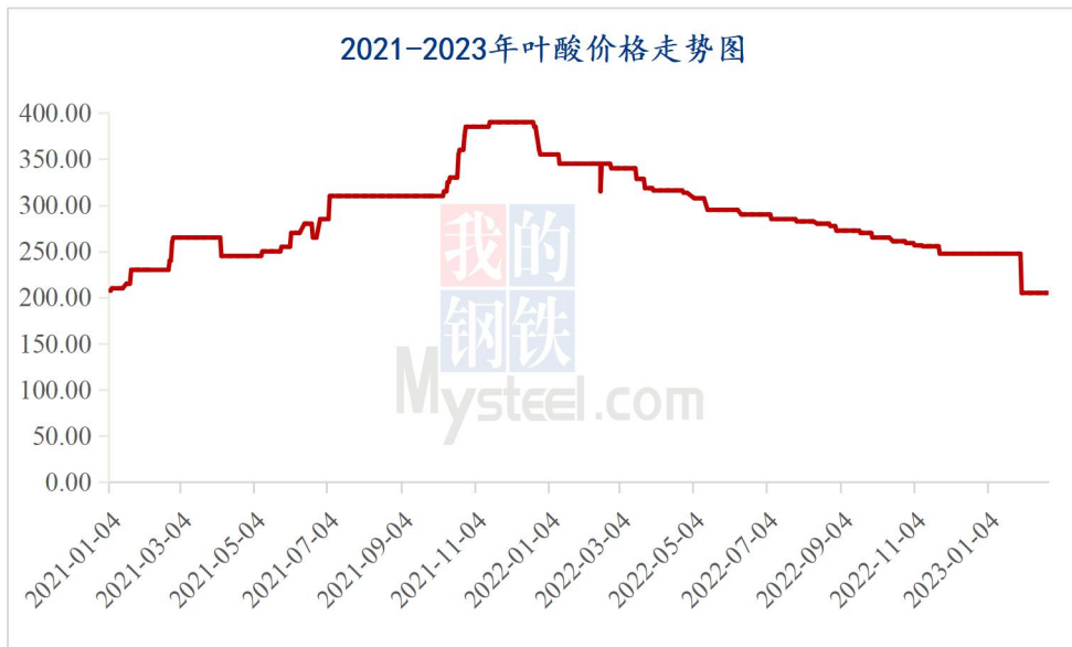
图 11 2021-2023 年叶酸价格走势走势图