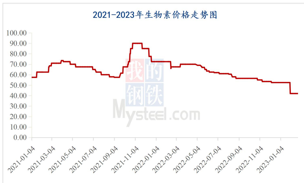
图 12 2021-2023 年生物素价格走势走势图

本周国内 2%生物素市场价格在 40-43 元/kg，市场询单一般，交投价格平稳偏弱，部分价格略低。