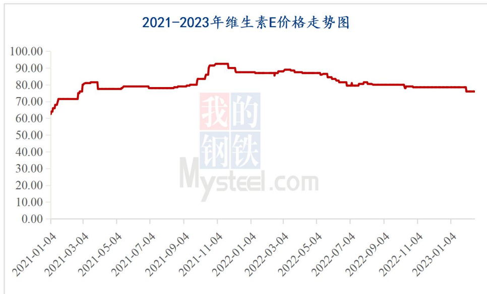
图 2 2021-2023 年维生素 E 价格走势图