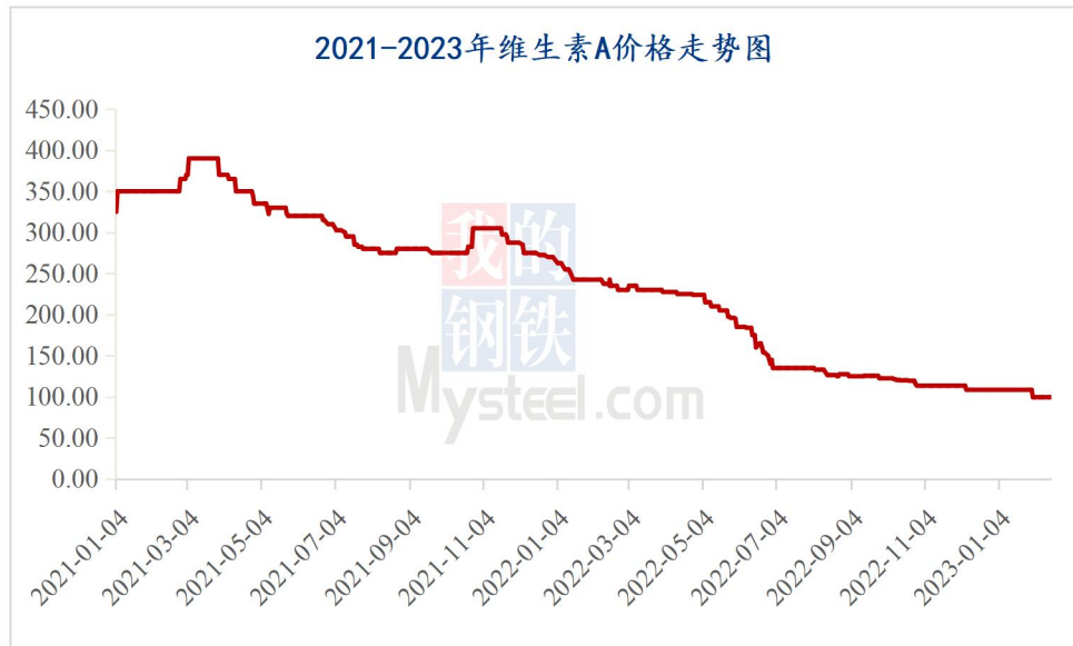
图 1 2023 年维生素 A 价格走势图

据 Mysteel 对全国维生素市场价格调查，本周维生素 A500 市场国内价格 87-90 元/kg，采购需求持续弱勢，询单较淡，市场报价平稳偏弱，局部价格略低。欧洲 VA1000 市场报价 27-29 欧元/kg。