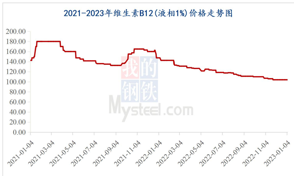
图 9 2021-2023 年维生素 B12 价格走势