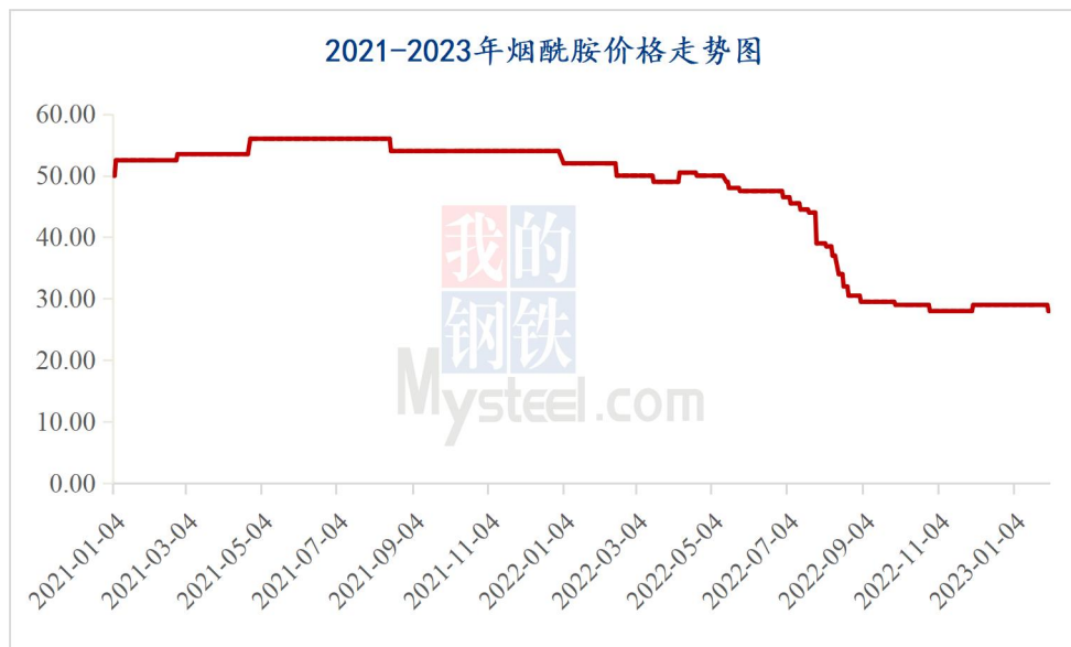
图 13 2021-2023 年烟酰胺价格走势图

本周国内市场主流报价 29-31 元/kg，由于上游原材料紧缺，产品供应出现缺口，工厂挺价意愿明显，目前主流出口报价基本在 USD 4.0-4.2，国内 RMB 31-32 左右，交期基本延至第二季度，市场活跃度，国内外询单量明显增加，短期内小幅上涨趋势明显。