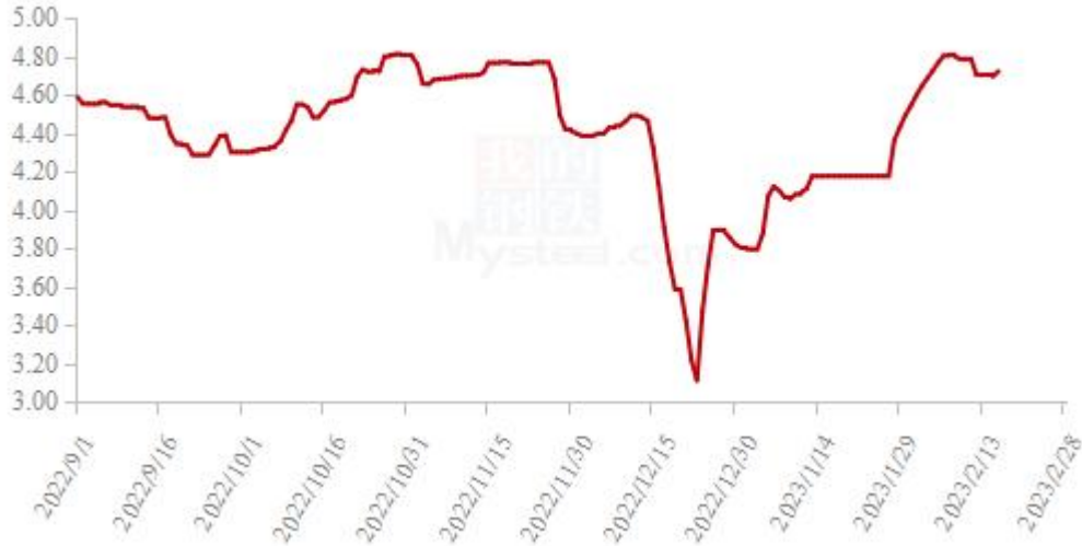
图 19 全国白羽肉鸡均价走势图