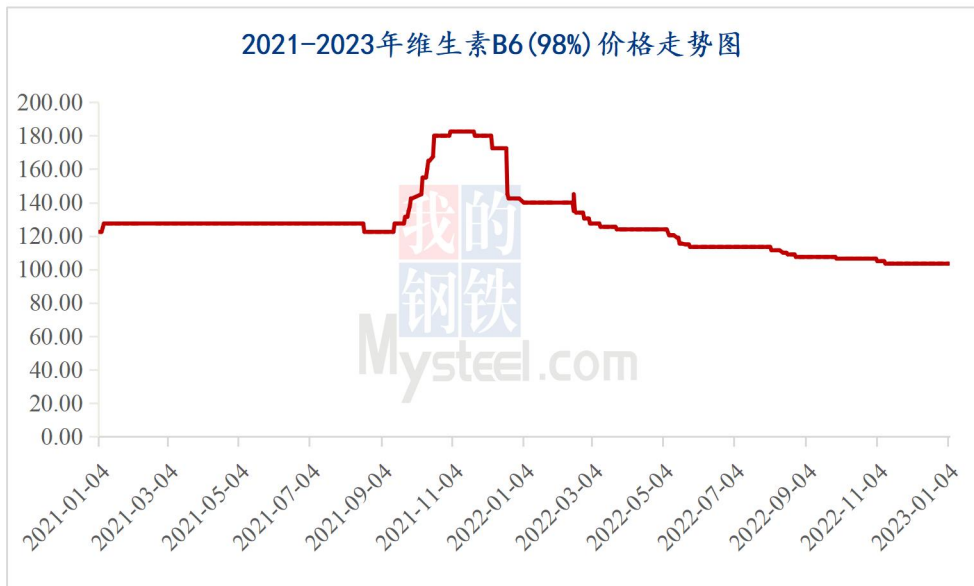
图 8 2021-2023 年维生素 B6 价格走势