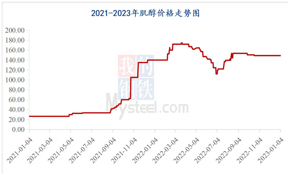
图 14 2021-2023 年肌醇价格走势图