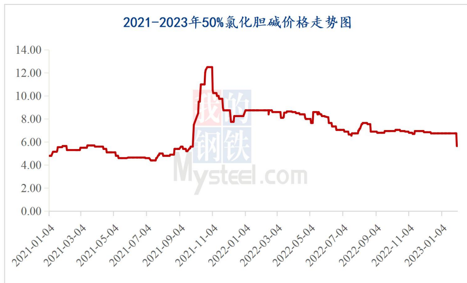
图 16 2021-2023 年氯化胆碱价格走势图

本周国内氯化胆碱市场价格 5.3-5.5 元/kg。胆碱，受原料三甲胺和环氧乙烷价格上涨影响，各工厂小幅上调 20-30 美金，但市场反应相对比较平淡。现阶段氯化胆碱 60% 粉国内出厂报价在 6100 元左右，氯化胆碱受原料面影响较大，后续主要关注三甲胺变化情况。