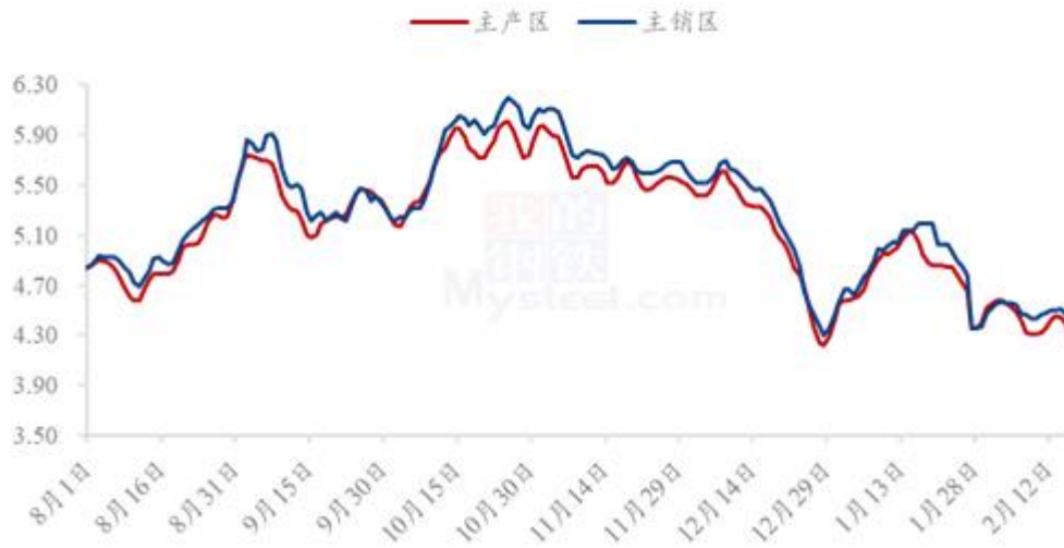
图 20 全国鸡蛋主产区与主销区价格对比图