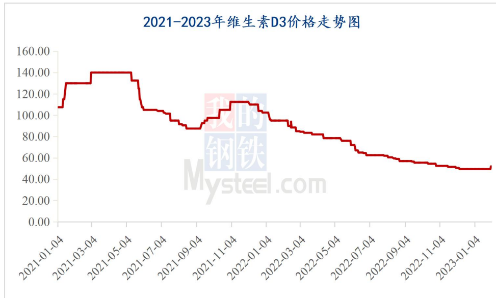
图 4 2021-2023 年维生素 D3 价格走势图

本周国内维生素 D3 国内市场主流价格为 50-55 元/kg，欧洲市场报价为 7.50-8.50 欧元/kg。市场需求偏淡，询单一般，经销渠道出货积极，价格平稳偏弱。