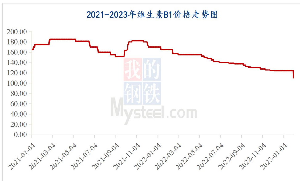
图 6 2021-2023 年维生素 B1 价格走势

本周国内维生素 B1 市场报价在 108-112 元/kg，下游需求较弱，询单较为平淡，工厂报价下调，市场渠道价格走弱。