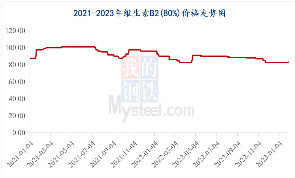
图 7 2021-2023 年维生素 B2 (80%) 价格走势

本周国内 VB2(80%)市场价格 80-86 元/kg，欧洲市场价格 15.50-16.00 欧元/kg，VB2(98%)市场价格 325-350 元/kg。市场需求一般，整体报价有维持平稳，根据品牌、日期不同，局部价格略低。