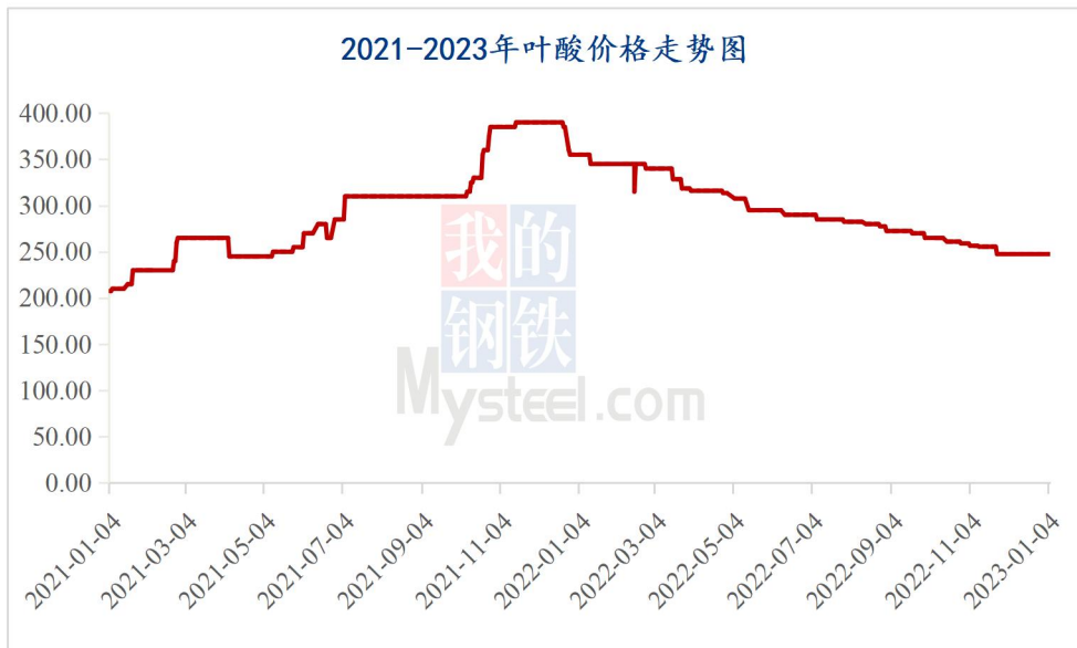
图 11 2021-2023 年叶酸价格走势