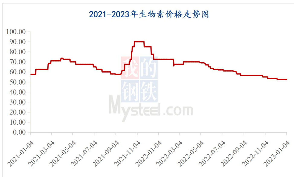
图 12 2021-2023 年生物素价格走势

本周国内 2%生物素市场价格在 40-43 元/kg，市场询单一般，交投价格平稳偏弱，部分价格略低。