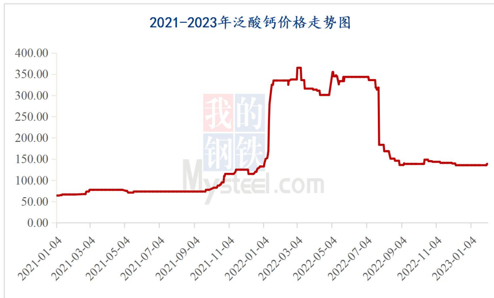
图 5 2021-2023 年泛酸钙价格走势