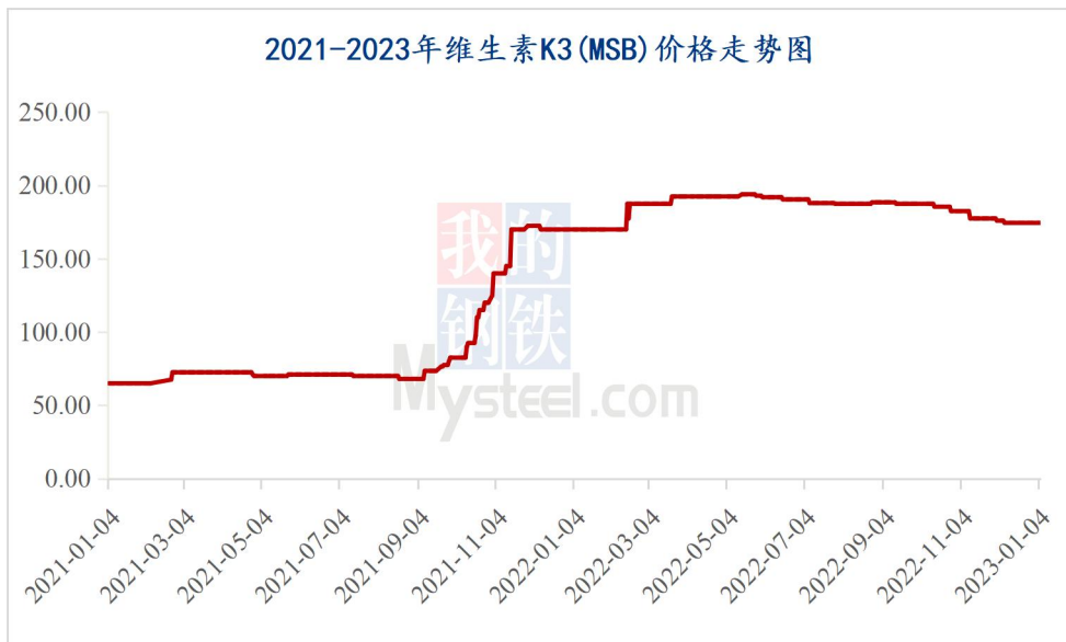
图 10 2021-2023 年维生素 K3 价格走势图

本周国内维生素 K3（MSB）市场主流价格在 140-155 元/kg，MNB 市场价格在 160-175 元/kg。市场需求一般，询单略平淡，K3 价格平稳偏弱。部分上游工厂停产检修。