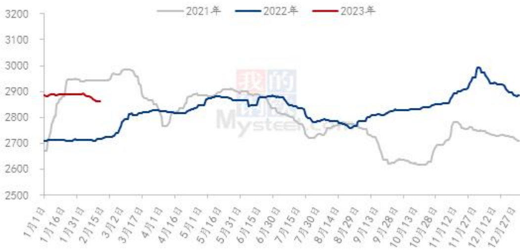
图 17 2021-2023 年全国玉米均价走势图