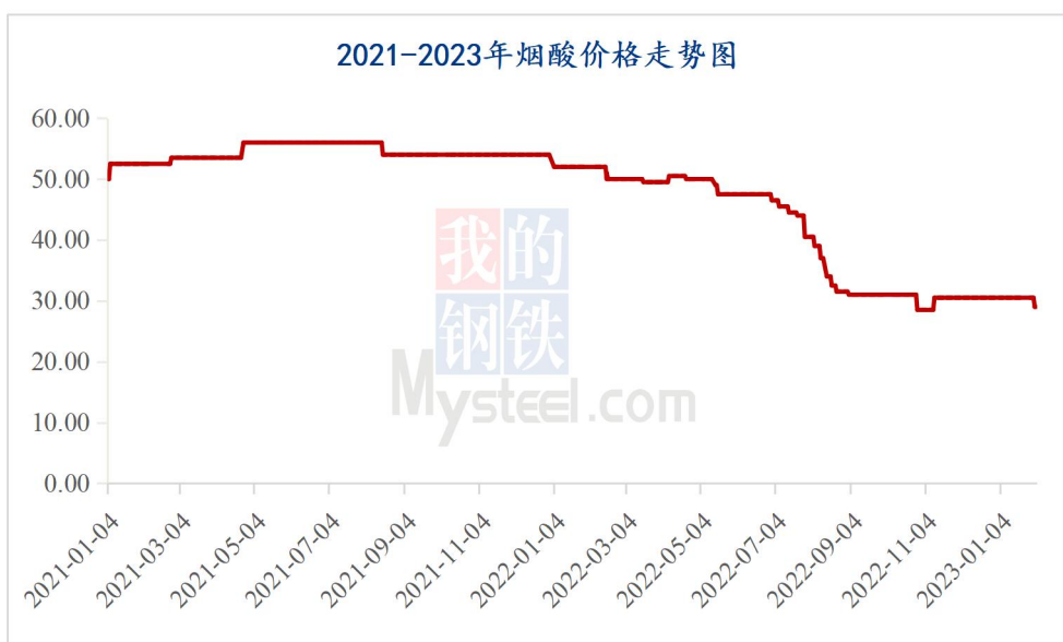
图 15 2021-2023 年烟酸价格走势图

本周国内市场主流报价 28-32 元/kg，市场整体相对平稳。受上游原料供应及年前低价接单等综合影响，导致年后各工厂交货相对紧张，主流工厂选择停报观望，市场供货暂时出现一定缺口，成交价格也随之小幅上涨，截止目前，国内报价 30-32 元，成交在 29-31 左右，出口 FOB 报价在 USD3.8-4；据了解，各厂家有涨价意愿，具体如何走势，重点关注吉林论坛会场信息和会后各工厂报价签单情况。