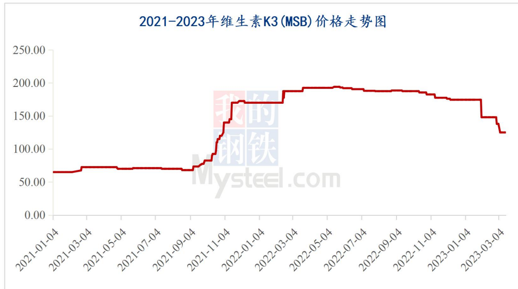
图 10 2021-2023 年维生素 K3 价格走势

本周国内维生素 K3 (MSB) 市场主流价格在 108-113 元/kg，MNB 市场价格在 118-125 元/kg。市场需求一般，询单略平淡，K3 价格平稳偏弱。