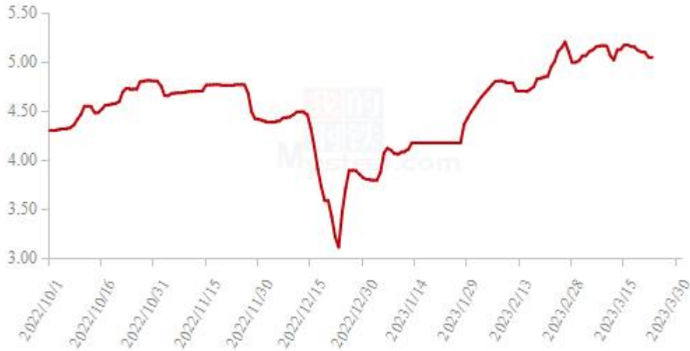
图 19 全国白羽肉鸡均价走势图