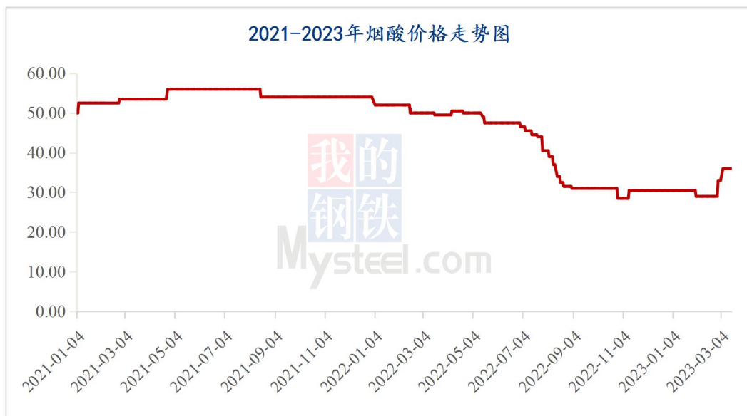
图 15 2021-2023 年烟酸价格走势图

本周国内市场主流报价 33-35 元/kg，市场整体相对平稳。受上游原料供应及年前低价接单等综合影响，导致年后各工厂交货相对紧张，主流工厂选择停报观望，市场供货暂时出现一定缺口，成交价格也随之小幅上涨。