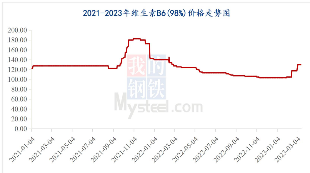
图 8 2021-2023 年维生素 B6 价格走势