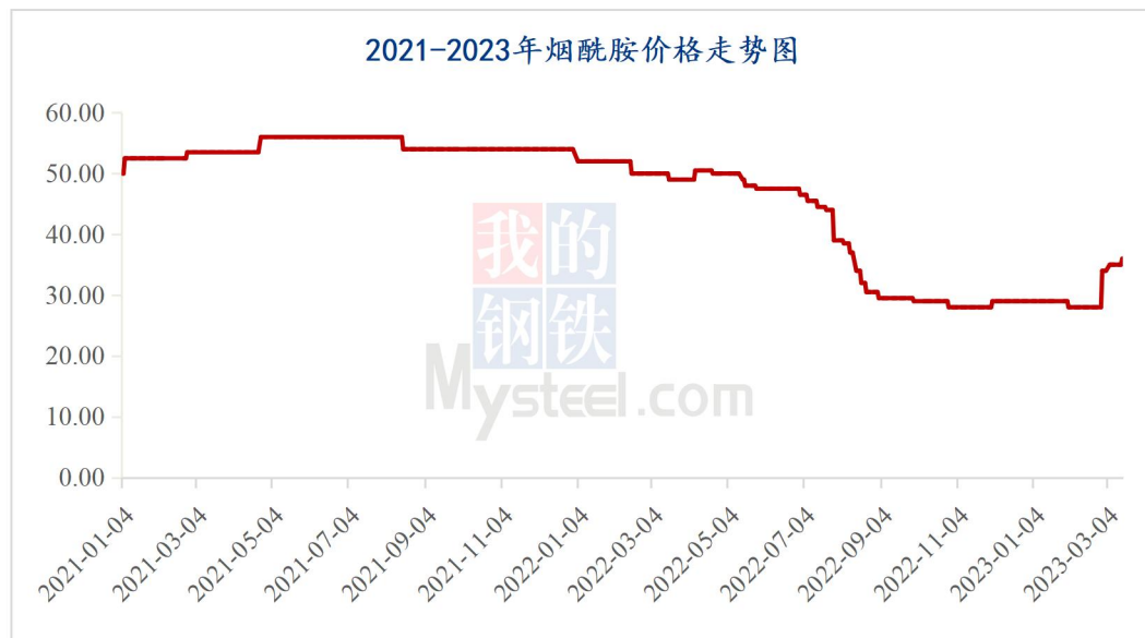
图 13 2021-2023 年烟酰胺价格走势图

本周国内市场主流报价 34-36 元/kg，由于上游原材料紧缺，产品供应出现缺口，工厂挺价意愿明显，目前主流出口报价基本在 USD 4.0-4.2，国内 RMB 31-32 左右，交期基本延至第二季度，市场活跃度，国内外询单量明显增加，短期内小幅上涨趋势明显。