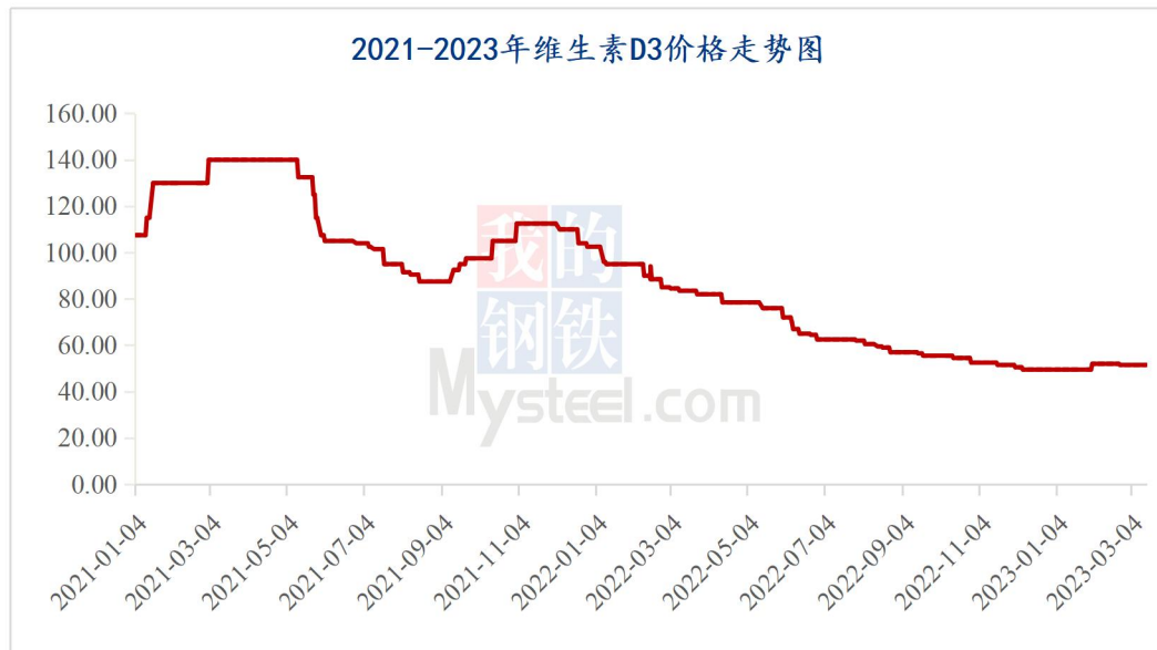
图 4 2021-2023 年维生素 D3 价格走势图

本周国内维生素 D3 国内市场主流价格为 50-54 元/kg，欧洲市场报价为 7.00-8.00 欧元/kg。市场需求偏淡，询单一般，经销渠道出货积极，价格平稳偏弱。