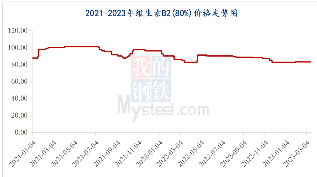
图 7 2021-2023 年维生素 B2 (80%) 价格走势

本周国内 VB2(80%)市场价格 80-86 元/kg，欧洲市场价格 15.50-16.50 欧元/kg，VB2(98%)市场价格 325-350 元/kg。市场需求一般，整体报价有维持平稳，根据品牌、日期不同，局部价格略低。