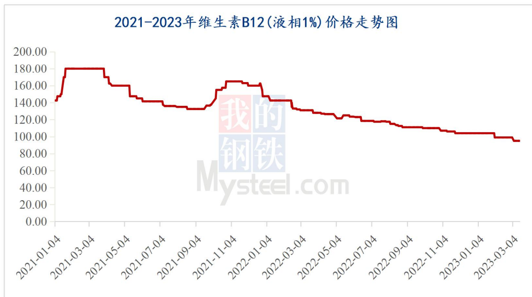
图 9 2021-2023 年维生素 B12 价格走势