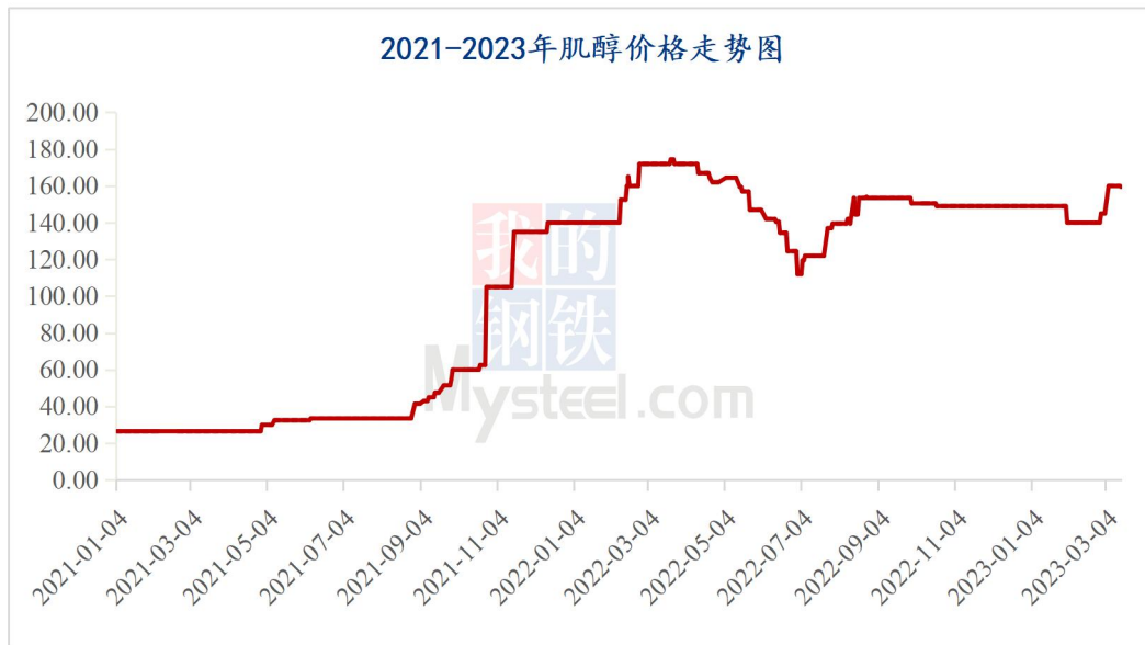
图 14 2021-2023 年肌醇价格走势图