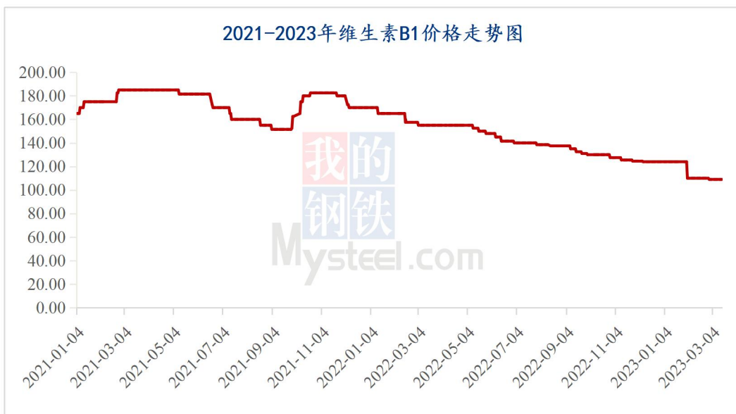
图 6 2021-2023 年维生素 B1 价格走势

本周国内维生素 B1 市场报价在 106-110 元/kg，下游需求较弱，询单较为平淡，工厂报价下调，市场渠道价格走弱。