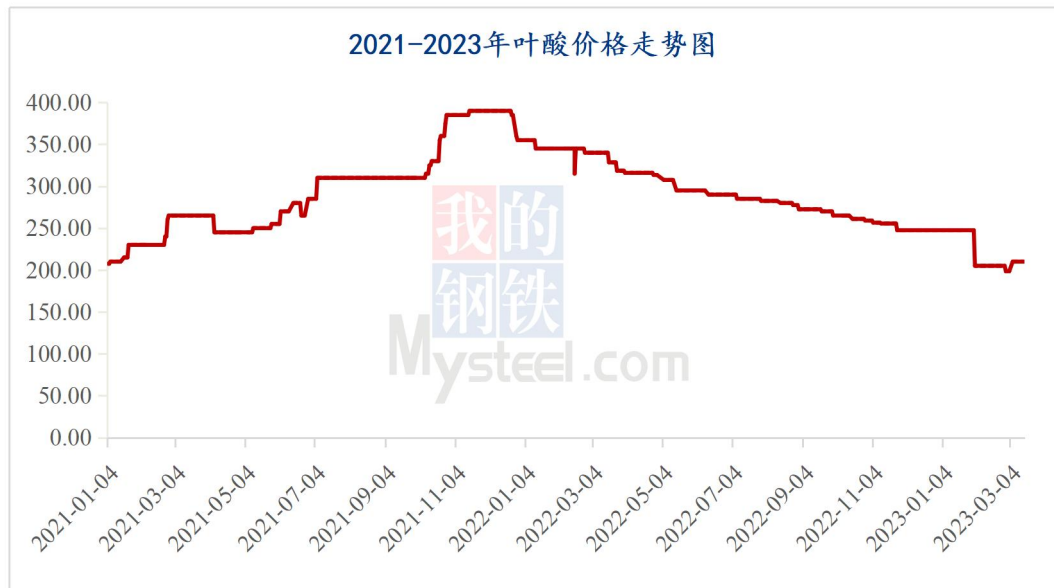
图 11 2021-2023 年叶酸价格走势