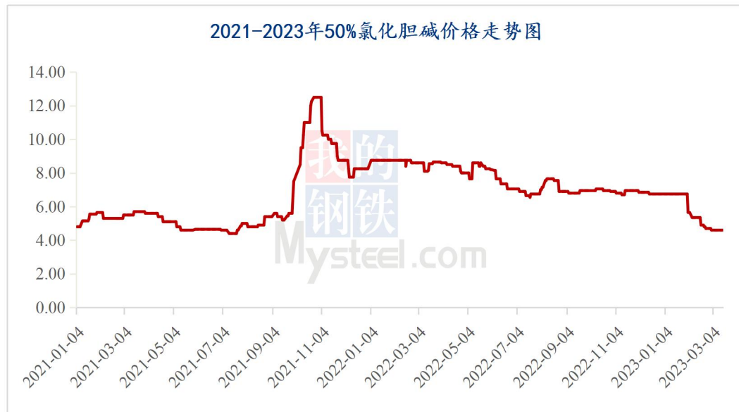
图 16 2021-2023 年氯化胆碱价格走势

本周国内氯化胆碱市场价格 4.5-4.8 元/kg。胆碱，受原料三甲胺价格波动，胆碱工厂报价动态调整，后续主要关注三甲胺变化情况。