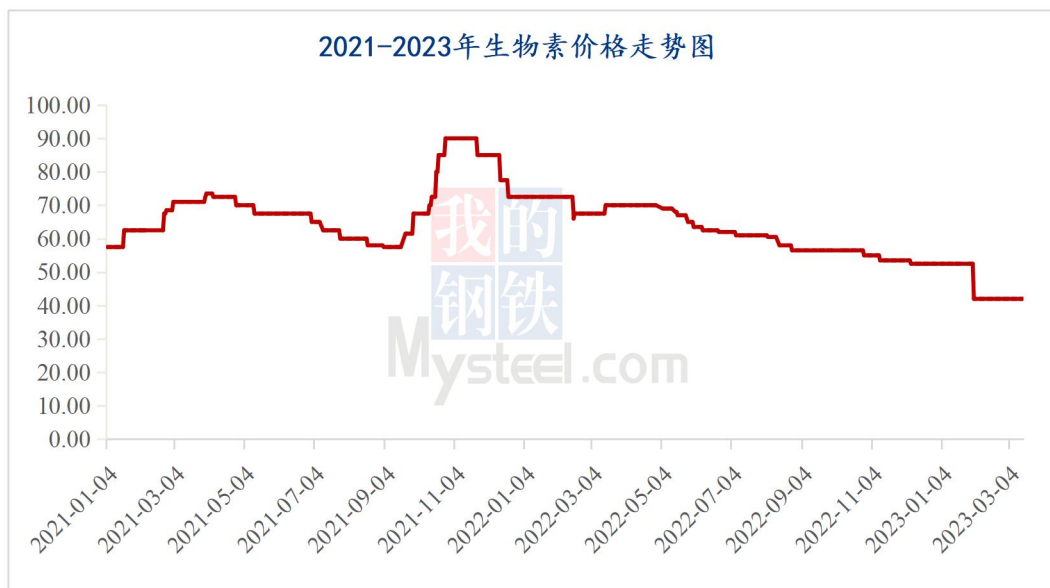
图 12 2021-2023 年生物素价格走势

本周国内 2%生物素市场价格在 40-42 元/kg，市场询单一般，交投价格平稳偏弱，部分价格略低。