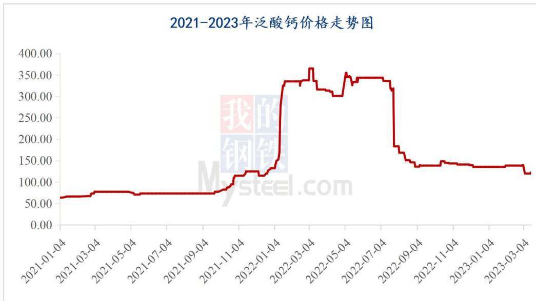
图 5 2021-2023 年泛酸钙价格走势