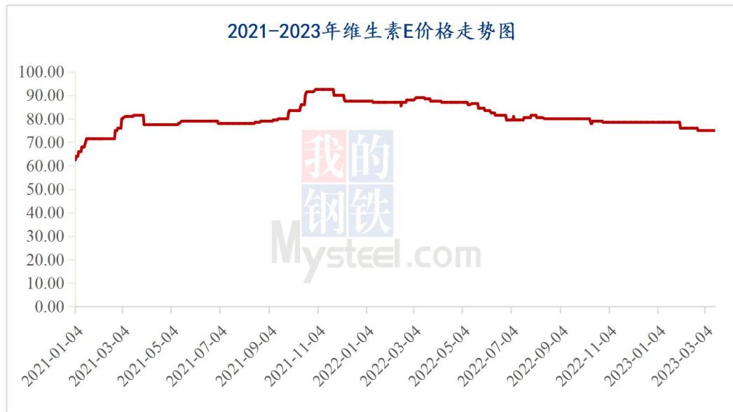
图 2 2021-2023 年维生素 E 价格走势图