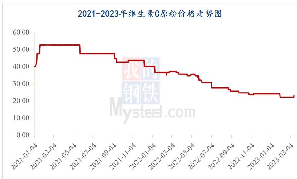
图 3 2021-2023 年维生素 C 价格走势图

本周 VC 原粉国内市场报价 20-22 元/kg，下游需求一般，终端适量补货，部分品牌略低一些。