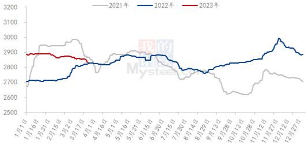
图 17 2021-2023 年全国玉米均价走势图