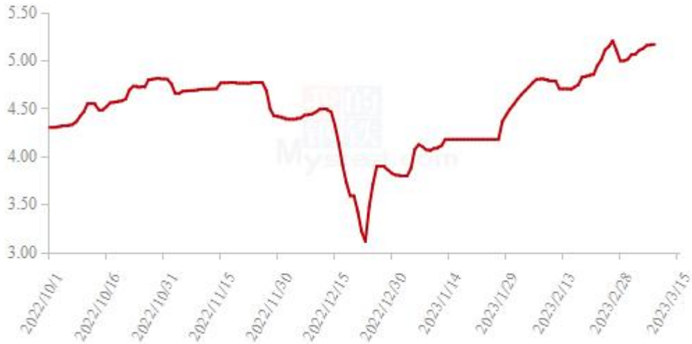
图 19 全国白羽肉鸡均价走势图