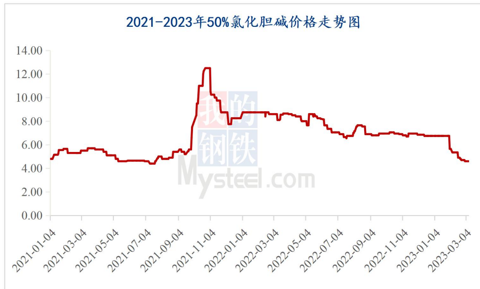
图 16 2021-2023 年氯化胆碱价格走势

本周国内氯化胆碱市场价格 4.5-4.8 元/kg。胆碱，受原料三甲胺价格高位波动，胆碱工厂报价动态调整，后续主要关注三甲胺变化情况。