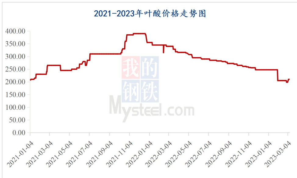
图 11 2021-2023 年叶酸价格走势