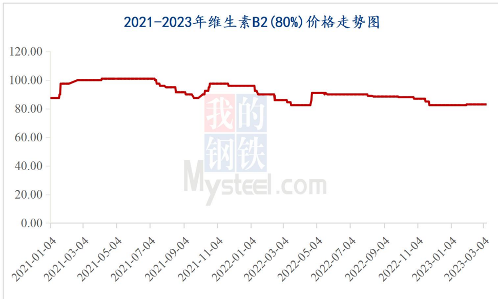
图 7 2021-2023 年维生素 B2 (80%) 价格走势

本周国内 VB2(80%)市场价格 80-85 元/kg，欧洲市场价格 15.50-16.50 欧元/kg，VB2(98%)市场价格 325-350 元/kg。市场需求一般，整体报价有维持平稳，根据品牌、日期不同，局部价格略低。