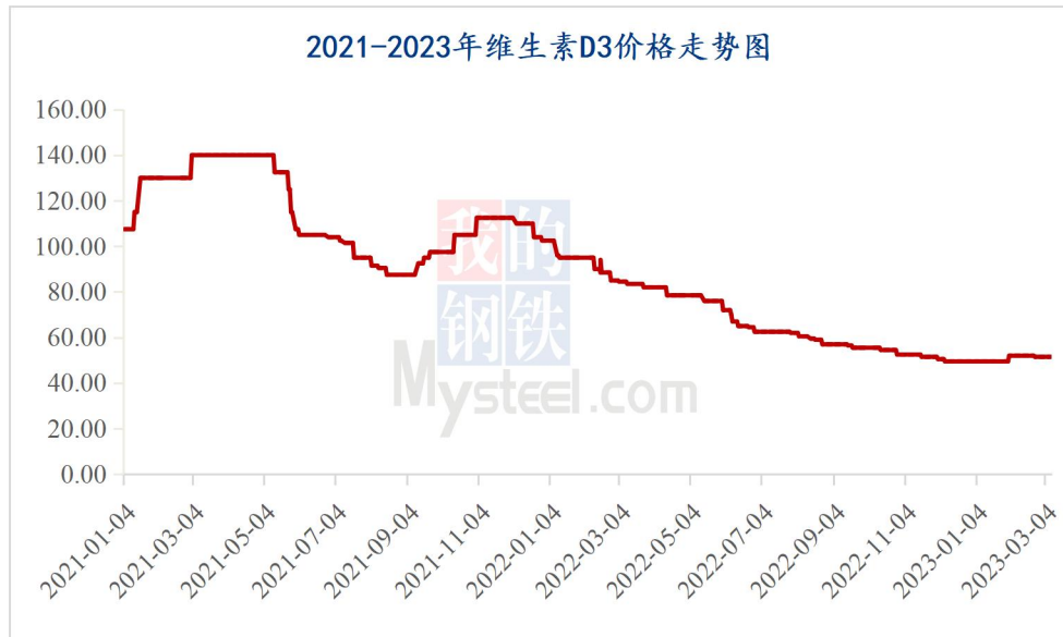
图 4 2021-2023 年维生素 D3 价格走势图

本周国内维生素 D3 国内市场主流价格为 50-54 元/kg，欧洲市场报价为 7.00-8.00 欧元/kg。市场需求偏淡，询单一般，经销渠道出货积极，价格平稳偏弱。