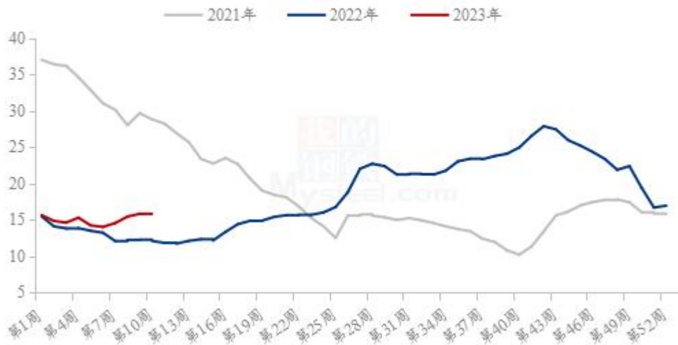
图 18 全国外三元生猪出栏均价走势图