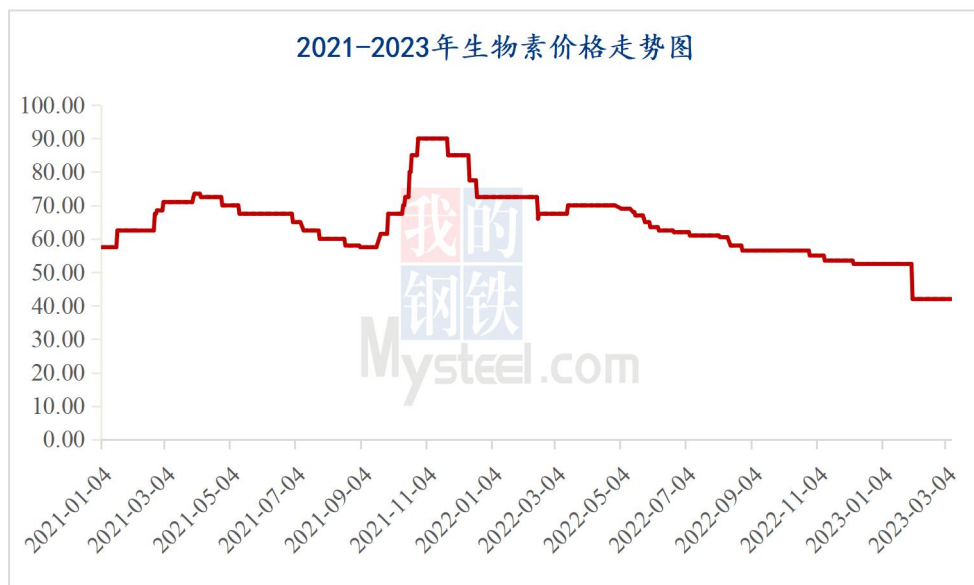
图 12 2021-2023 年生物素价格走势

本周国内 2%生物素市场价格在 40-43 元/kg，市场询单一般，交投价格平稳偏弱，部分价格略低。