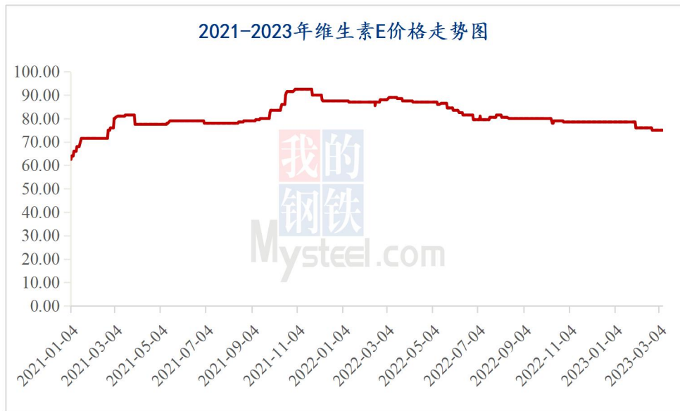
图 2 2021-2023 年维生素 E 价格走势图