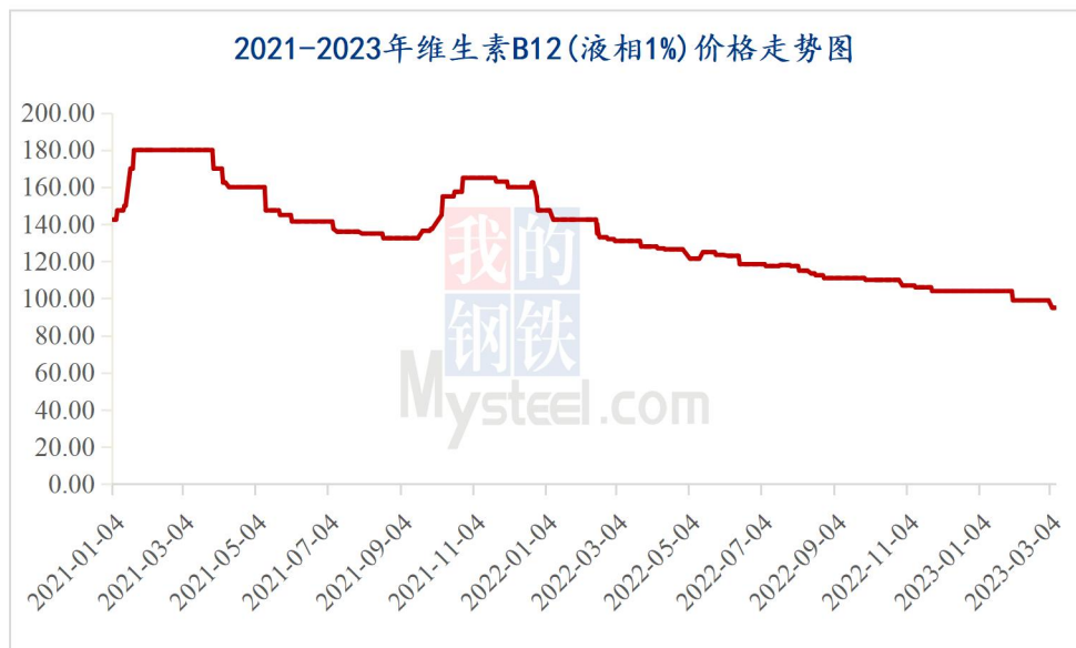
图 9 2021-2023 年维生素 B12 价格走势图