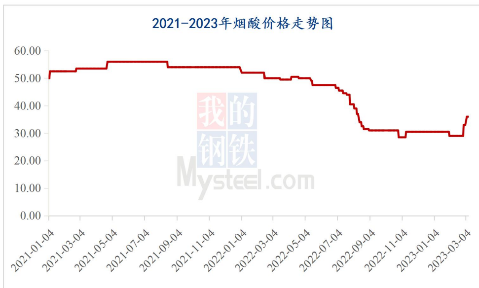
图 15 2021-2023 年烟酸价格走势图

本周国内市场主流报价 33-35 元/kg，市场整体相对平稳。受上游原料供应及年前低价接单等综合影响，导致年后各工厂交货相对紧张，主流工厂选择停报观望，市场供货暂时出现一定缺口，成交价格也随之小幅上涨。