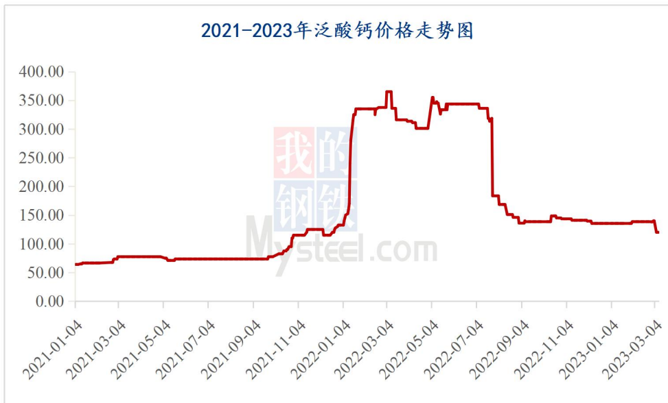
图 5 2021-2023 年泛酸钙价格走势