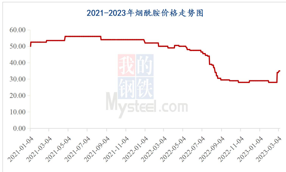
图 13 2021-2023 年烟酰胺价格走势图

本周国内市场主流报价 32-34 元/kg，由于上游原材料紧缺，产品供应出现缺口，工厂挺价意愿明显，目前主流出口报价基本在 USD 4.0-4.2，国内 RMB 31-32 左右，交期基本延至第二季度，市场活跃度，国内外询单量明显增加，短期内小幅上涨趋势明显。