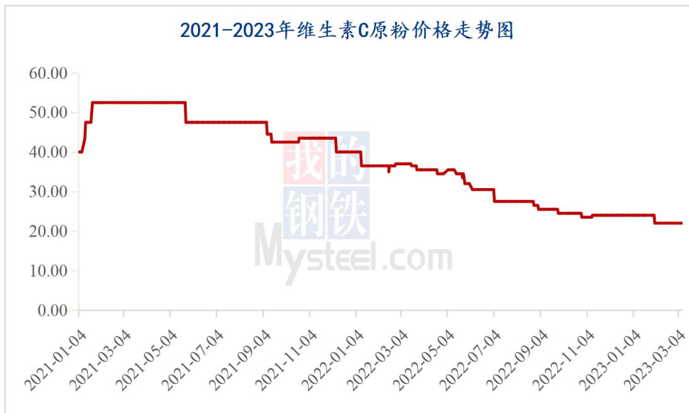
图 3 2021-2023 年维生素 C 价格走势图

本周 VC 原粉国内市场报价 19.5-21 元/kg，下游需求一般，终端适量补货，部分品牌略低一些。