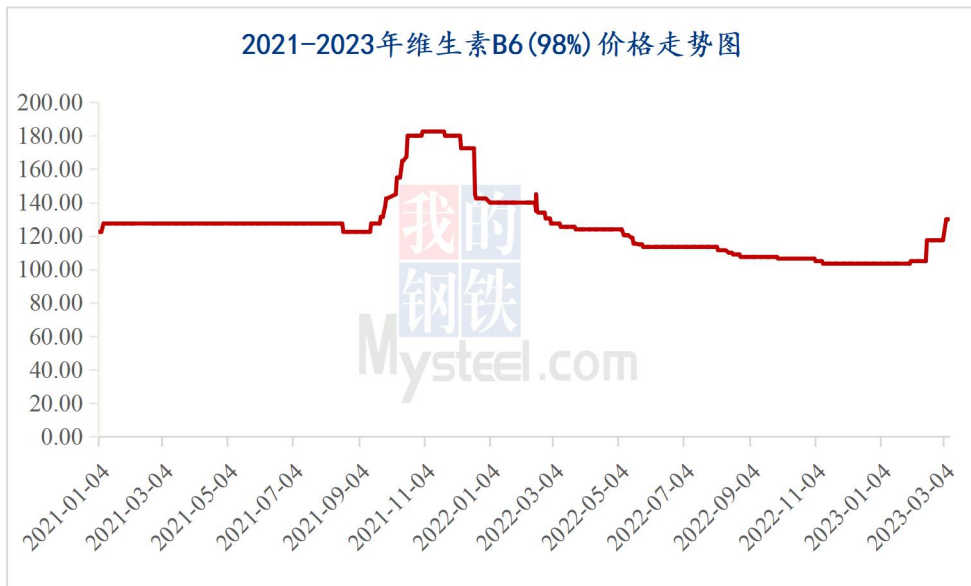
图 8 2021-2023 年维生素 B6 价格走势图