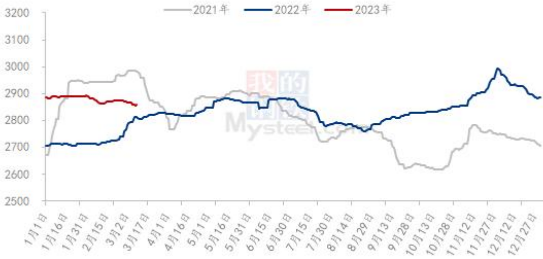
图 17 2021-2023 年全国玉米均价走势图