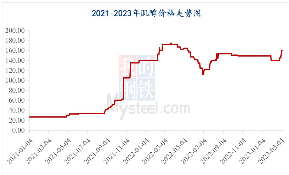
图 14 2021-2023 年肌醇价格走势图