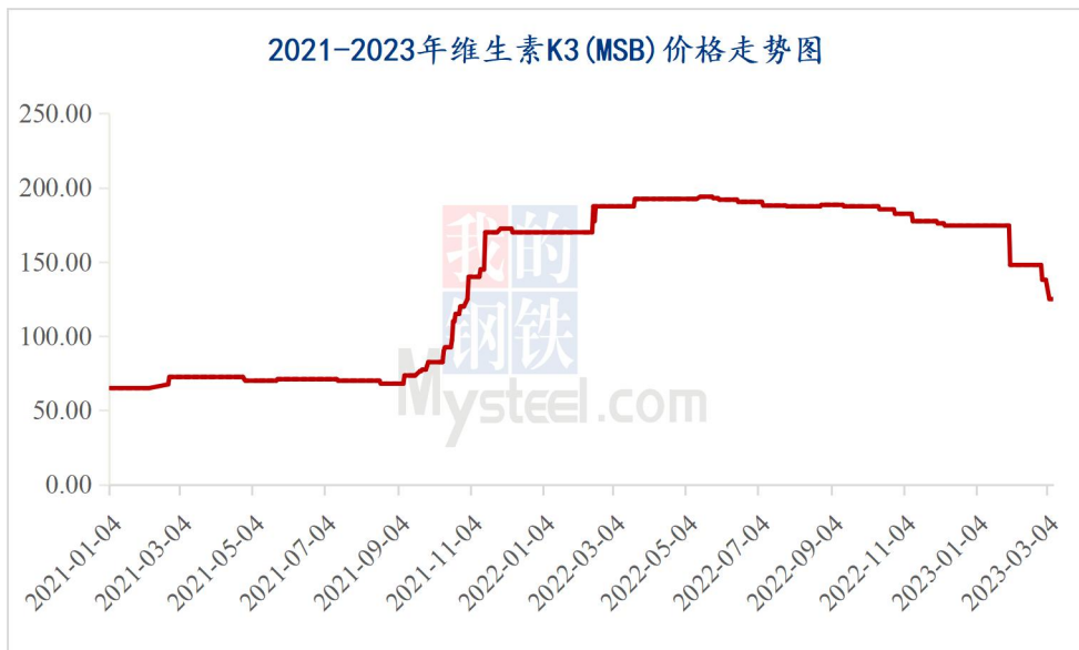
图 10 2021-2023 年维生素 K3 价格走势图

本周国内维生素 K3（MSB）市场主流价格在 110-118 元/kg，MNB 市场价格在 125-135 元/kg。市场需求一般，询单略平淡，K3 价格平稳偏弱。部分上游工厂停产检修。