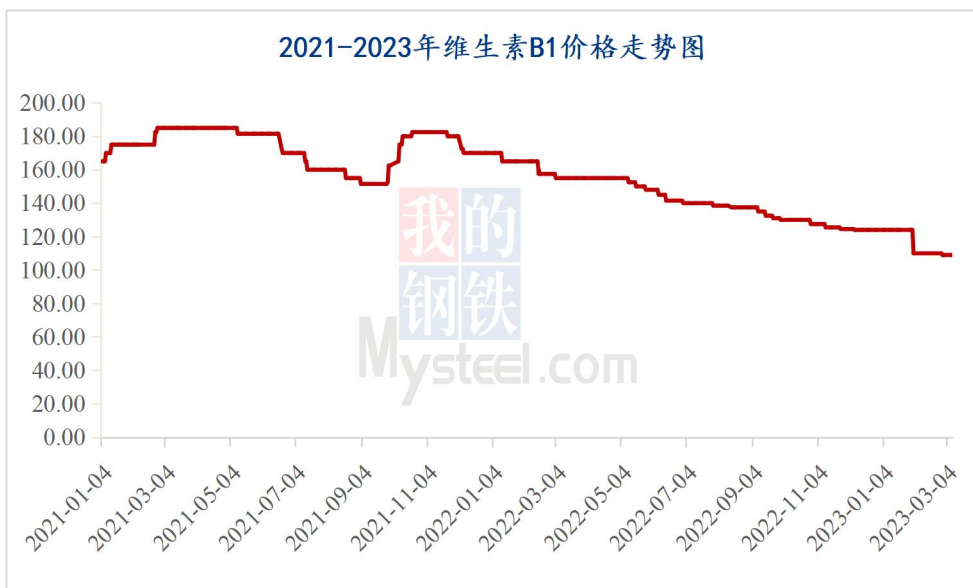
图 6 2021-2023 年维生素 B1 价格走势

本周国内维生素 B1 市场报价在 106-110 元/kg，下游需求较弱，询单较为平淡，工厂报价下调，市场渠道价格走弱。