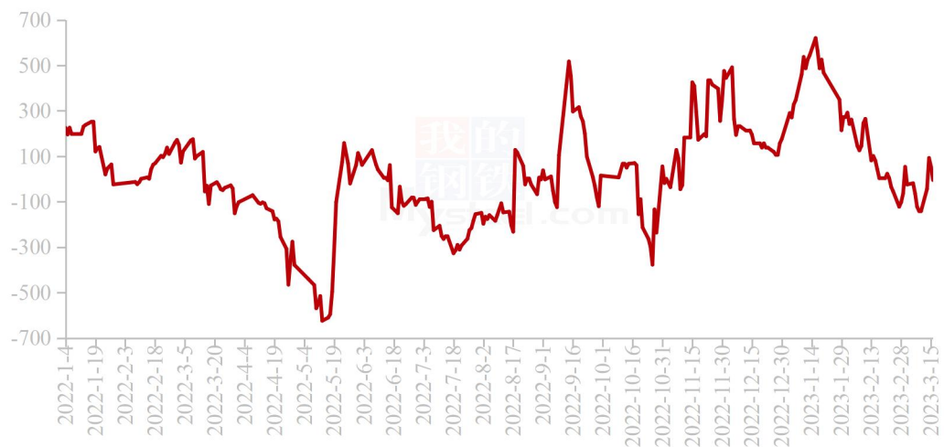
国内秘鲁68%超级蒸汽鱼粉进口利润走势图（单位：元/吨）