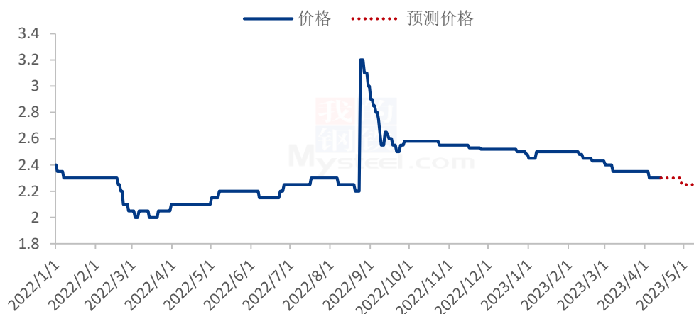
2023年赤峰张杂13号谷子价格走势预测（元/斤）

注：新陈粮交接，9月份开始市场流通新粮为主，Mysteel 农产品开始更新新粮报价。