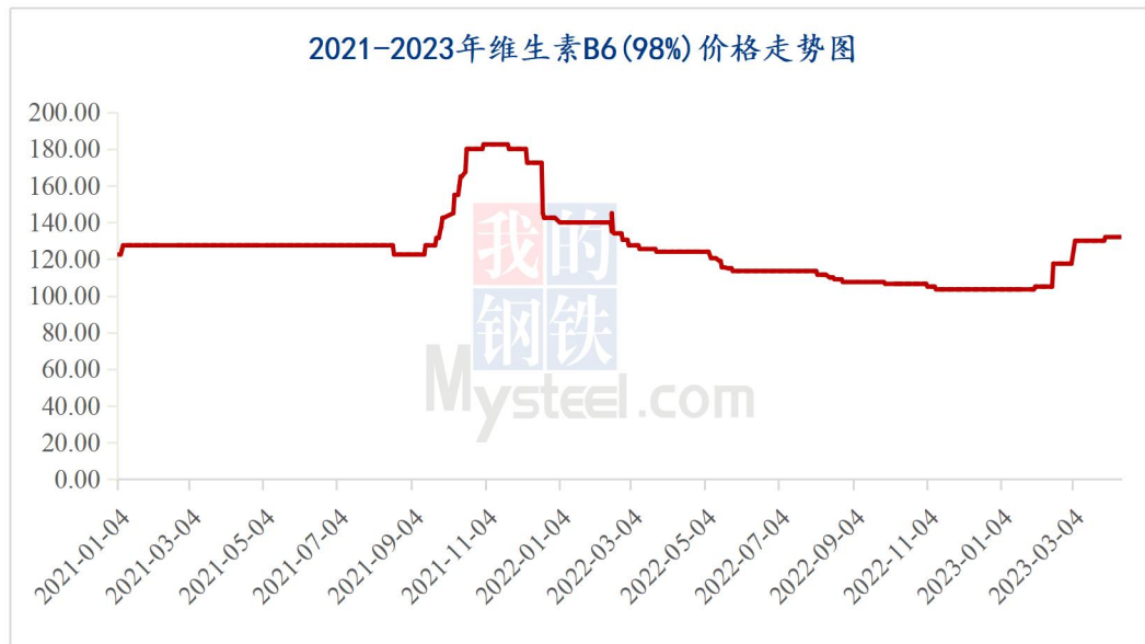
图 8 2021-2023 年维生素 B6 价格走势