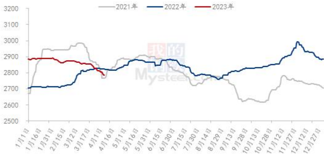
图 17 2021-2023 年全国玉米均价走势图