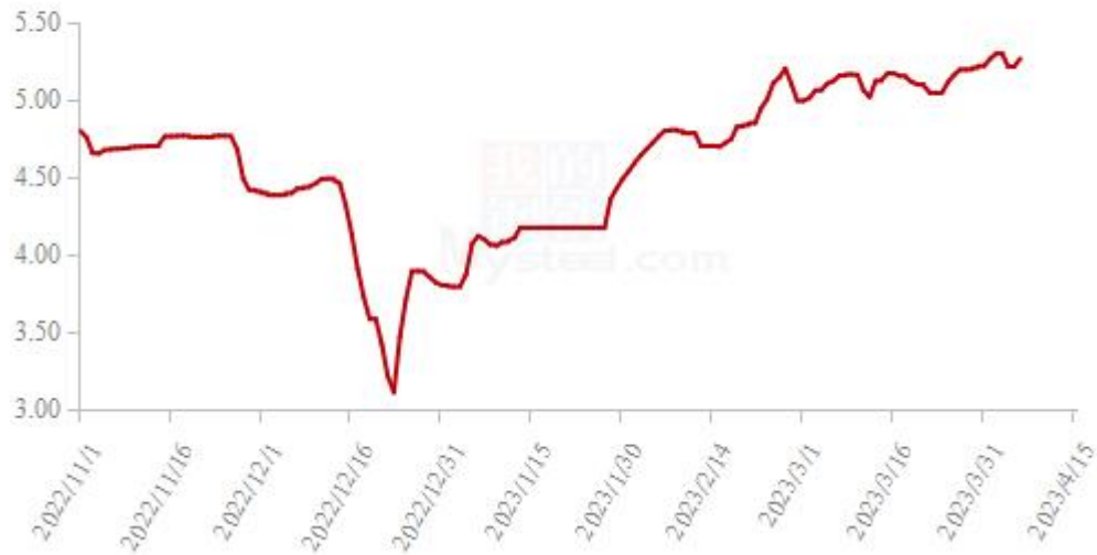
图 19 全国白羽肉鸡均价走势图