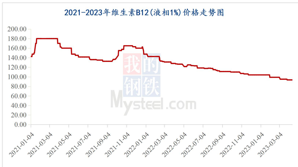
图 9 2021-2023 年维生素 B12 价格走势