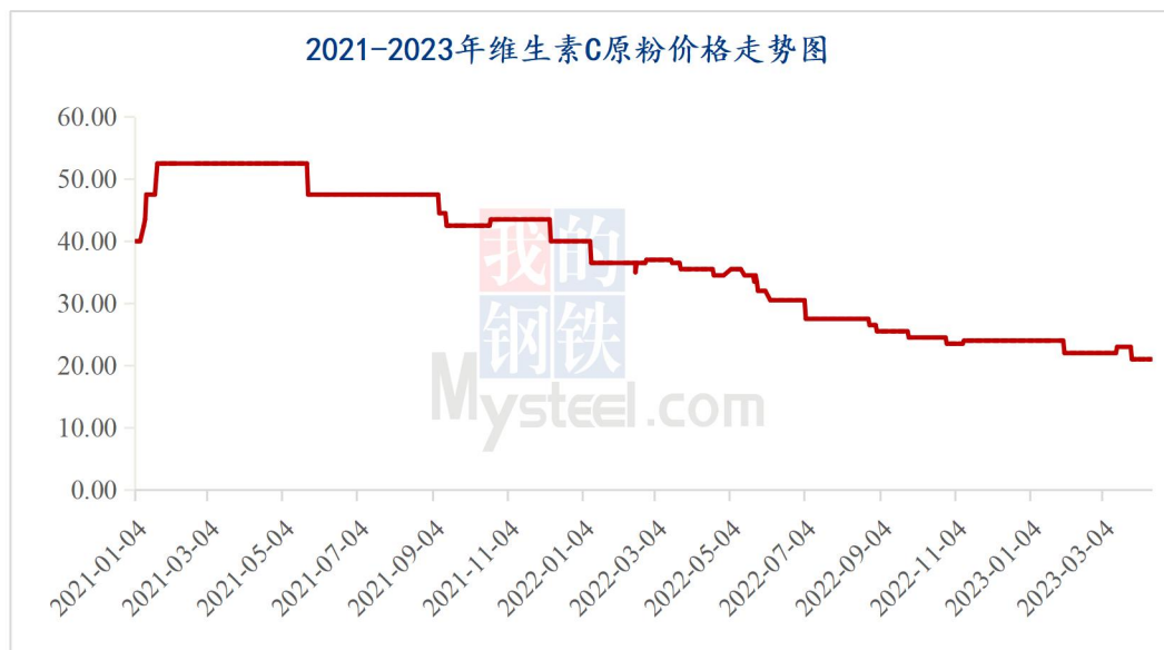
图 3 2021-2023 年维生素 C 价格走势图

本周 VC 原粉国内市场报价 20-22 元/kg，下游需求一般，终端适量补货，部分品牌略低一些。