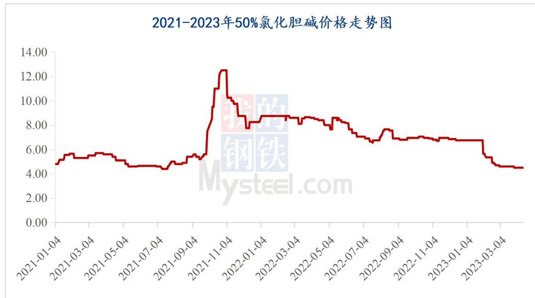
图 16 2021-2023 年氯化胆碱价格走势

本周国内氯化胆碱市场价格 4.4-4.7 元/kg。胆碱，受原料三甲胺价格波动，胆碱工厂报价动态调整，后续主要关注三甲胺变化情况。