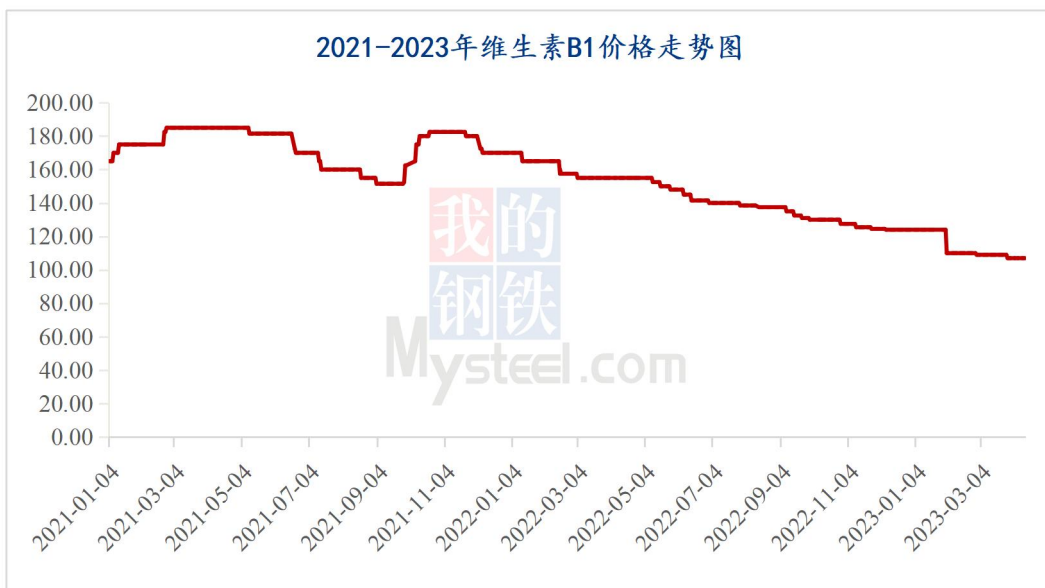
图 6 2021-2023 年维生素 B1 价格走势

本周国内维生素 B1 市场报价在 106-110 元/kg，下游需求较弱，询单较为平淡，上游工厂挺价意愿较强，不过市场询单较为平淡，价格平稳略弱。