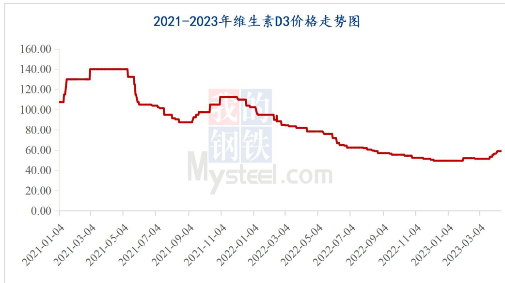
图 4 2021-2023 年维生素 D3 价格走势图

本周国内维生素 D3 国内市场主流价格为 57-60 元/kg，欧洲市场报价为 8.00-9.00 欧元/kg。市场需求一般，受市场信息影响，询单成交均有所活跃，经销渠道出货积极，价格偏强。4 月 3 日，受原料价格上涨等因素影响，天新药业饲料级维生素 D3 最新报价提高至 62 元/kg。市场需求偏淡，询单一般，经销渠道出货积极，价格平稳偏强。