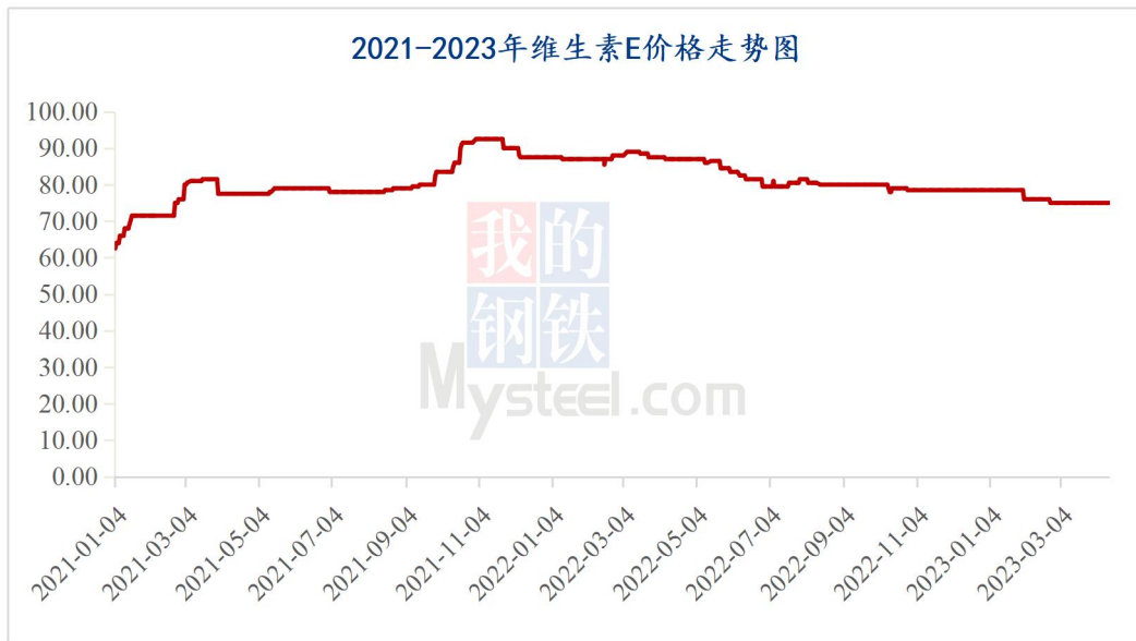
图 2 2021-2023 年维生素 E 价格走势图