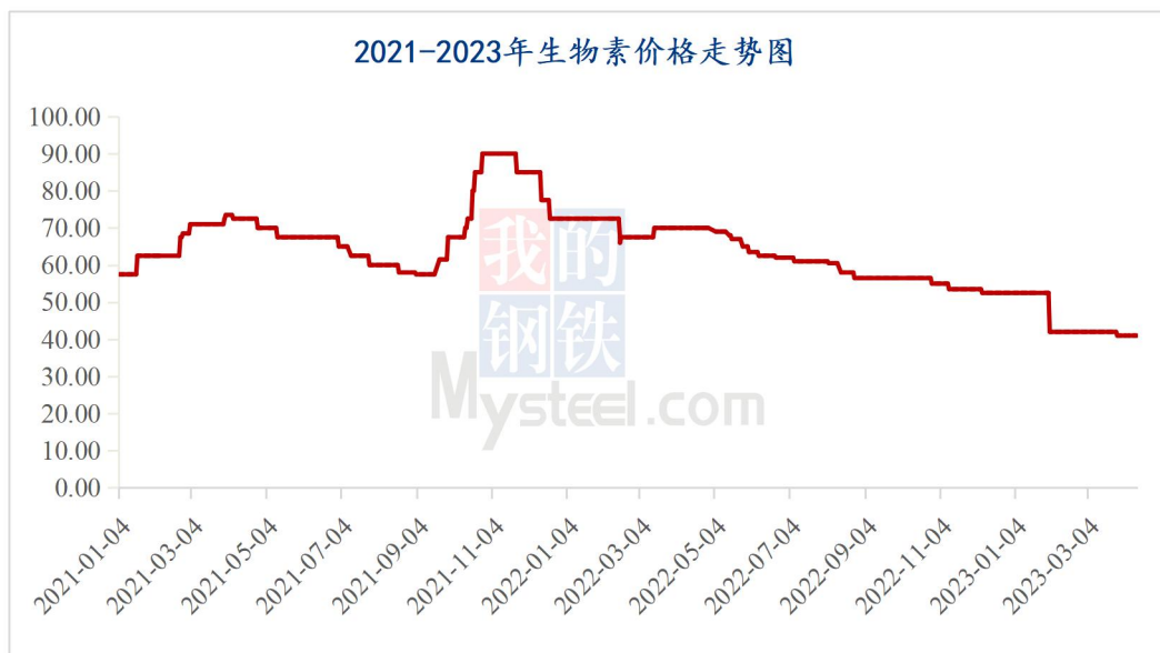
图 12 2021-2023 年生物素价格走势

本周国内 2%生物素市场价格在 40-43 元/kg，市场询单一般，交投价格平稳偏弱，部分价格略低。