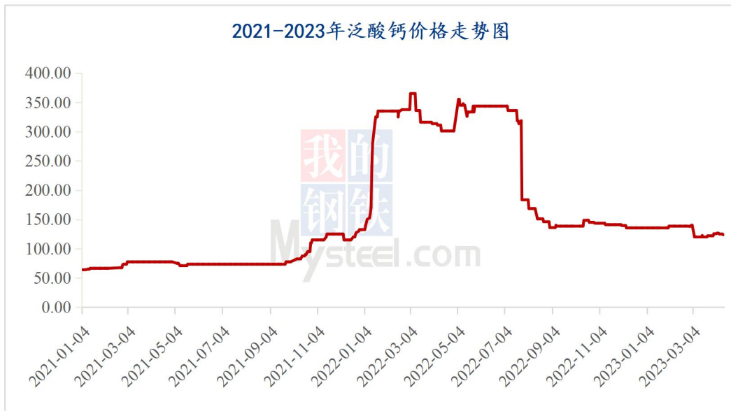
图 5 2021-2023 年泛酸钙价格走势