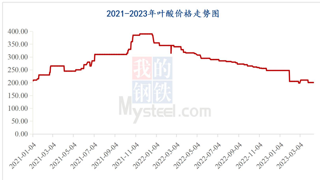
图 11 2021-2023 年叶酸价格走势