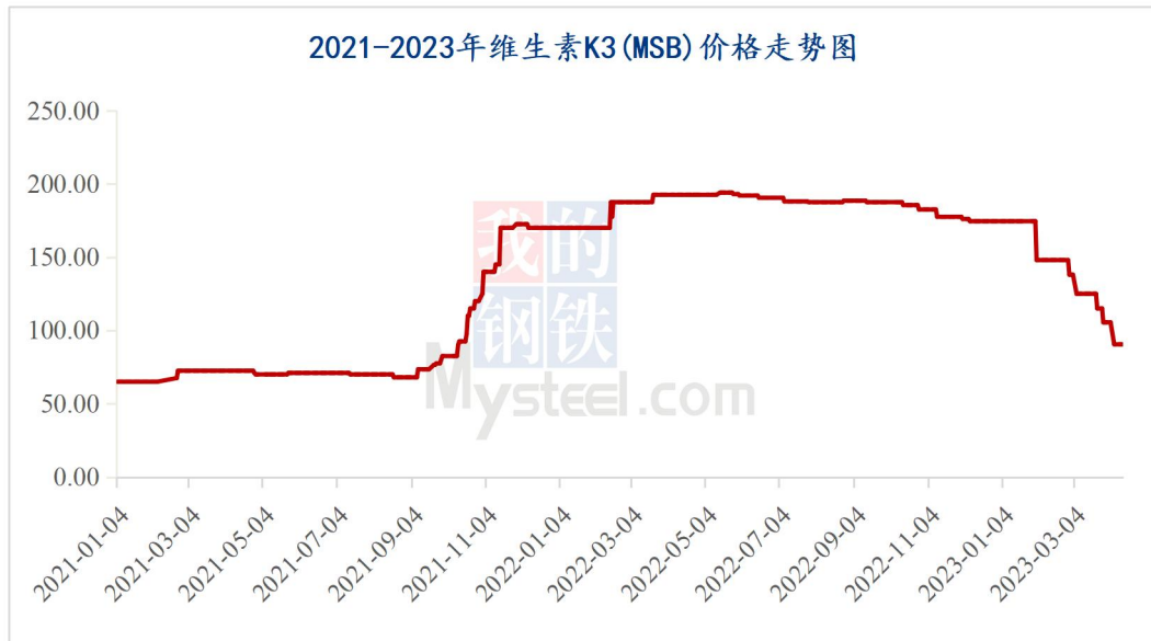
图 10 2021-2023 年维生素 K3 价格走势图

本周国内维生素 K3（MSB）市场主流价格在 100-105 元/kg，MNB 市场价格在 110-115 元/kg。市场需求一般，询单略平淡，K3 价格平稳偏弱。