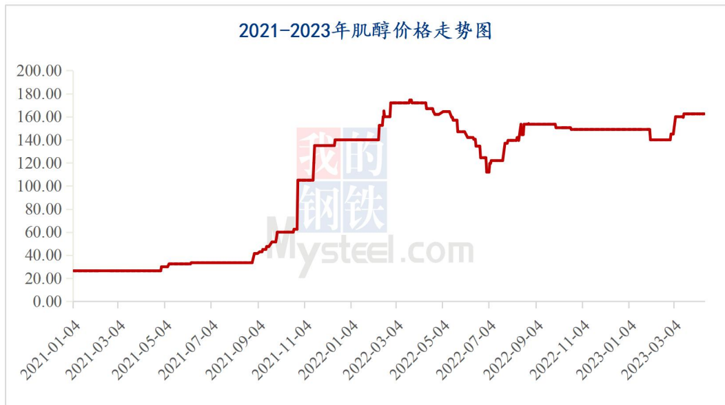
图 14 2021-2023 年肌醇价格走势图