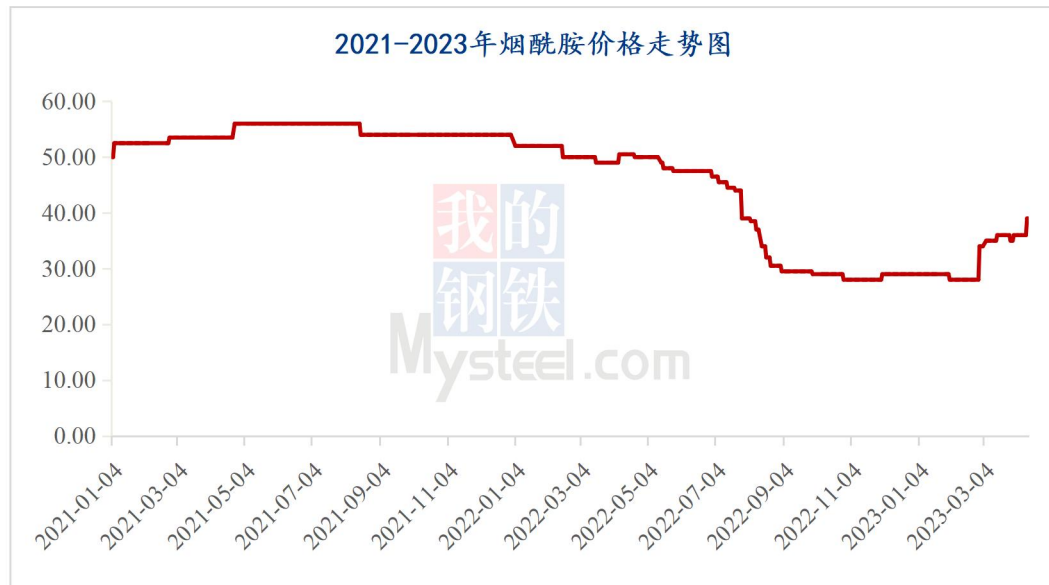
图 13 2021-2023 年烟酰胺价格走势图

本周国内市场主流报价 34-37 元/kg，由于上游原材料紧缺，产品供应出现缺口，工厂挺价意愿明显，目前主流出口报价基本在 USD 4.0-4.2，国内 RMB 31-32 左右，交期基本延至第二季度，市场活跃度，国内外询单量明显增加，短期内小幅上涨趋势明显。