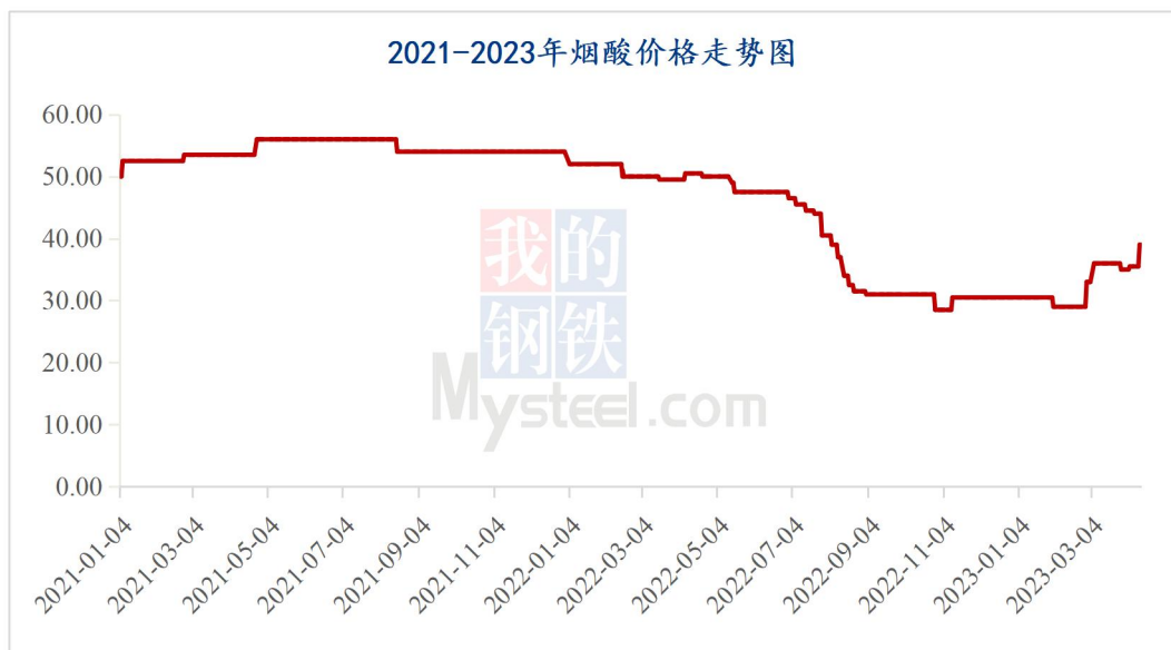
图 15 2021-2023 年烟酸价格走势图

本周国内市场主流报价 34-37 元/kg，市场整体相对平稳。受上游原料供应及年前低价接单等综合影响，导致年后各工厂交货相对紧张，主流工厂选择停报观望，市场供货暂时出现一定缺口，成交价格也随之小幅上涨。