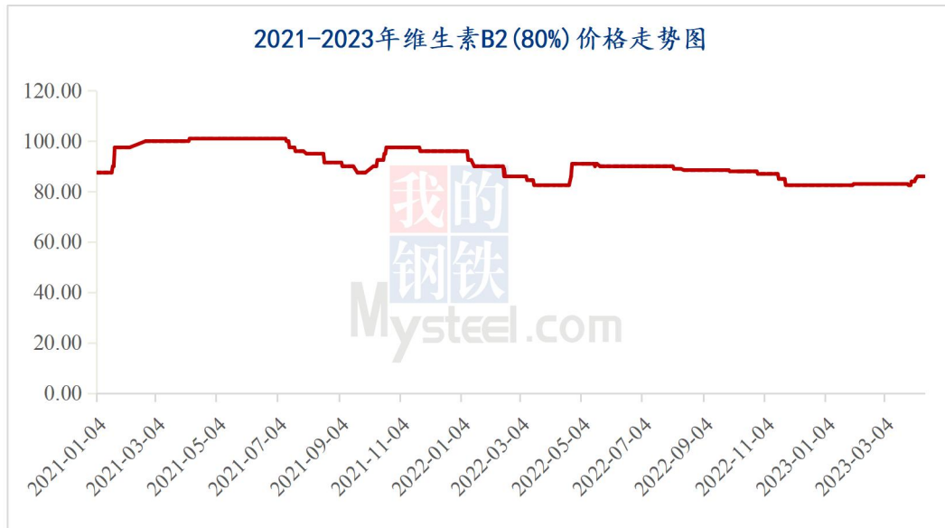
图 7 2021-2023 年维生素 B2 (80%) 价格走势图

本周国内 VB2(80%)市场价格 83-88 元/kg，欧洲市场价格 15.00-16.00 欧元/kg，VB2(98%)市场价格 325-350 元/kg。市场需求一般，整体报价有维持平稳，根据品牌、日期不同，局部价格略低。