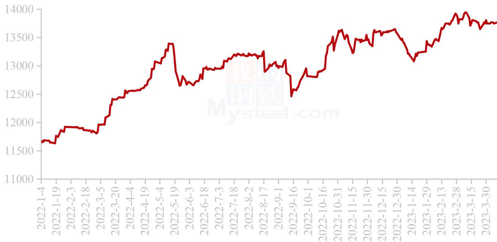
国内秘鲁68%超级蒸汽鱼粉进口成本走势图（单位：元/吨）