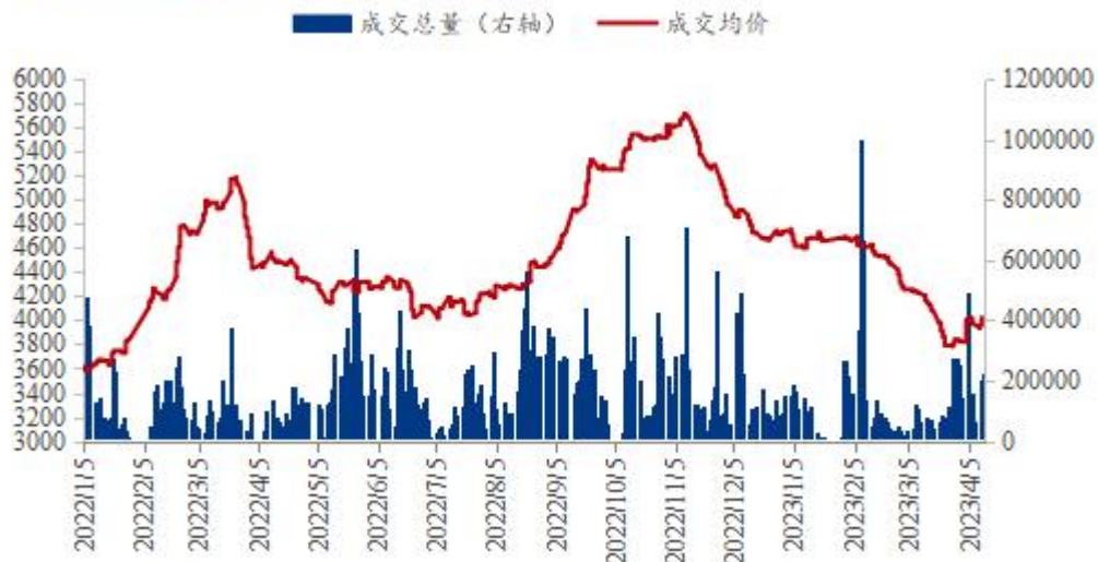
全国豆粕成交价量走势图（单位：吨）