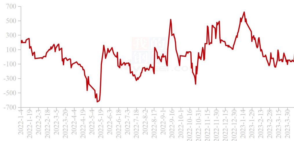
国内秘鲁68%超级蒸汽鱼粉进口利润走势图（单位：元/吨）