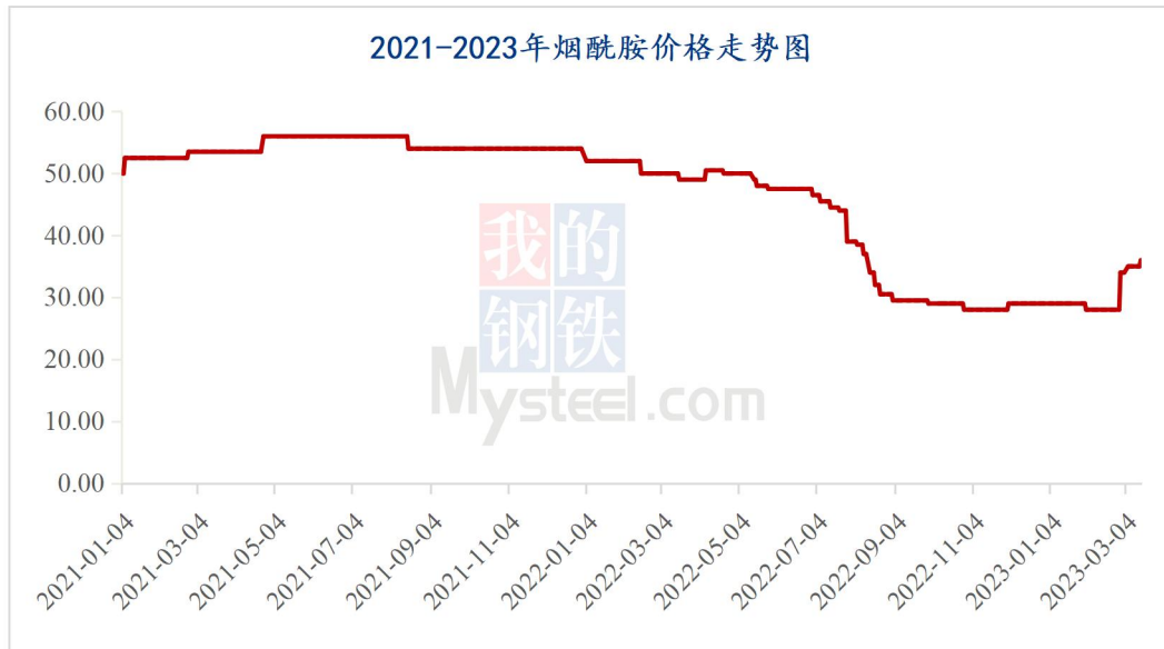
图 13 2021-2023 年烟酰胺价格走势图

国内市场主流报价 34-36 元/kg，由于上游原材料紧缺，产品供应出现缺口，工厂挺价意愿明显，目前主流出口报价基本在 USD 4.0-4.2，国内 RMB 31-32 左右，交期基本延至第二季度，市场活跃度，国内外询单量明显增加，短期内小幅上涨趋势明显。