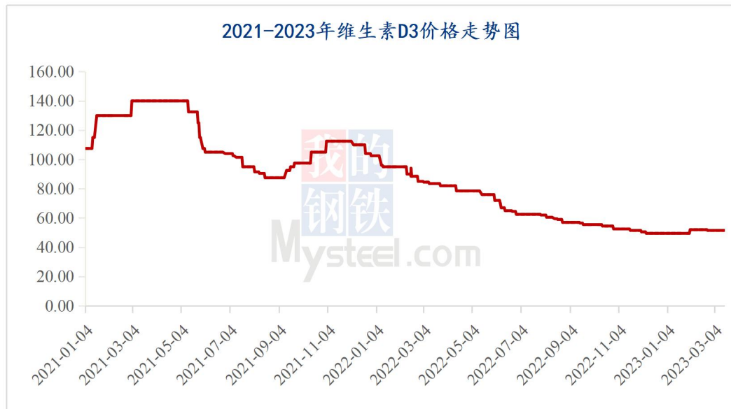
图 4 2021-2023 年维生素 D3 价格走势图

3月国内维生素D3国内市场主流价格为54-56元/kg，欧洲市场报价为7.00-8.50欧元/kg。市场需求偏淡，询单一般，经销渠道出货积极，价格平稳偏强。