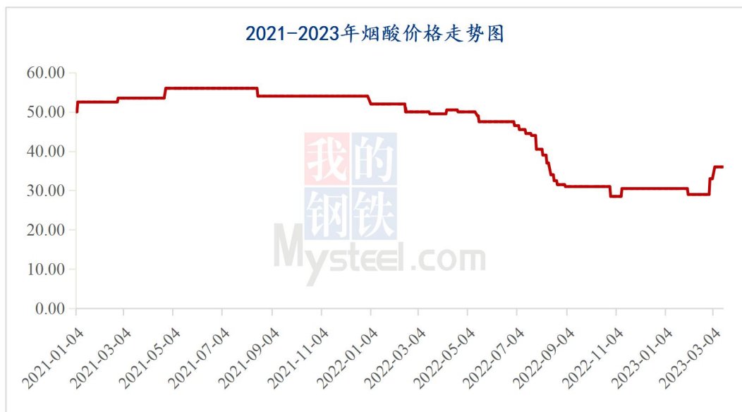
图 15 2021-2023 年烟酸价格走势图

国内市场主流报价 33-35 元/kg，市场整体相对平稳。受上游原料供应及年前低价接单等综合影响，导致年后各工厂交货相对紧张，主流工厂选择停报观望，市场供货暂时出现一定缺口，成交价格也随之小幅上涨。