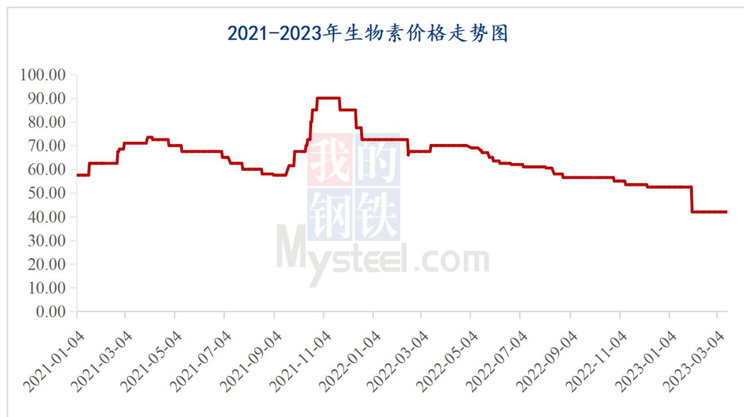
图 12 2021-2023 年生物素价格走势走势图

国内 2%生物素市场价格在 40-43 元/kg，市场询单一般，交投价格平稳偏弱，部分价格略低。