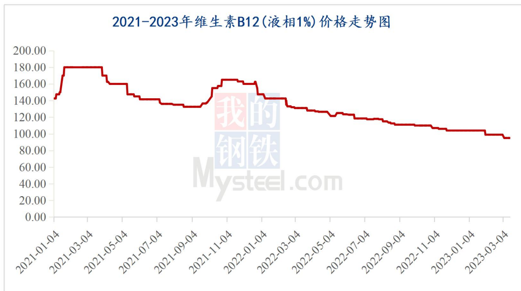
图 9 2021-2023 年维生素 B12 价格走势