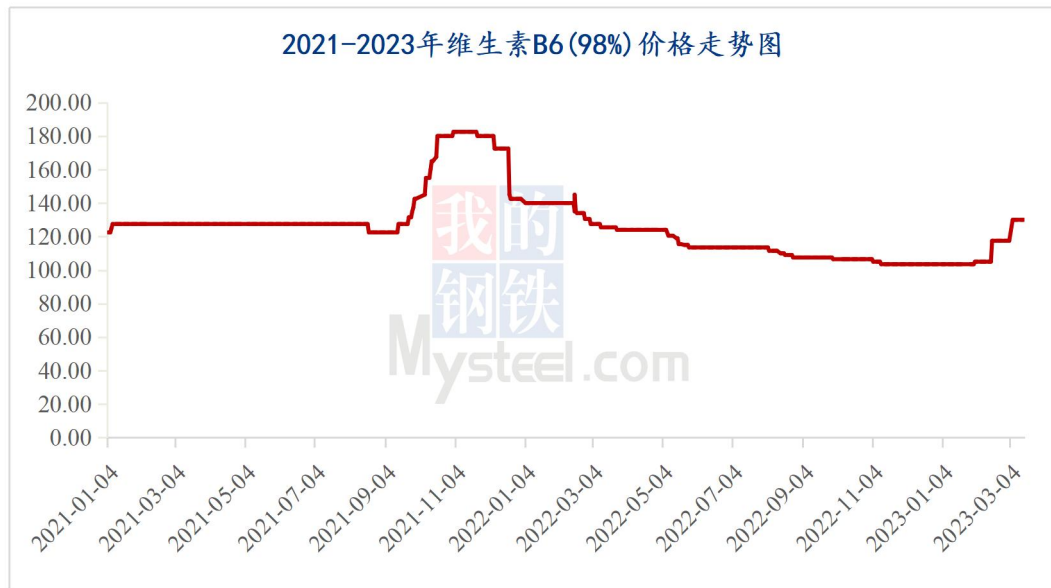
图 8 2021-2023 年维生素 B6 价格走势