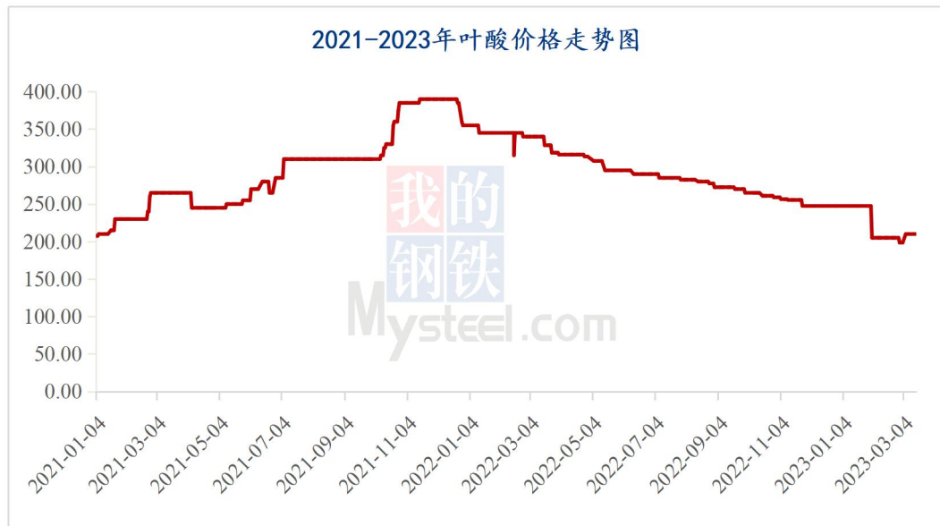
图 11 2021-2023 年叶酸价格走势走势图