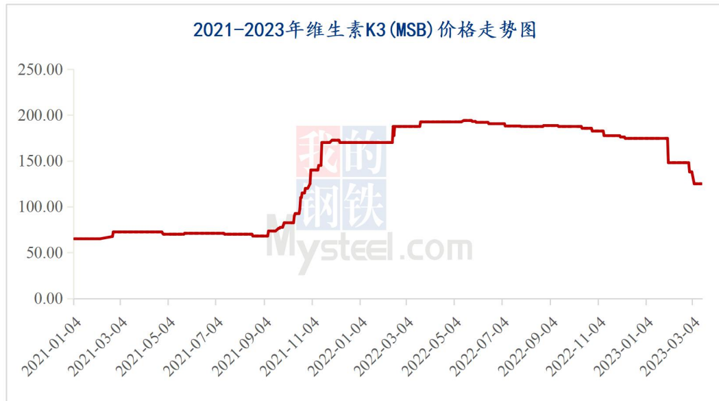
图 10 2021-2023 年维生素 K3 价格走势图

国内维生素 K3 (MSB) 市场主流价格在 102-110 元/kg, MNB 市场价格在 112-120 元/kg。市场需求一般, 询单略平淡, K3 价格平稳偏弱。