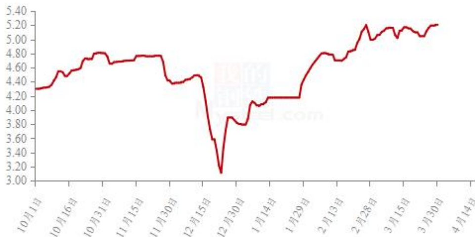
图 19 全国白羽肉鸡均价走势图