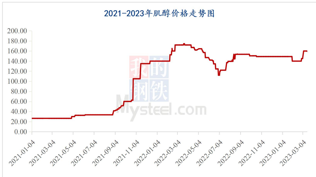
图 14 2021-2023 年肌醇价格走势图