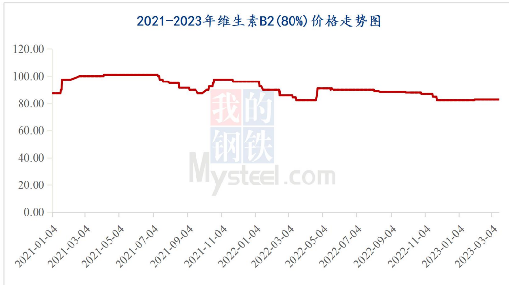
图 7 2021-2023 年维生素 B2 (80%) 价格走势图

3月国内 VB2(80%)市场价格 80-86 元/kg，欧洲市场价格 15.00-16.00 欧元/kg，VB2(98%)市场价格 325-350 元/kg。市场需求一般，整体报价有维持平稳，根据品牌、日期不同，局部价格略低。