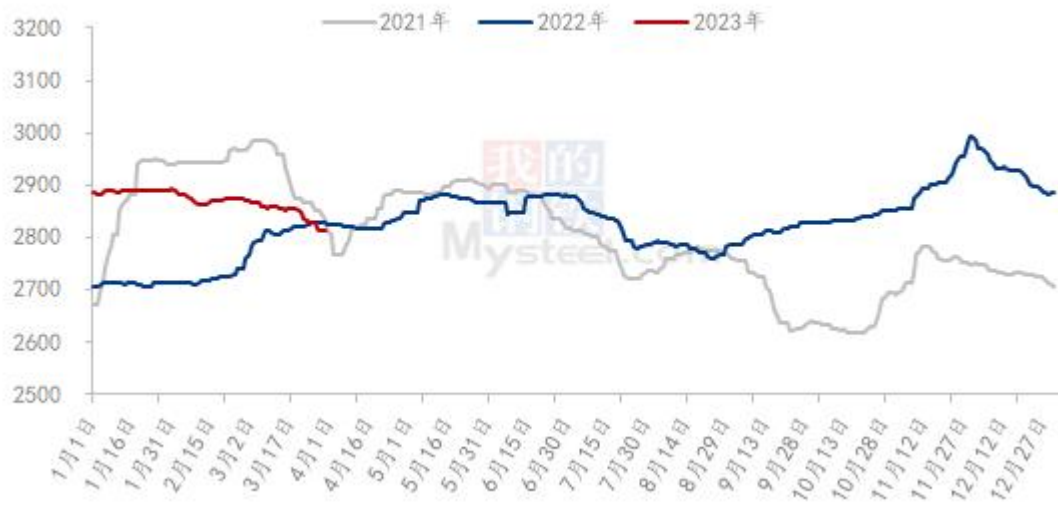
图 17 2021-2023 年全国玉米均价走势图