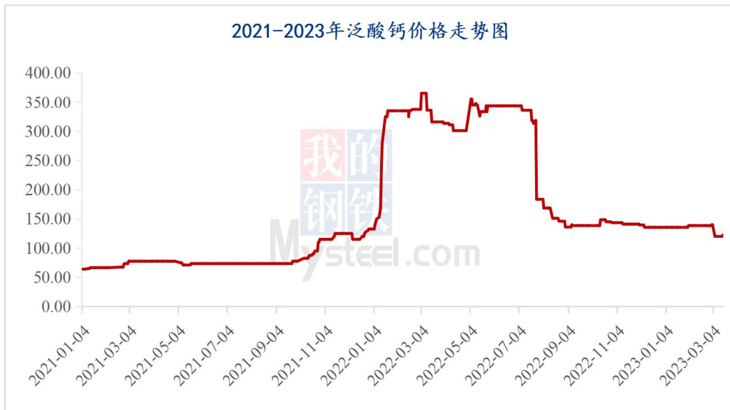
图 5 2021-2023 年泛酸钙价格走势图