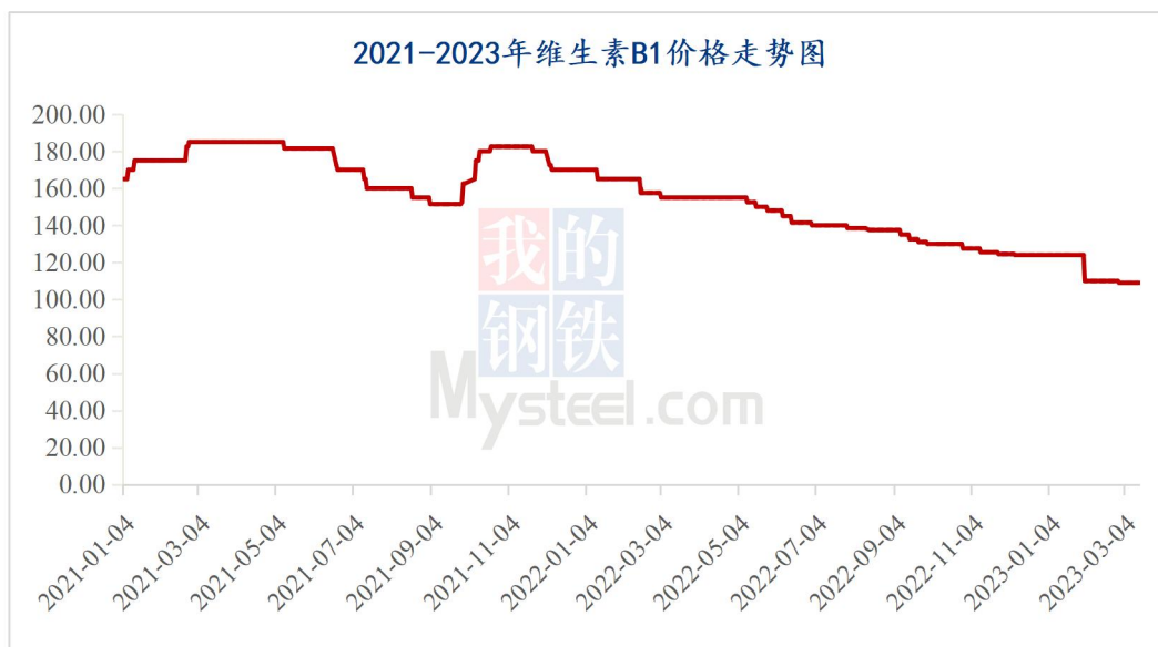
图 6 2021-2023 年维生素 B1 价格走势图

3月国内维生素B1市场报价在106-110元/kg，下游需求较弱，询单较为平淡，上游工厂挺价意愿较强，不过市场询单较为平淡，价格平稳略弱。